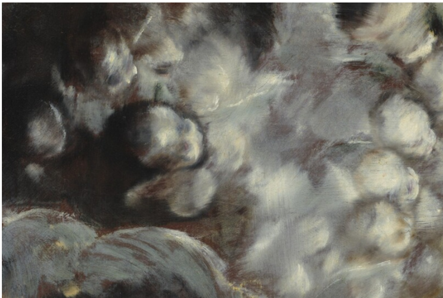
Madonna con il Bambino e le sante Martina e Agnese, Dett. 1597-99. Washington, National Gallery of Art