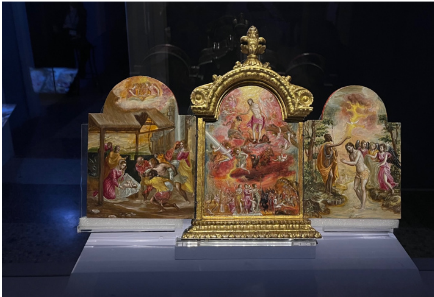
Trittico di Modena , 1567-69 circa. Modena, Galleria estense.

A Venezia frequenta, sembra, l'atelier di Tiziano, ma assorbe anche la lezione di Tintoretto e Bassano (presenti in mostra con alcune opere), che poi integra con la conoscenza del contesto romano, dove, invitato nel 1570 da Giulio Clovio e presentato come dotato ritrattista (subito riconosciuto come tale anche quando si trasferirà in Spagna, dove il suo più grande ammiratore sarà nientemeno che Velázquez), viene accolto da uno dei più grandi collezionisti del tempo, il cardinal Farnese.