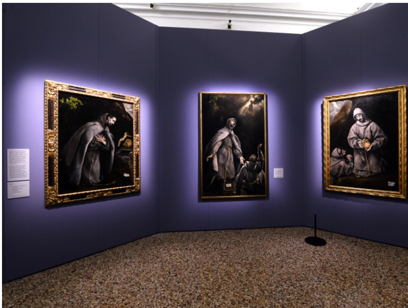
Foto allestimento con 3 quadri di San Francesco.

Cristo che porta la croce , 1585-1590 circa. Barcellona, collezione privata.