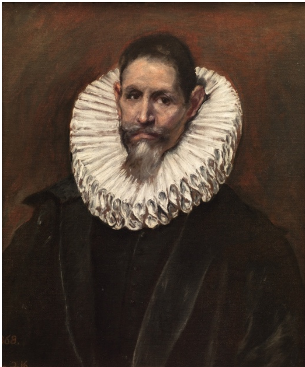
Ritratto di Jerónimo de Cevallos , 1613 circa, Madrid, Museu Nacional del Prado.

San Luca , 1602-1605 circa. Toledo, Cattedrale primaziale.