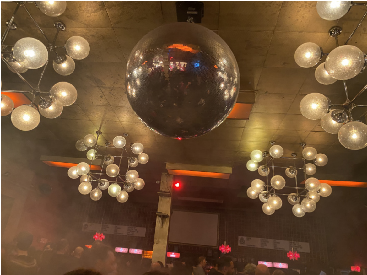
I lampadari DDR al club Astra.