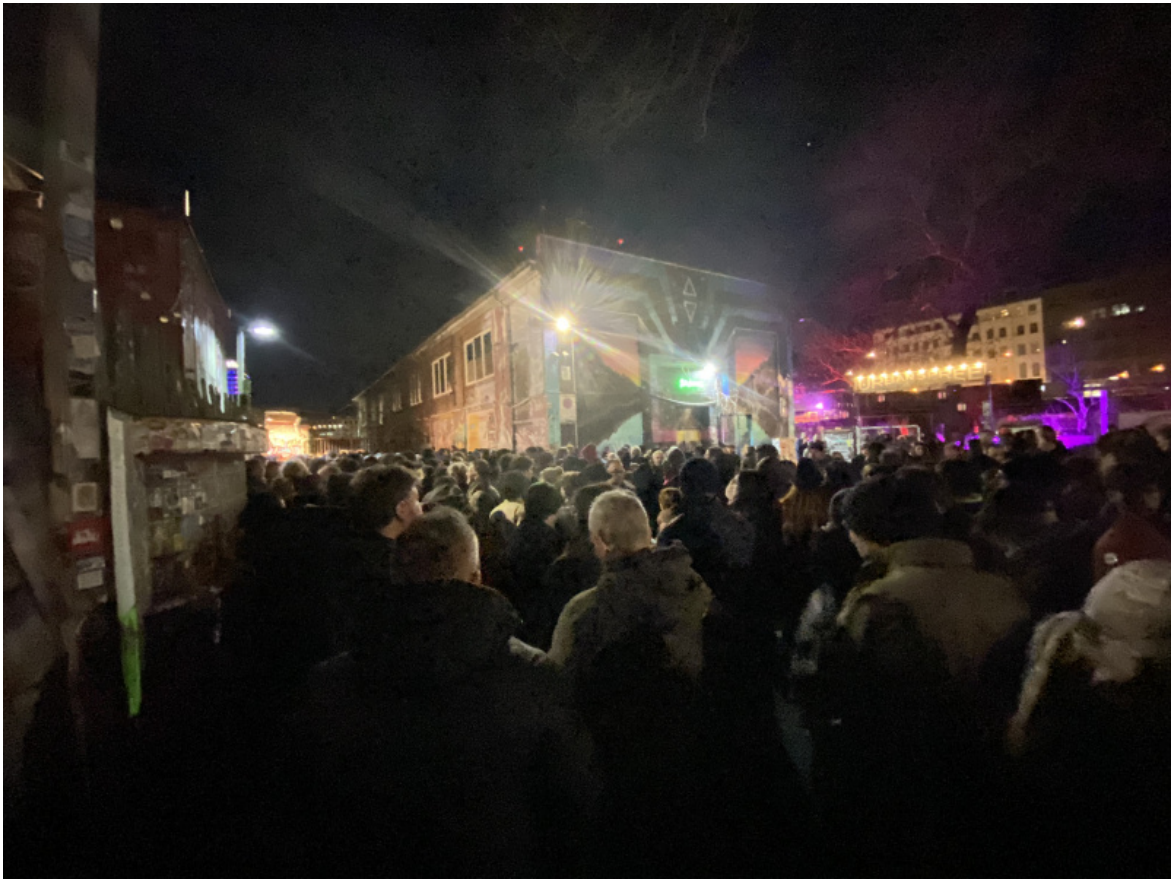
La coda per l'ingresso

Il benvenuto in DDR, nella ex casa della cultura Astra , è stato dato da una serie di lampadari "smantellati" (anche loro) proprio da quel Palazzo della Repubblica a cui si accennava in precedenza.