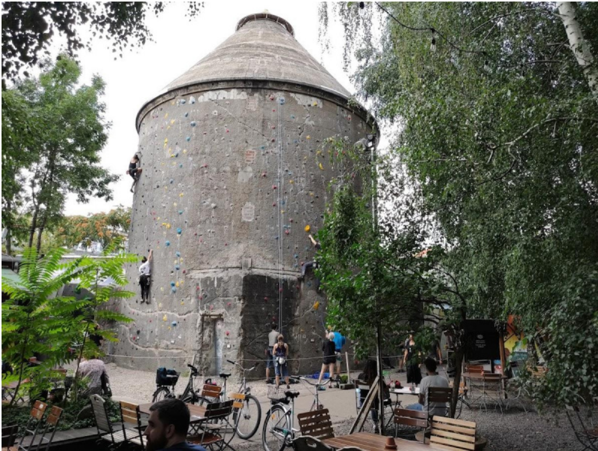
L'ex bunker trasformato in "cono da arrampicata".

Lo spaccio di droga che fa da contorno alle nottate della movida berlinese ha creato non pochi problemi, le molte petizioni da parte dei residenti che chiedono la bonifica dell'area e l'appetibilità della zona da parte degli speculatori costituiscono una continua minaccia alla sopravvivenza dello spazio, ma il nuovo proprietario, la società immobiliare Göttingen Kurth, pare aver dichiarato di non voler cambiare nulla dell'orientamento fondamentale del luogo. Proprio al club Astra Kulturhaus che opera su questo territorio hanno deciso di suonare i CCCP. In quel pezzo di DDR smantellata ma non del tutto distrutta che, con diverse fortune, ancora trova cose da dire nel panorama delle sempre più omologate notti berlinesi.