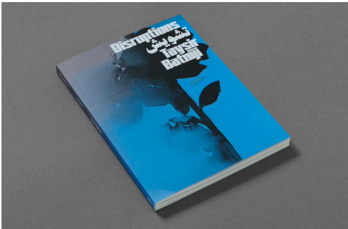
Disruptions, © Taysir Batniji 2024 courtesy Loose Joints.