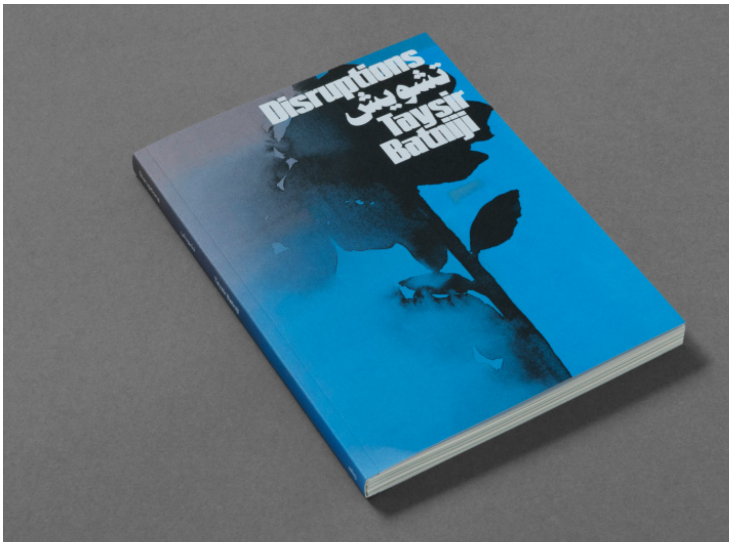
Disruptions, © Taysir Batniji 2024 courtesy Loose Joints.