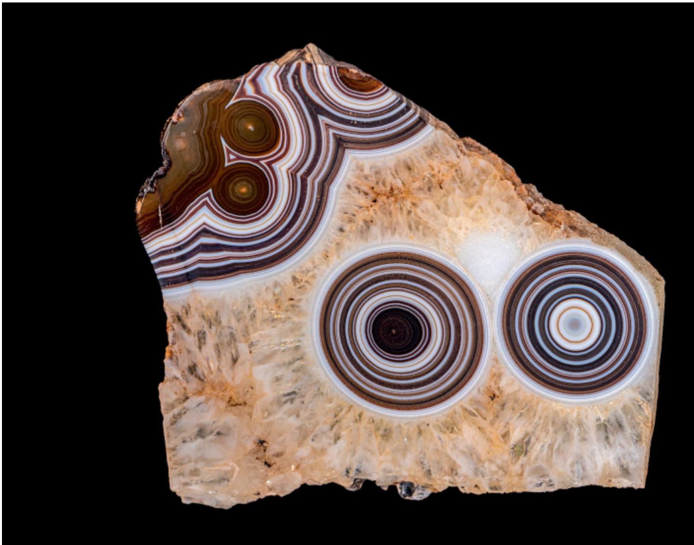
Agata con forme di occhi, frammento Uruguay Sezione spessa segata e levigata, 15 x 13 cm, Donazione Callois, 1984-1985 MNH, INV. MIN008-152, Inventariata Monocle et binocles poi Oeil et monocle, titoli probabilmente apocrifi.

L ^ ignoto si connette al fantastico, ne ^ un motivo ispiratore, e il grande merito di questo filosofo del mondo naturale, vivo e morto insieme, ^ quello d ^ aver fatto uscire le pietre figurate dal regno minerale per proporle come forme di un linguaggio universale avviando un antropomorfismo alla rovescia come ha detto Marguerite Yourcenar nel discorso a lui dedicato, quando gli ^ succeduta alla Acad ^ mie fran ^ aise : "Caillois esaltava un antropomorfismo alla rovescia, nel quale l ^ uomo, lungi dall ^ attribuire, e a volte con condiscendenza, le sue proprie emozioni agli altri esseri viventi, partecipa con umilt ^ , forse anche con orgoglio, a tutto ci ^ che ^ incluso o era infuso nei tre regni ^ .