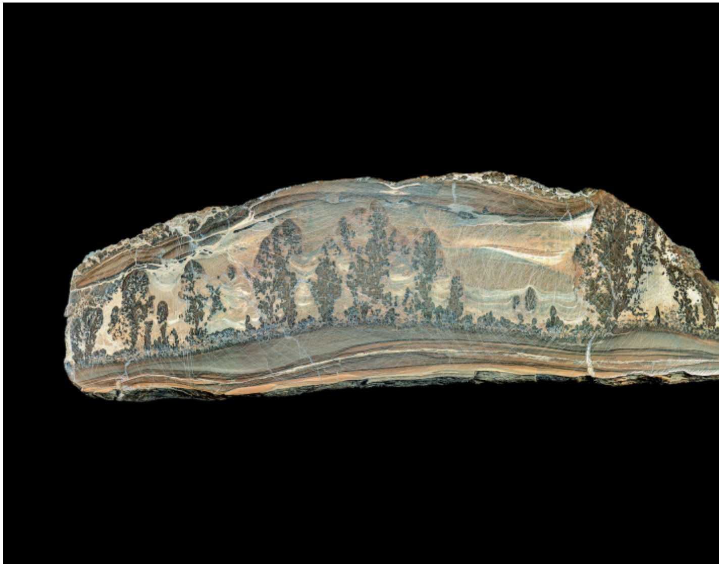
Paysage, calcare con stromatoliti (scogliere di cianobatteri fossili) di etÃ reziiana (Triassico finale, Mesozoico) Cotham (Bristol, Gran Bretagna), 28 x 8 cm, Sezione spessa, segata e levigata, Dono Ãcole Van Cleef & Arpels des Arts Joailliers, 2017 MNH, INV. Gg-2021-5125, Caillois ne aveva erroneamente annotato lâorigine a Catham.