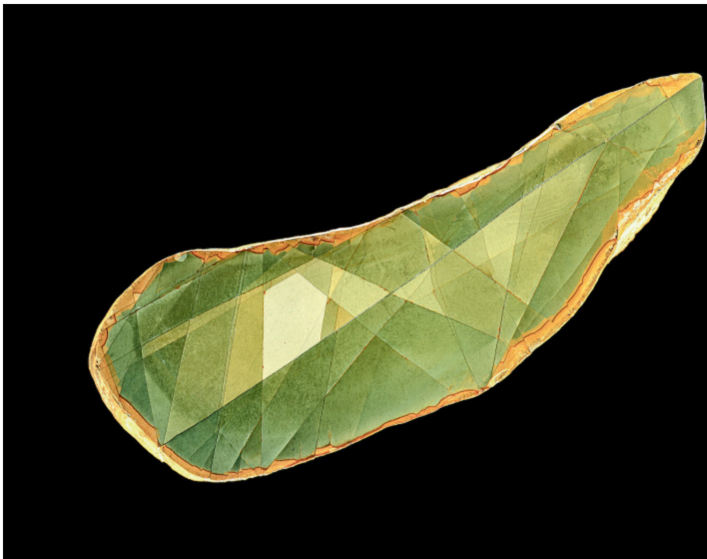
Calcare, varietà toscana detta Verde dell'Arno Alta Valle dell'Arno (Firenze, Italia) blocco segato e levigato su un lato 15,1 x 5,9 cm Donazione Caillois, 1984-1985 MNH, INV. 188.94.

Tutte le pietre della collezione Caillois presentate in questo libro sono conservate al Musée National d'Histoire Naturelle di Parigi Crediti fotografici: François Farges.