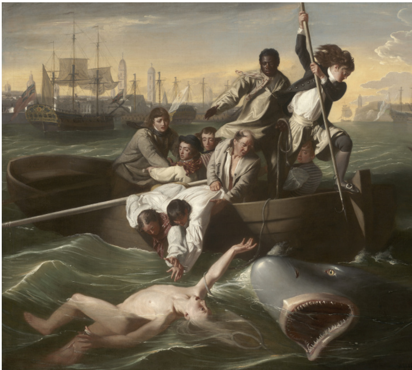
John Singleton Copley RA, Watson and the Shark , 1778. Museum of Fine Arts, Boston.

Il committente dell'opera, Brook Watson, bostoniano di origine, ma naturalizzato inglese, in gioventù era sopravvissuto all'attacco di uno squalo. L'episodio, romanticizzato dall'artista: John Copley (1838-1815, al pari di Watson, americano di origine, ma poi emigrato in Inghilterra) fece scalpore quando fu esposto all'esposizione annuale della Royal Academy del 1778. L'incidente per mare metteva in scena i pericoli della tratta atlantica, presentando al pubblico elitario dell'accademia un evento di cronaca in cui la solida presenza del marinaio di colore che tende la mano a Watson in un simbolico, drammatico gesto di sollevamento, poteva essere letto come un riferimento alla necessità di mantenere "buoni" i rapporti con le popolazioni colonizzate. Armada , 2017-2019 di Hew Locke occupa l'area centrale della sala.