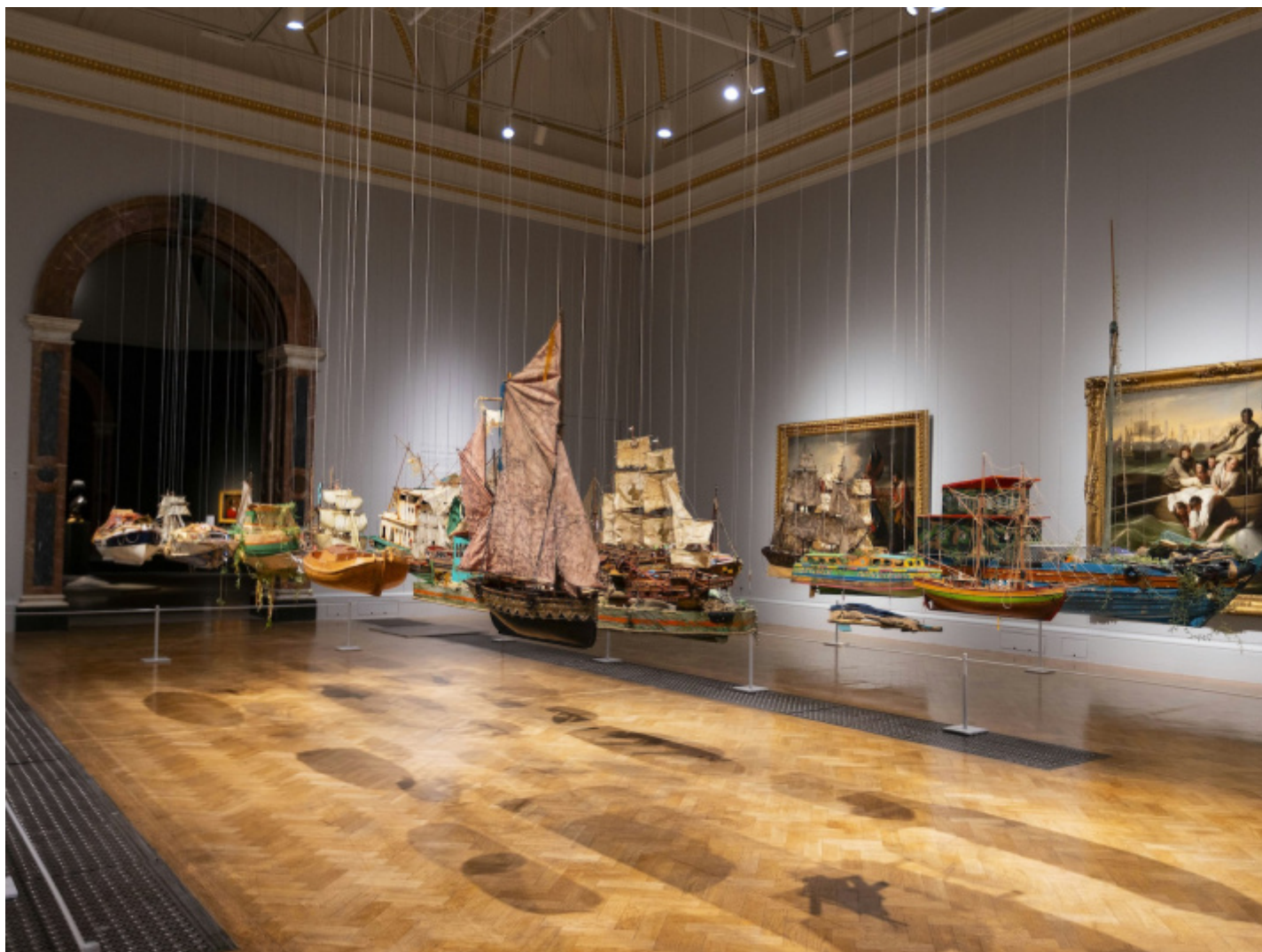
Installazione. 'Entangled Pasts, 1768–now. Art, Colonialism and Change' at the Royal Academy of Arts, London (3 February - 28 April 2024). Hew Locke RA, Armada, 2017–19, Tate. © Hew Locke. All Rights Reserved, DACS 2024

L'installazione mette insieme modelli di imbarcazioni che Locke ha collezionato per anni. Il veliero Mayflower, la nave mercantile The Bounty, navi da crociera come la Windrush e velieri dei pirati. Alcune imbarcazioni sono nuove, altre comprate, altre ancora assemblate da Locke con oggetti di scarto. "E' una collezione di fantasmi del passato e realtà di oggi che navigano insieme", spiega l'artista. Quei fantasmi imperiali padroni dei mari? Le nostre navi malandate e sovraccariche che trasportano migranti?