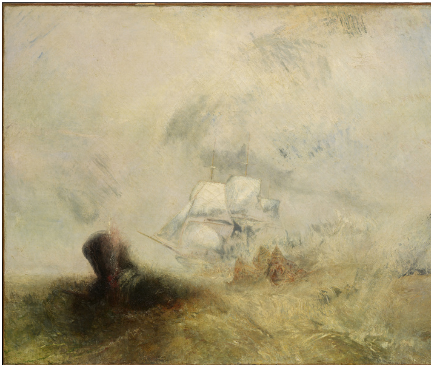
J. M. W. Turner RA, Whalers , c. 1845. In prestito da The Metropolitan Museum of Art, New York, Catharine Lorillard Wolfe Collection, Wolfe Fund

Whalers , 1845 (baleniere), è una glorificazione della spaventosa utopia acquatica e delle prodezze tecnologiche dell'Inghilterra industriale, dominatrice dei commerci sui mari. I paesaggi di Turner lasciavano perplesso il pubblico della Royal Academy, confuso dalla modernità che univa figurazione ed astrazione, dall'essenzialità del messaggio, dalla scioltezza dell'uso del colore e l'universalità di un approccio creativo al di sopra ed al di fuori del canone. Whale falls , 2017 (una balena che cade), di fronte, di Gallagher è in dialogo con Turner.