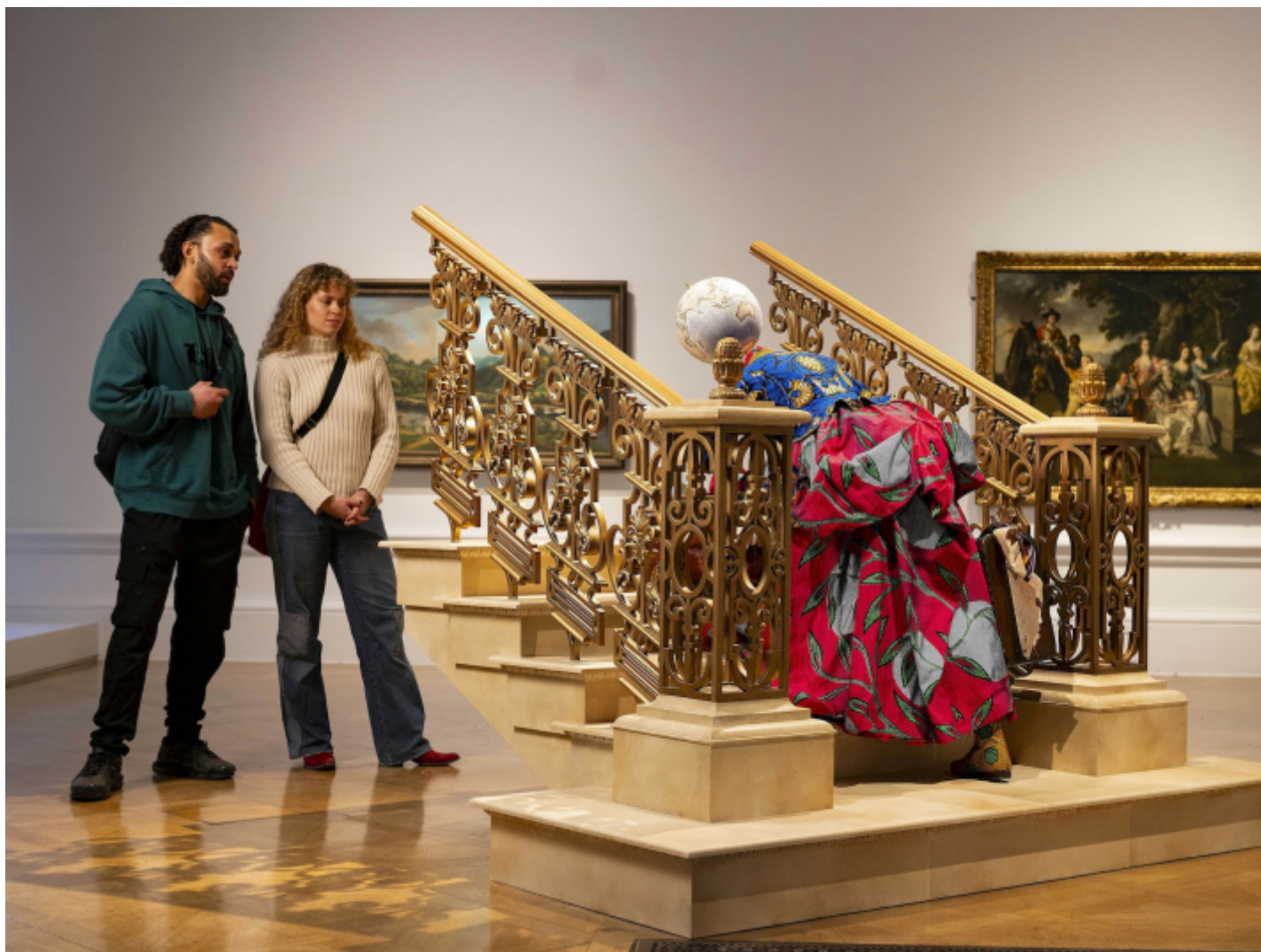
Installazione 'Entangled Pasts, 1768–now. Art, Colonialism and Change' at the Royal Academy of Arts, London (3 February - 28 April 2024), Yinka Shonibare CBE RA, Woman Moving Up , 2023, Courtesy the artist and James Cohan Gallery, New York. Photo © Royal Academy of Arts, London / David Parry. © Yinka Shonibare CBE RA

artistica delle identità ibride come la sua.