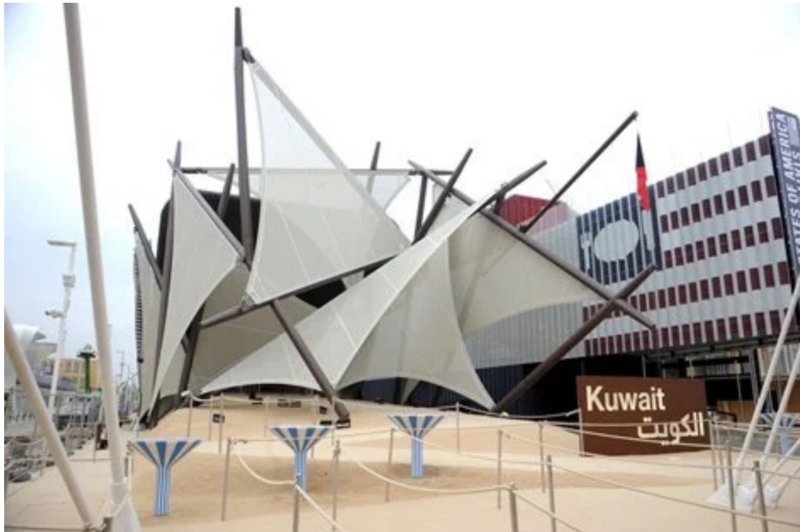
Kuwait Pavilion expo Milano 2015.

In questo contesto un po' assonnato e dominato dall'ortogonalità politica e progettuale della Casabella di Vittorio Gregotti e da una cultura politecnica legata agli insegnamenti ortodossi dei figli della Casabella-continuità di Rogers, Rota rappresenta una vera anomalia concettuale e professionale. Facilmente etichettato come architetto post-moderno ma invece autore inquieto, curioso e trasversale per attitudine e gusto, le sue occasioni d'espressione emergono da alcuni interventi solo apparentemente laterali ma capaci d'incidere sul nostro immaginario.