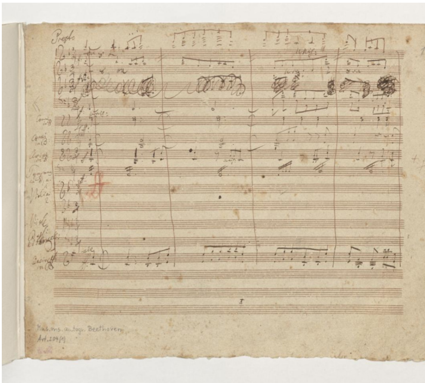
L'attacco dell'ultimo movimento della Nona nel manoscritto beethoveniano (Biblioteca di Stato di Berlino).