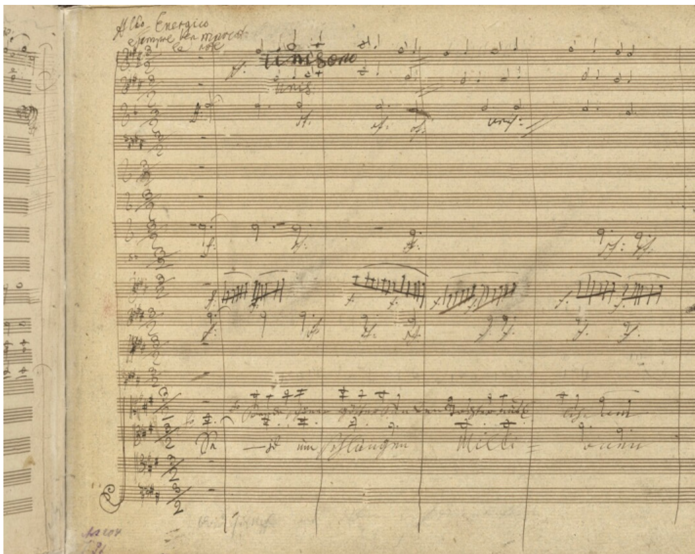
Uno dei passaggi più celebri dell'Inno alla Gioia, nel manoscritto beethoveniano: "Unitevi in un abbraccio, moltitudini" (Biblioteca di Stato di Berlino).

apparizione, si riaffacciano i temi principali dei tre movimenti precedenti, e ogni volta gli archi bassi si incaricano di contrastarne il passo, a loro volta attenuando l'impatto del loro risentito fraseggiare. Ed è proprio a violoncelli e contrabbassi che tocca introdurre il "tema della Gioia". La melodia appare dapprima quasi ai limiti dell'udibile, poi inizia a scalare le tessiture degli archi: la contemplano, si direbbe, le viole, mentre i fagotti si abbandonano a una fioritura dell'immortale motivo; se ne impadroniscono i violini, mentre le fioriture passano agli archi bassi, infine esulta nella piena orchestra, con gli ottoni che sfavillano.