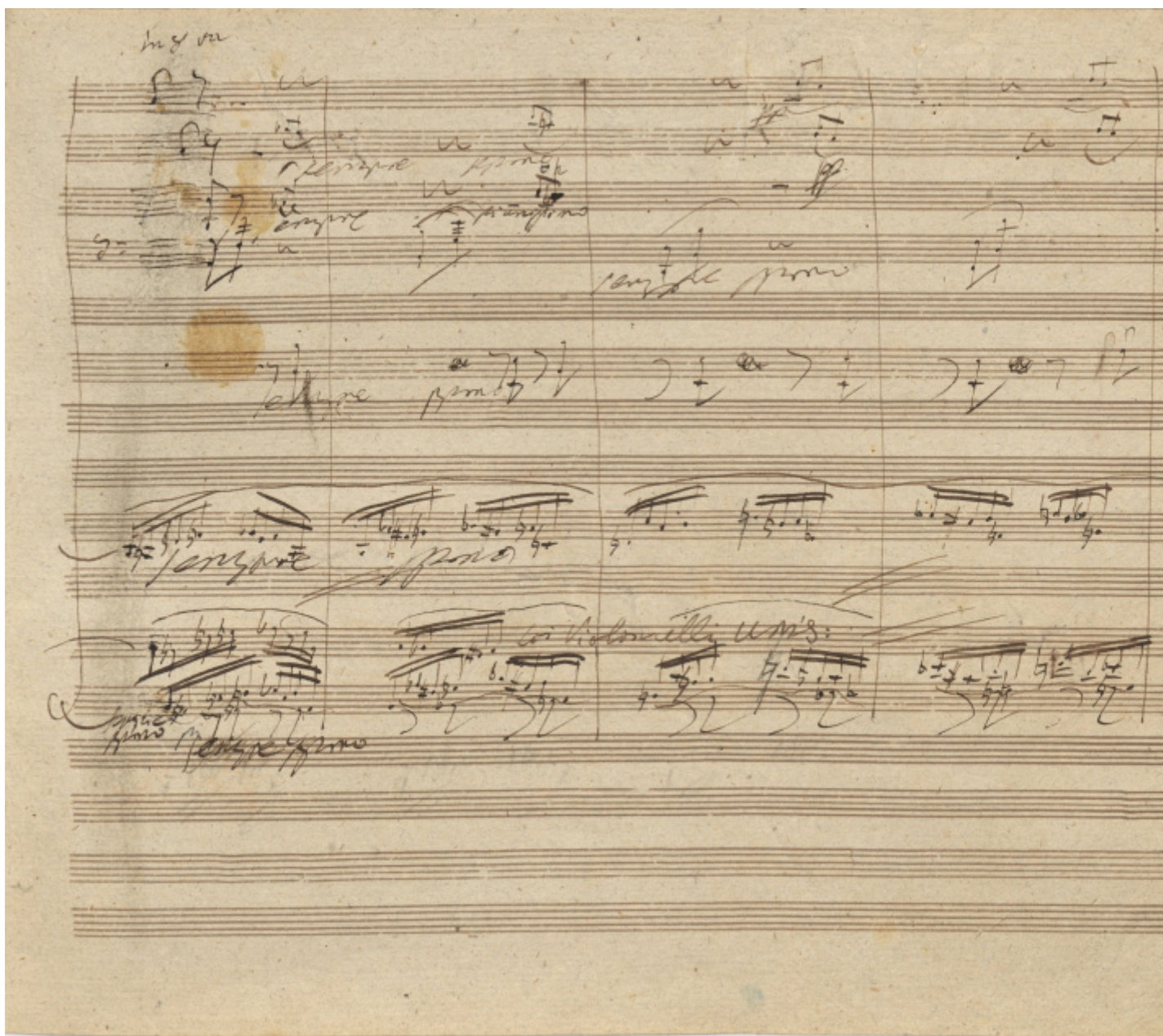
Una pagina del manoscritto della Nona, primo movimento (Biblioteca di Stato di Berlino).

La soluzione alla necessit  di evitare una cesura troppo netta fra la grande parte solo strumentale che precede e quella corale fu risolta sempre nell'ambito della forma variata che   il perno intorno al quale si muove tutta la Sinfonia con un'ampia introduzione orchestrale. Ancora, come mediazione rispetto ai contenuti letterari schilleriani, Beethoven decise, dopo molte incertezze, di affidare al baritono una sorta di breve Prologo ( «O Freunde, nicht diese T ne!»:  «Amici, bando a queste note! Ne intoneremo di pi  dolci, tutti assieme, e di pi  gioiose»). Una contraddizione abbastanza singolare, visto che poco prima il tema della Gioia   gi  stato declamato a tutta orchestra, anche se subito seguito dalla ripetizione dell'angoscioso attacco dell'ultimo movimento.