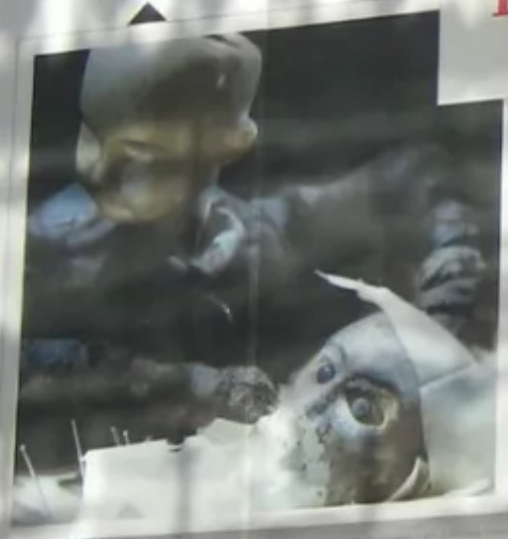
QUAY BROTHERS On Deciphering the Pharmacist's Prescription for Lip-Reading Puppets OPENS AUG 12