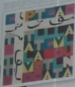
ALIGHIERO BOETTI Game Plan NOW ON VIEW

ECSTATIC ALPHABETS/ HEAPS OF LANGUAGE THROUGH AUG 27