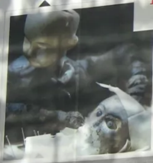
CENTURY OF THE CHILD Growing by Design 1900-2000 OPENS JUL 29