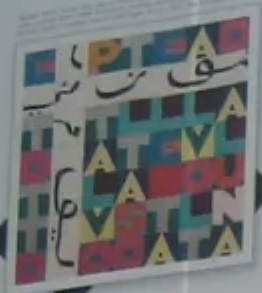
ALIGHIERO BOETTI Game Plan NOW ON VIEW