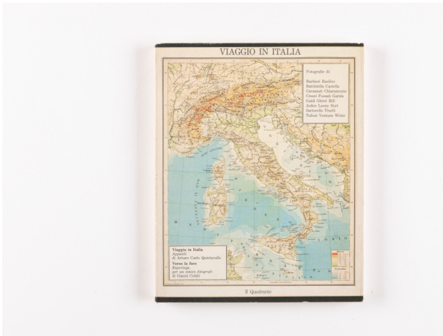
Copertina di Viaggio in Italia , ed. Il Quadrante, ©Finarte.

I profili dei sette fotografi proposti da Benigni condividono una struttura simile: raccontano come è avvenuto l'incontro con Ghirri, espongono la poetica del singolo autore e il suo contributo al progetto per poi mettere in luce il ruolo di Viaggio in Italia nella sua ricerca successiva, quanto egli abbia proseguito secondo quell'impostazione o quanto se ne sia discostato, ovvero come i temi di quella stagione siano stati elaborati con l'evolvere del personale percorso artistico. Così, ad esempio, seguiamo Olivo Barbieri dagli esordi tra anni Settanta e Ottanta, quando ritrae scene di provincia riscoperte nei suoi rimossi contrappunti di mistero e quotidianità, e si rivolge al non-visto, al non-guardato, a ciò che lo circonda e a cui nessuno presta troppa attenzione, alle sue immagini in Viaggio in Italia , di cui si mette bene in luce una precisa impronta autoriale che mette in causa l'apparizione, il salto di scala, rilanciando la dinamica dell'osservazione, prefigurando quello che sarà poi il lavoro posteriore del fotografo, per il quale, dice Benigni, il paesaggio diviene il pretesto per indagare l'atto del vedere, il rapporto tra apparenza e illusione, vero e rappresentazione del vero.