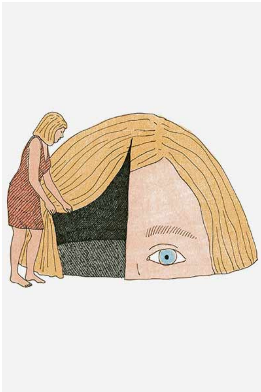
Opera di Marion Fayolle.

L'empatia non è una competenza ereditata, ma in parte appresa, non dobbiamo dimenticarci del ruolo importante che può giocare la lettura nel suo sviluppo. Anche la scrittura – in particolare la scrittura in corsivo – è un potente strumento di stimolazione cerebrale, perché crea un concerto tra aree del cervello che non si ottiene con la scrittura digitale. Pensate a quanti ragazzi oggi scrivono in stampatello, o quando per aiutare chi ha problemi nell'apprendimento li consegniamo a una scrittura solo sul computer, o a quando si dice che è inutile insegnare a scrivere in corsivo. Non dimentichiamoci che le mani hanno una grossa rappresentazione nel cervello, e che l'uomo è Homo Faber perché usa le mani.