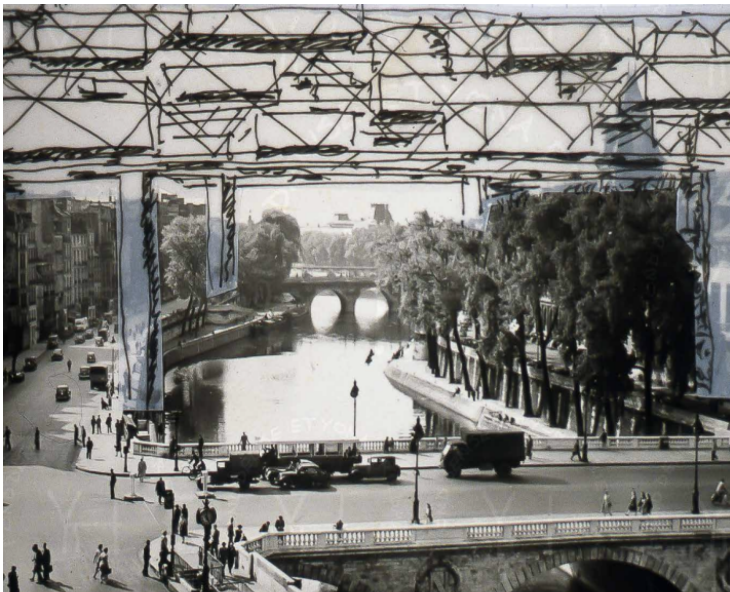
Paris spatial, dessins et photomontage, Fond Denise et Yona Friedman.

un'idea micro di aggregazione sociale, ben distinta dalla città e dalla metropoli. Oggi si potrebbe dire che i paesi possono assumere quella dimensione fisica a cui si riferisce Friedman, dove l'unione di pochi rinsalda prima di ogni altra cosa i legami sociali. È questo a cui tende il manifesto politico che lui propone, un ribaltamento del punto di vista e dell'azione dell'abitante autonomo, without architects .