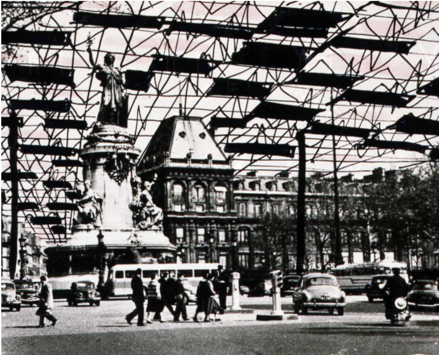
Paris spatial, dessins et photomontage, Fond Denise et Yona Friedman.

Sono domande legittime a cui Friedman tenta delle risposte che hanno certamente un fondamento ma tuttavia appaiono nel solco della non realizzabilità nel momento che presuppongono un contesto sociale e politico molto diverso. La disciplina dell'architettura stava subendo, fino dagli anni cinquanta, una crisi di identità che viene dopo la fine del movimento moderno e il rapido sviluppo globale dell'International Style. Negli anni della contestazione sessantottina la controultura e le neo-avanguardie architettoniche radicali determinano un ulteriore allontanamento dalla tradizione dell'architetto-demiurgo. È pur vero che alla fine degli anni sessanta quando il libro di Friedman esce per la prima volta, i temi della partecipazione erano al centro del dibattito iniziato nel 1968, in cui si rivoluziona il linguaggio, dall'arte alla letteratura (Gruppo 63) per proseguire nel decennio successivo fino all'avvento del Postmodern, nella prima Biennale di Architettura a Venezia diretta da Paolo Portoghesi.