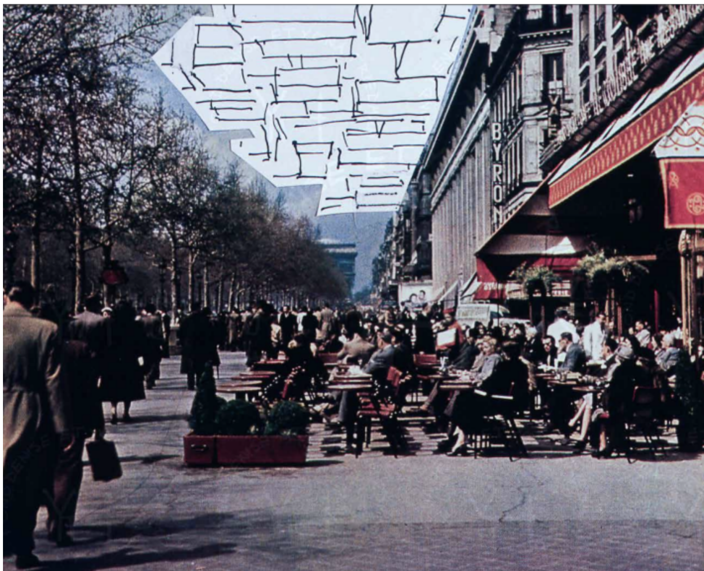
Paris spatial, dessins et photomontage.