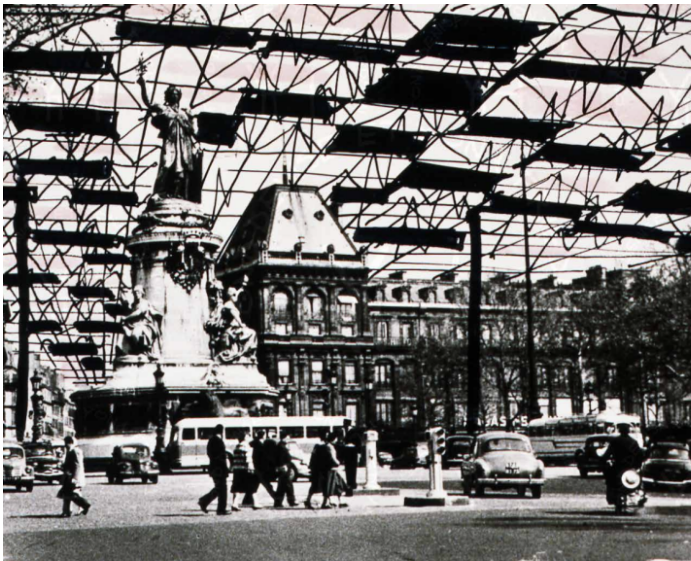
Paris spatial, dessins et photomontage, Fond Denise et Yona Friedman.

In Italia uno degli artefici della partecipazione è l'architetto Giancarlo De Carlo che la adotta nel 1966 quando elabora il Piano Regolatore di Urbino, nel 1969 per il Piano particolareggiato di Rimini e infine per il Villaggio Matteotti a Terni nei primi anni settanta, in cui l'architetto genovese ascolta e interpreta i desideri degli abitanti per trasformarli in architettura. Diversamente Friedman propone che l'abitante sia il fautore dell'oggetto architettonico senza l'aiuto dell'architetto. Infatti la storia dell'abitare ci ha tramandato nei secoli case che sono state costruite dai loro abitanti per soddisfare i loro bisogni. Questo avviene soprattutto nei contesti poveri come quelli della cosiddetta architettura informale sia in Europa sia in Latinoamerica, archetipi da cui si sono nutriti generazioni di architetti. Nel 1964 Bernard Rudofsky cura la mostra al MoMA Architecture without Architects An introduction to a Non-Pedigreed Architecture , in cui analizza proprio le architetture senza autore. Architetture nate dalla creatività dei loro abitanti per necessità, dalle costruzioni cinesi alle case mediterranee, dalle architetture nomadi del deserto sahariano alle architetture vernacolari italiane. Friedman fin dai suoi primi disegni dell' Architecture Mobile agisce con strutture modulari e reticolari, evoluzione delle tende dei nomadi del deserto, così anche il lavoro di Rudofsky non deve essergli stato estraneo, troppe le affinità.