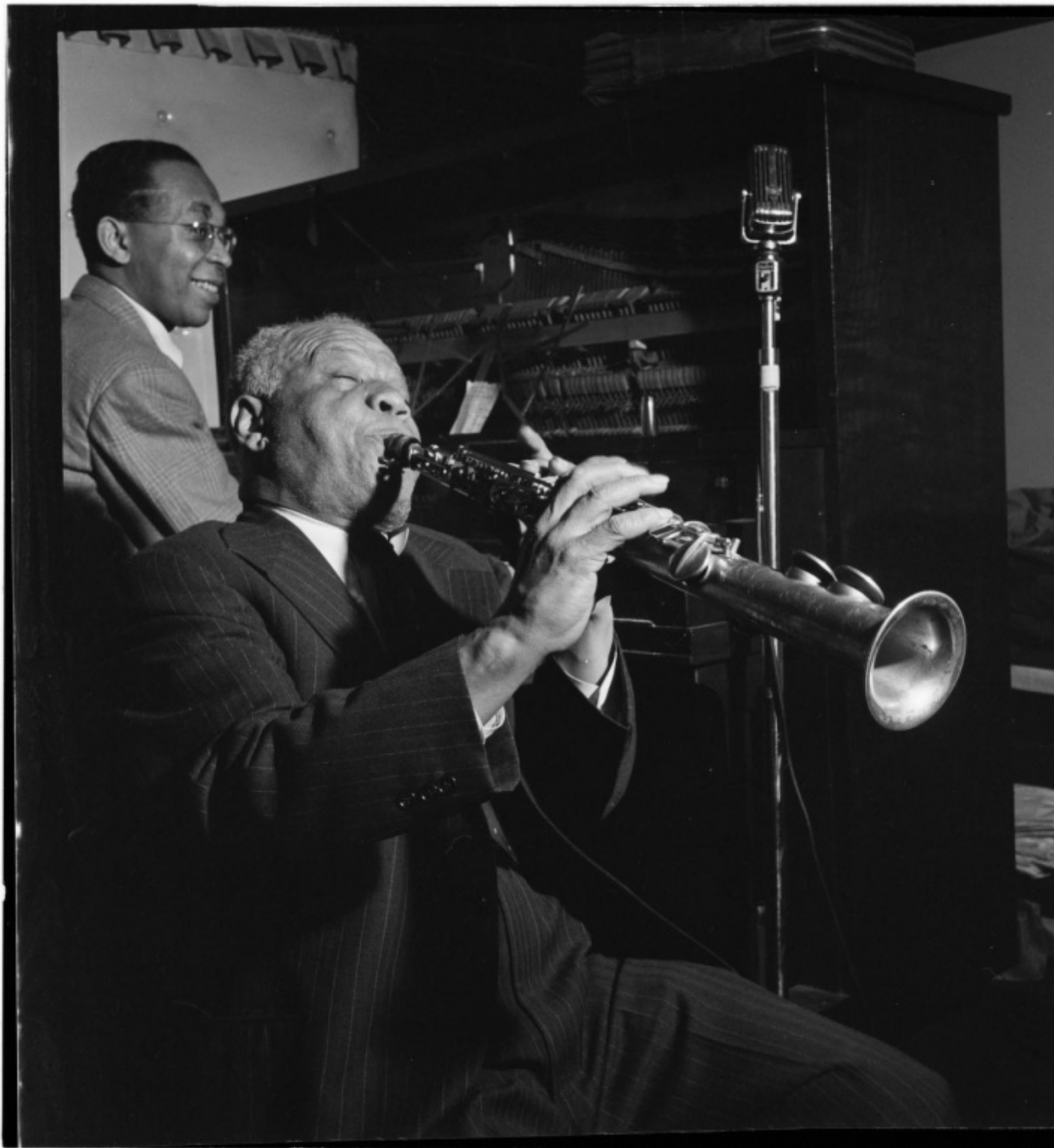
William P. Gottlieb: Ira and Leonore S. Gershwin Fund Collection, Music Division, Library of Congress.

Raggiungendo Parigi, Sidney Bechet si era riempito di gioia anche solo per il fatto di essersi finalmente riavvicinato all'“Africa, cioÃ” alla sua origine; al luogo da cui provengono tutte le diverse espressioni musicali che siamo soliti ricondurre al complesso ma composito mondo del jazz. Al luogo di cui Bechet sentiva di dover tenere in qualche modo viva la memoria: lâ”origine. Quella da cui tutto quello che siamo e che facciamo, di fatto, dipende.