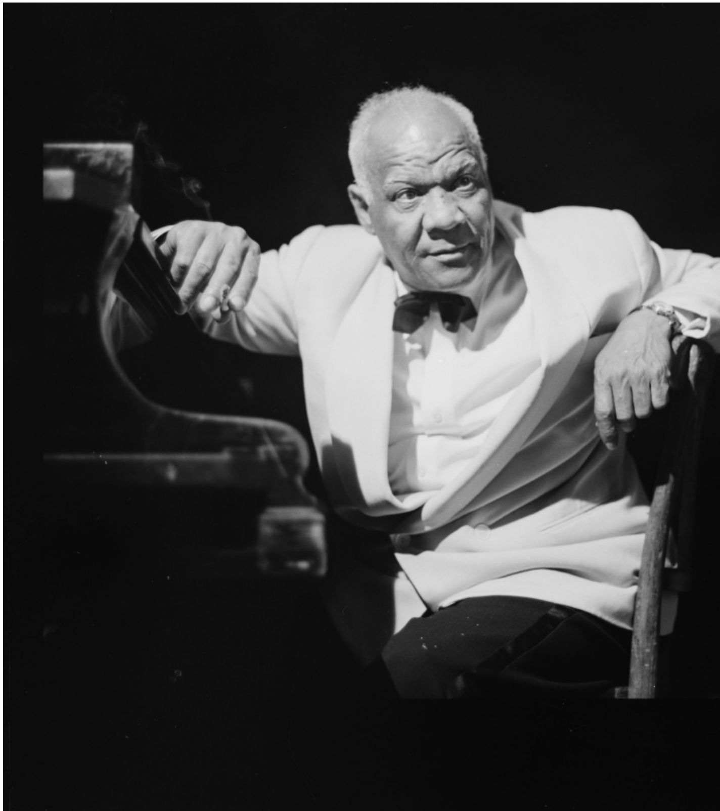
Sidney Bechet

D'altronde, gli schiavi non avevano altro: l'unica cosa che avevano, l'unica cosa di cui nessuno poteva privarli, era la loro musica. Il loro canto saliva dai campi, passava per i loro piedi e si sviluppava fin nel loro stomaco, nel loro spirito, nella loro paura, nella loro nostalgia. Una musica che a Sidney Bechet doveva regalare momenti indimenticabili e la sensazione che tutto il resto fosse davvero racchiuso nelle note prodotte dal suo strumento; nel vibrato con cui metteva in scena le proprie speranze e le proprie paure. La musica, d'altro canto, gli aveva regalato anche degli incontri straordinari; come quelli cui ho dedicato un intero paragrafo di questo volume, in cui si narra dell'incontro con il Duca e di quello con Bessie Smith. Duke Ellington, un musicista vero, che aveva il feeling giusto, e lasciava che la musica venisse