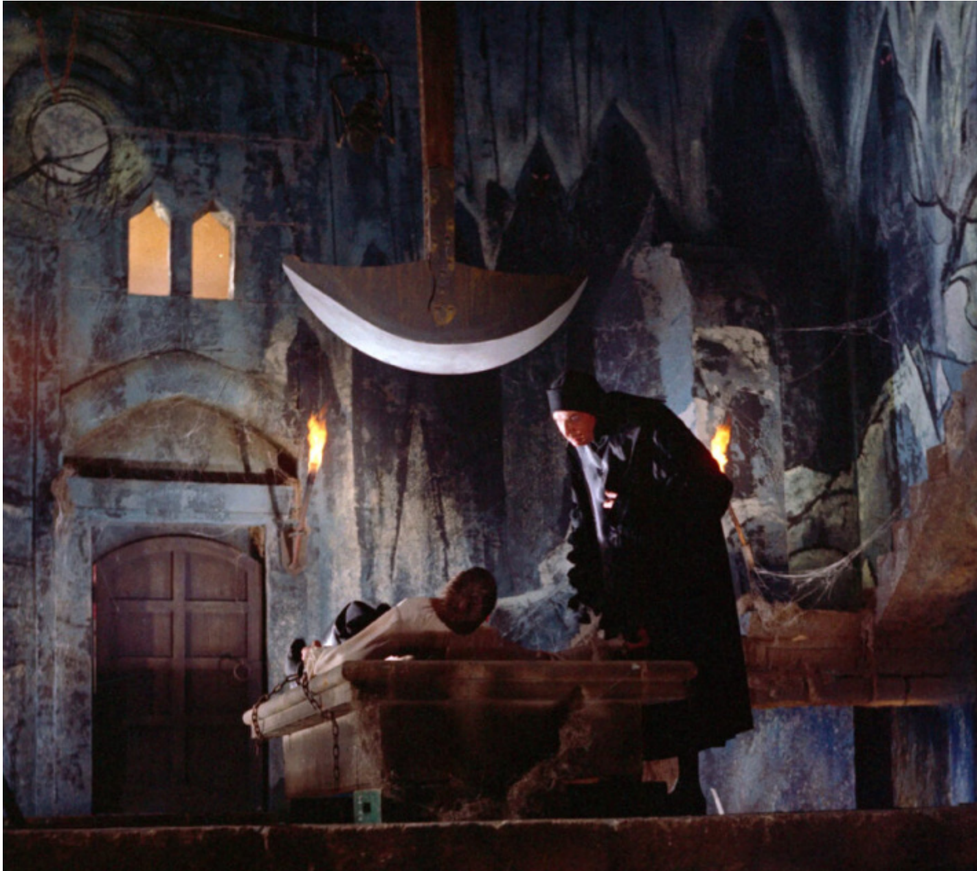
Il pozzo e il pendolo

Attraverso lâ??opera di Poe, Corman ricorre alla sua abilitÃ prodigiosa nel comporre raffigurazioni demoniache e deliranti attraverso simbolismi esibiti. Ã? una strana dialettica la sua, solo D.W. Griffith era riuscito a coglierla a pieno fino a quel momento: lo scrittore americano si ingegna sempre a cercare di offrire motivazioni razionali e critiche al terrore, cercando di rendere accettabile ogni spaventosa illusione (pensiamo ad esempio a Il barile di Amontillado ). Corman prova a restituire allo spettatore questa struttura razionale del racconto aggiungendo in ogni sequenza un trucco diverso: una vera e propria â??discesa nel MaelstrÃ¶mâ?• ricchissima di filtri, gel colorati, inquadrature opache oppure sovrapposte, draghi, uccelli, maschere rosso sangue, soffitti che crollano, bare, fuochi, catastrofiâ? e cadaveri, molti cadaveri. Poi, improvvisamente, tutto scompare, gli artifici lasciano spazio a una dialettica iperrealista, a una messa in scena della morte in technicolor: la stessa del Barone Rosso , girato qualche anno piÃ¹ tardi.