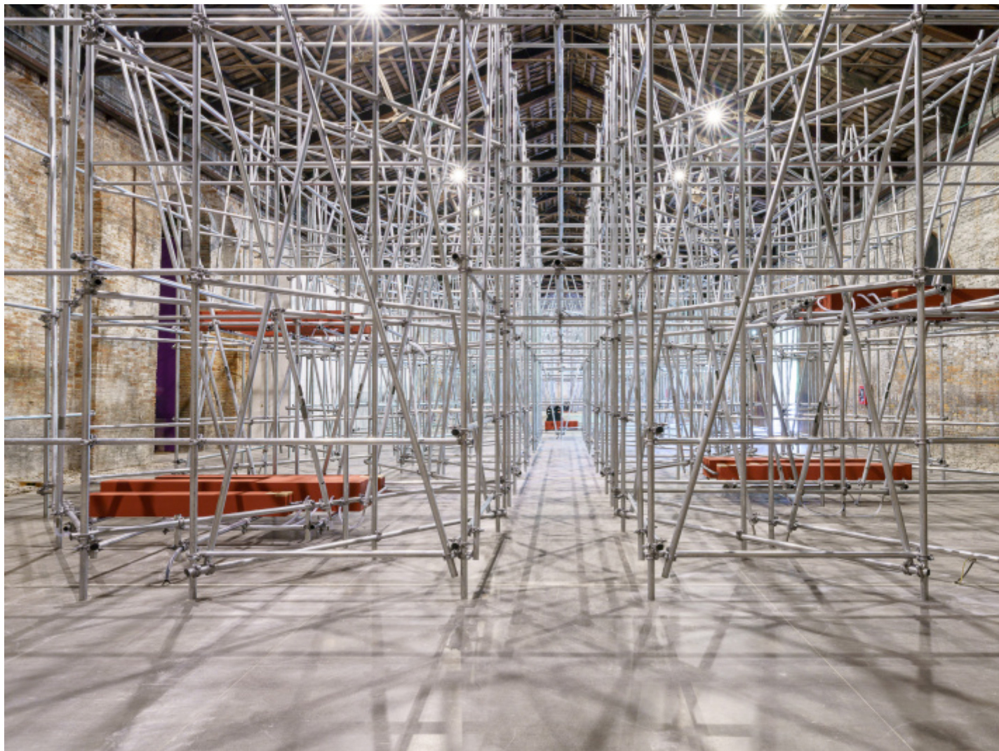
Due qui To Hear, Padiglione Italia, Biennale Arte 2024 © Andrea Avezzi, Courtesy: La Biennale di Venezia.

In quest’area si può anche ascoltare “integralmente” il pezzo dei due organi che si parlano da un estremo all’altro. Il centro, infatti raccoglie le due voci, cosa impossibile da fare quando ci si sposta all’interno del lavoro dove la vicinanza ad un estremo o all’altro di fatto parzializza l’ascolto.