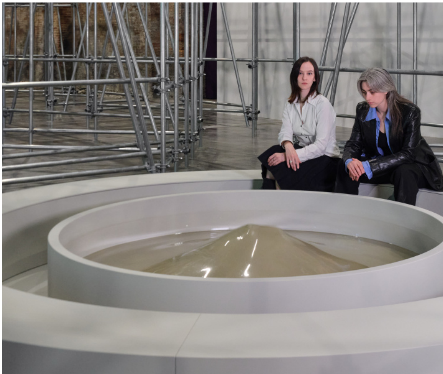
Due qui To Hear, Padiglione Italia, Biennale Arte 2024