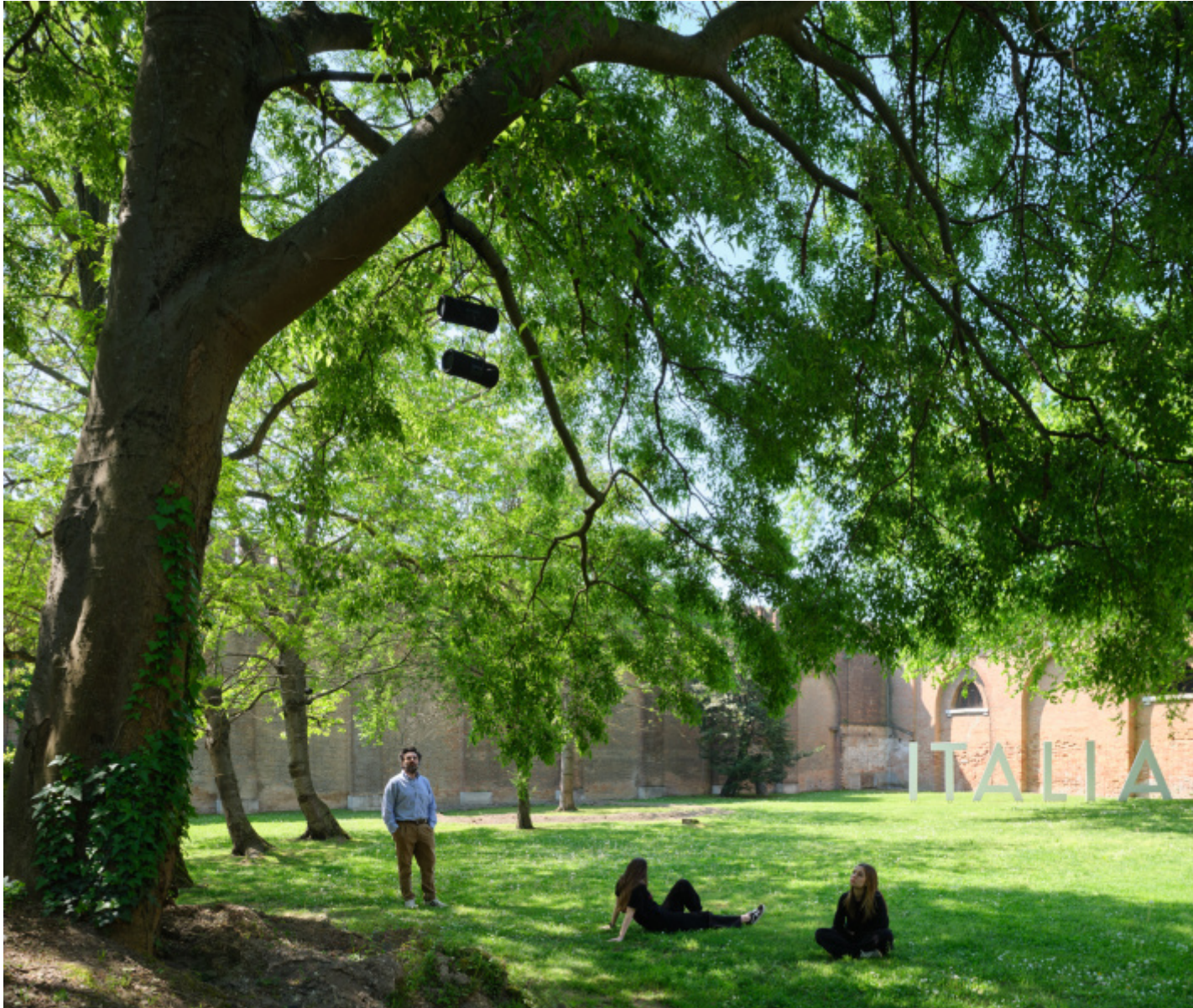
Due qui To Hear, Padiglione Italia, Biennale Arte 2024.

tre gruppi di due Boombox ciascuno. Questi sono appesi ai rami degli stessi alberi, un po' come le scarpe che avvolte vedi appese alle linee elettriche in città.