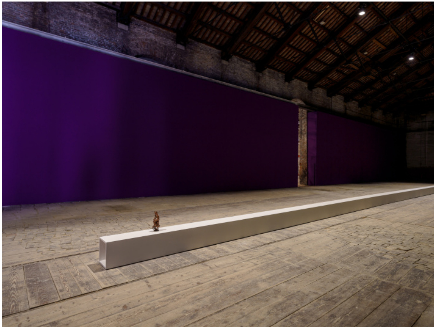
Due qui To Hear, Padiglione Italia, Biennale Arte 2024

Ecco, questo atteggiamento guida sia me sia Luca Cerizza, che ha lavorato spesso con questa attitudine nei suoi progetti curatoriali. Cos'è questo Padiglione è uno spazio per me veramente bellissimo ci ha come istigato ad assumere anche il giardino, nella composizione generale degli spazi espositivi con le rispettive opere: un esterno rinchiuso da suono ( A veces no puedo moverme ), un interno che isola ( Bodhisattva che pensa su La Bemolle ) ed uno spazio di esterno-interno come un bosco di passaggio ( Due qui ).