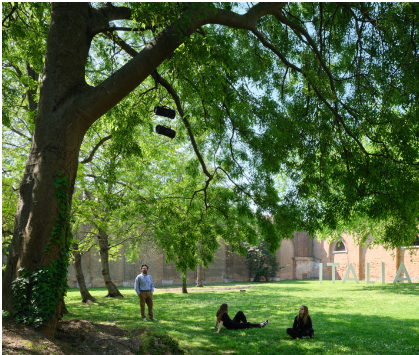
Due qui To Hear, Padiglione Italia, Biennale Arte 2024 © Agostino Osio AltoPiano.

tre gruppi di due Boombox ciascuno. Questi sono appesi ai rami degli stessi alberi, un po' come le scarpe che avvolte vedi appese alle linee elettriche in città.