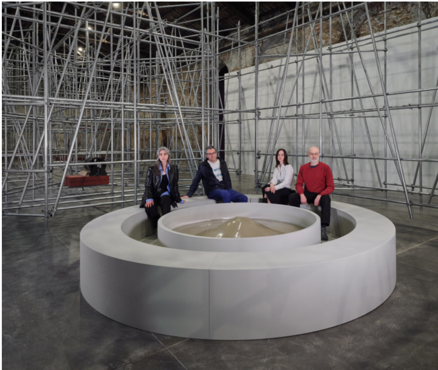
Due qui To Hear, Padiglione Italia, Biennale Arte 2024.

M. B. La caratteristica di questo progetto, e in generale di tutto il mio lavoro, è che non c'è rappresentazione: è un lavoro di pura presenza. Sì, c'è anche disegno, ma è difficile far essere presente un disegno. È un lavoro che necessita vera maestria. Mi riesce più facile rendere presente corpi. Tutte le cose che sono qui sono fatte di corpo. E succedono esattamente nel momento in cui tu le vedi. Non c'è differenza di distanza ermeneutica tra te e questo lavoro: ci sei accanto, dentro.