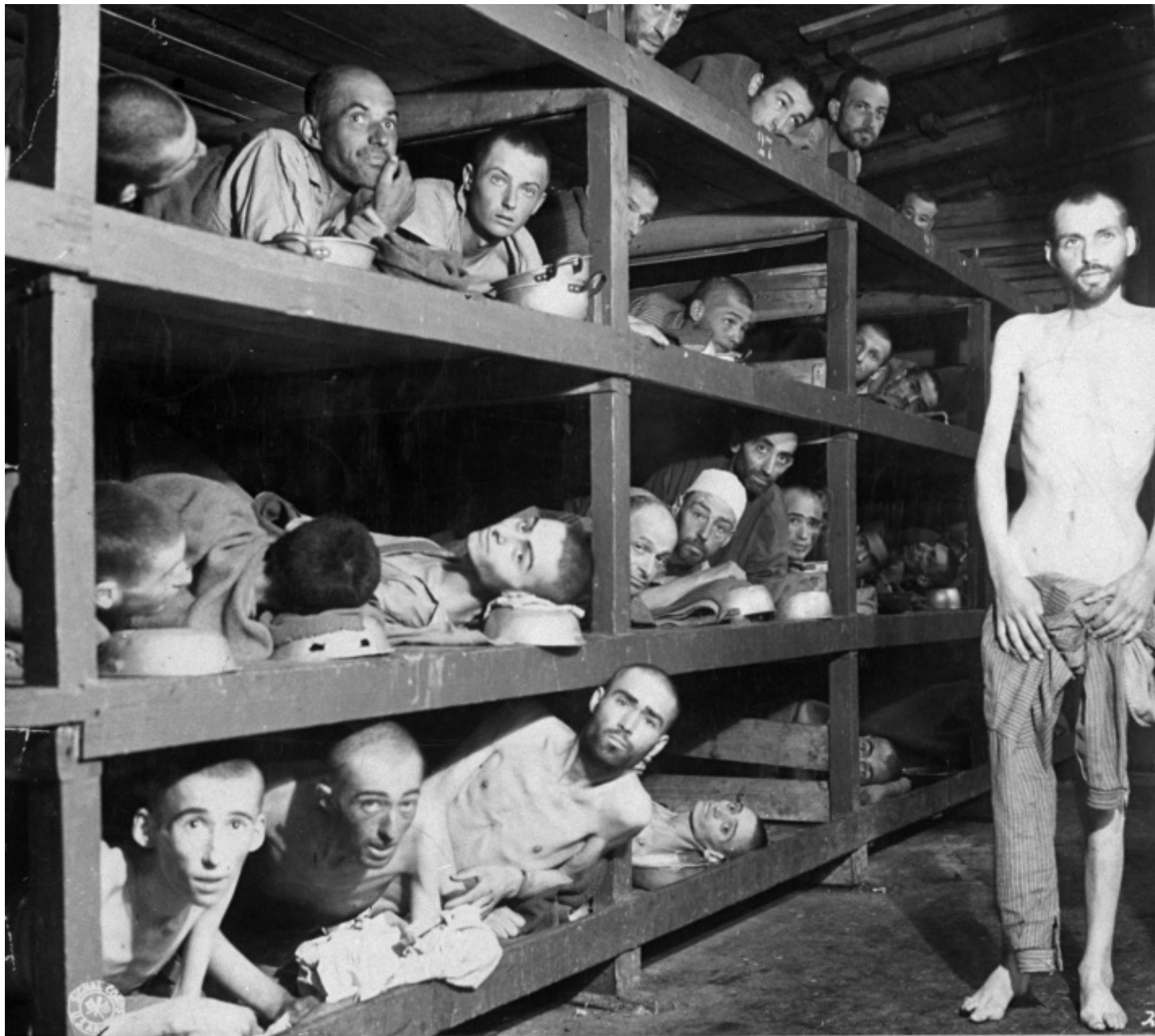
Margaret Bourke-White, Lavoratori schiavi semi-affamati, sdraiati in cuccette di legno, tra cui il futuro cacciatore di nazisti Elie Wiesel (seconda fila, settimo da sinistra), guardano stupiti i loro liberatori, le truppe statunitensi della 80a Divisione entrano nelle loro baracche, nel campo di concentramento di Buchenwald Weimar, Germania, 1945

Con un gusto formale per le inquadrature miracolosamente in anticipo sul suo tempo, Margaret Bourke-White era bravissima, tra le altre cose, a miniaturizzare l'umano per farlo inglobare dal mondo che gli è attorno, quello che in quel momento lo confina dentro un contesto preciso, a volte schiacciandolo in un angolo. Si presenta così il soldato dentro il suo aereo da combattimento, così l'operaio che stringe i bulloni sulla diga di Dnepr, totalmente avvolti come sono nel loro universo e destino.