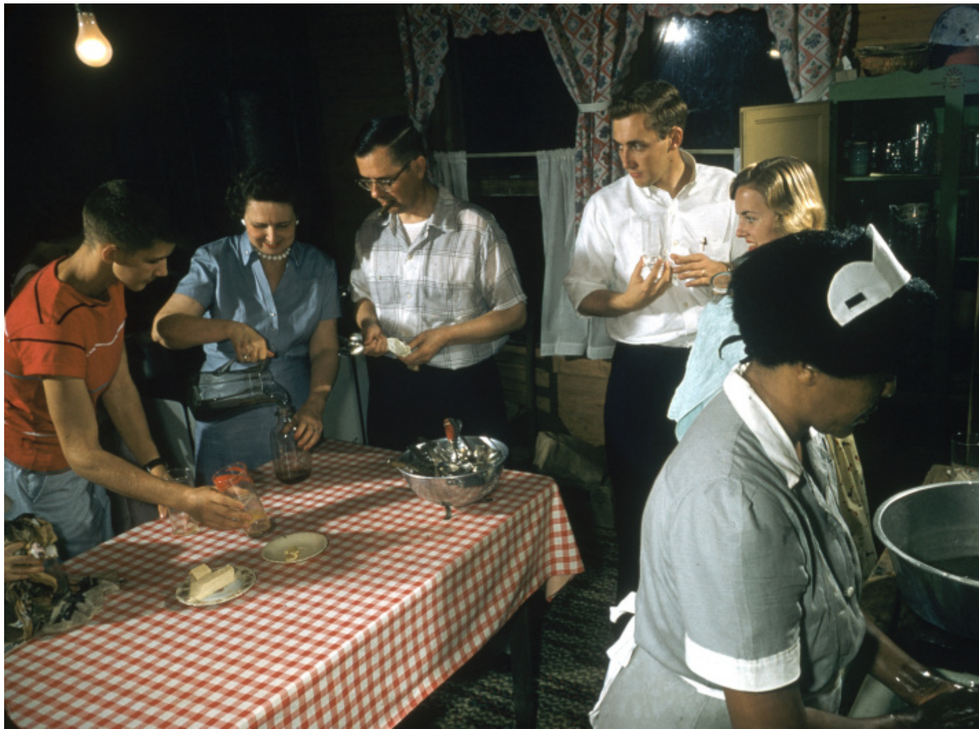
Margaret Bourke-White, In cucina, una donna versa bevande da una brocca di vetro per i membri della sua famiglia mentre una cameriera lava i piatti, Greenville, Carolina del Sud, 1956