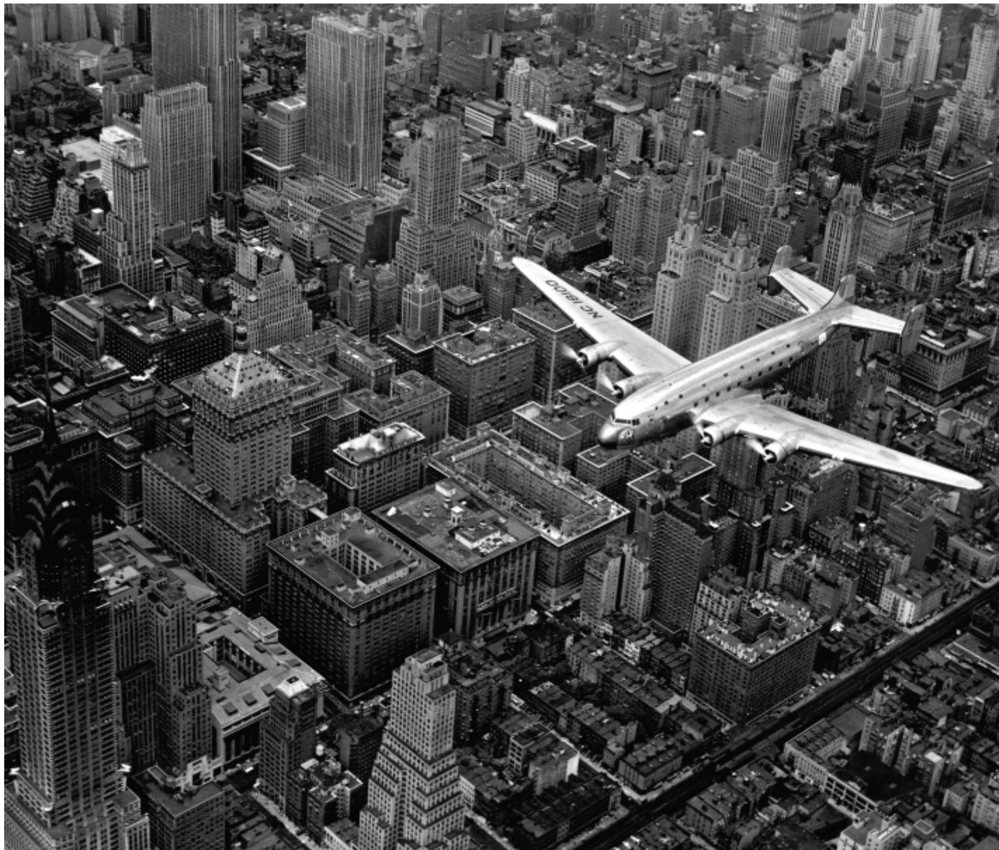
Margaret Bourke-White, Veduta aerea di un aereo passeggeri DC-4 in volo su Midtown Manhattan, New York City, 1939, Margaret Bourke-White/The LIFE Picture Collection/Shutterstock.

Nella sua lunga carriera, bruscamente interrotta negli anni Cinquanta a causa dell'insorgere del morbo di Parkinson, Bourke-White è stata portavoce degli accadimenti più significativi del suo tempo: dai primi attacchi bellici tedeschi contro l'Unione Sovietica, alla liberazione del campo di concentramento di Buchenwald, dalle insurrezioni contro l'apartheid in Sudafrica ai funerali di Mahatma Gandhi, nel 1948. Come fu, anche, ritrattista enfatica e a volte profondamente critica del proprio Paese, dilaniato da divari sociali ed economici. L'ossimoro sostanziale di cui è pervaso l'organismo statunitense è sotto gli occhi di tutti, d'altronde: sotto un cartello che dichiara che l'America possiede "Lo standard di vita più alto del mondo" ("World's Highest Standard of Living") una fila di afroamericani sfollati a causa delle alluvioni aspetta viveri e vestiti in un'immagine del 1937. Un parallelismo diretto, questo, con quanto si è visto di recente nelle sale di Camera a proposito del lavoro di Dorothea Lange, là dove i lavoratori costretti a migrare in California a causa della Dust Bowl si vedevano sormontati dalle pubblicità sulla comodità del viaggio su rotaie: "Next time try the train!" (La prossima volta prova il treno!).