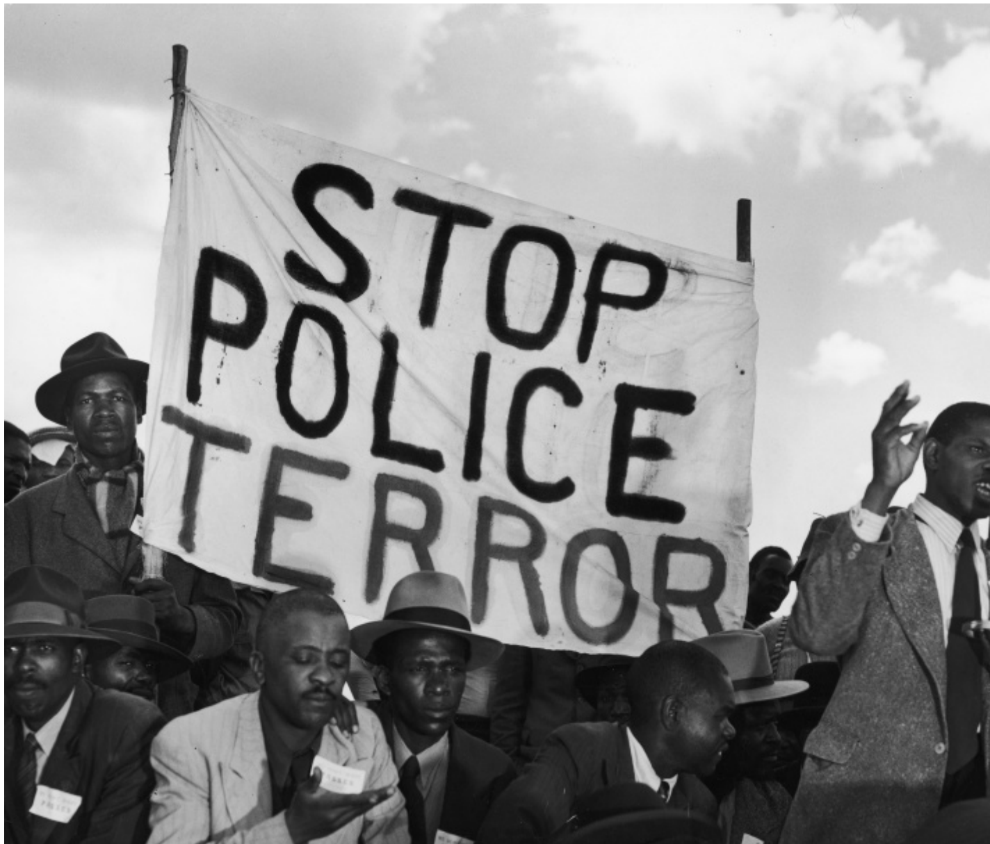
Margaret Bourke-White, Striscione sudafricano "Stop al terrore della polizia" durante un discorso nell'ambito della seconda riunione comunista, 1950, Margaret Bourke-White/The LIFE Picture Collection/Shutterstock.

La grande mostra che celebra la fotografa, Margaret Bourke-White. L'opera 1930-1960 , è curata da Monica Poggi e conta più di 150 immagini, arricchendo il percorso già ben tracciato da Camera legato alla storia delle reporter più importanti della storia della fotografia (ricordiamo le passate su Eve Arnold, Dorothea Lange, Gerda Taro).