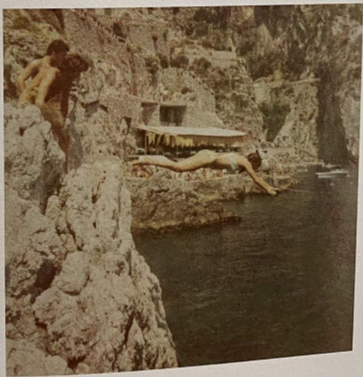
Con amici alla Praia, Costiera Amalfitana.