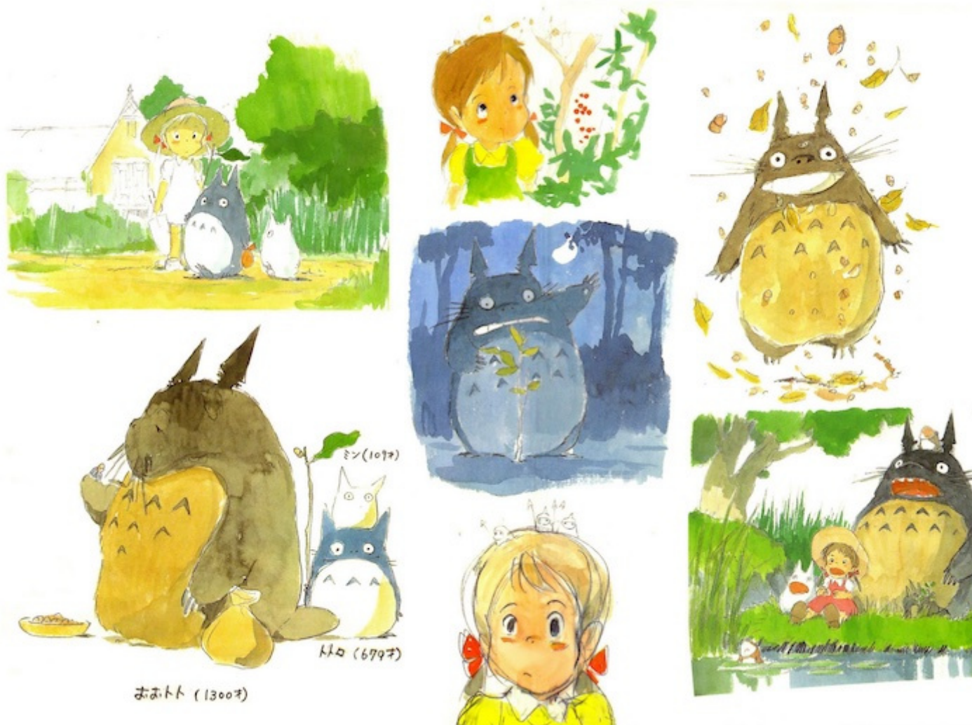
Disegni preparatori per un progetto di libro illustrato, dal volume Hayao Miyazaki Image Board (1983).

«Il Totoro che disegnavano gli altri non era mai somigliante» ricorda il regista, in quanto «tutti lo disegnavano con un'espressione come se stesse guardando qualcosa». Al contrario, lo sguardo di Totoro non è rivolto a nulla in particolare perché abbraccia ogni cosa, il che rende la sua presenza misteriosa e vagamente ieratica, sempre rassicurante, mai minacciosa. E anche nel suo sorriso, poi accentuato nella geniale invenzione del Gattobus, più che il ghigno arguto del Chesire Cat carrolliano rivive il riso bonario e semplice caro al folklore giapponese, il sorriso degli sciocchi, dei monaci e degli dei.