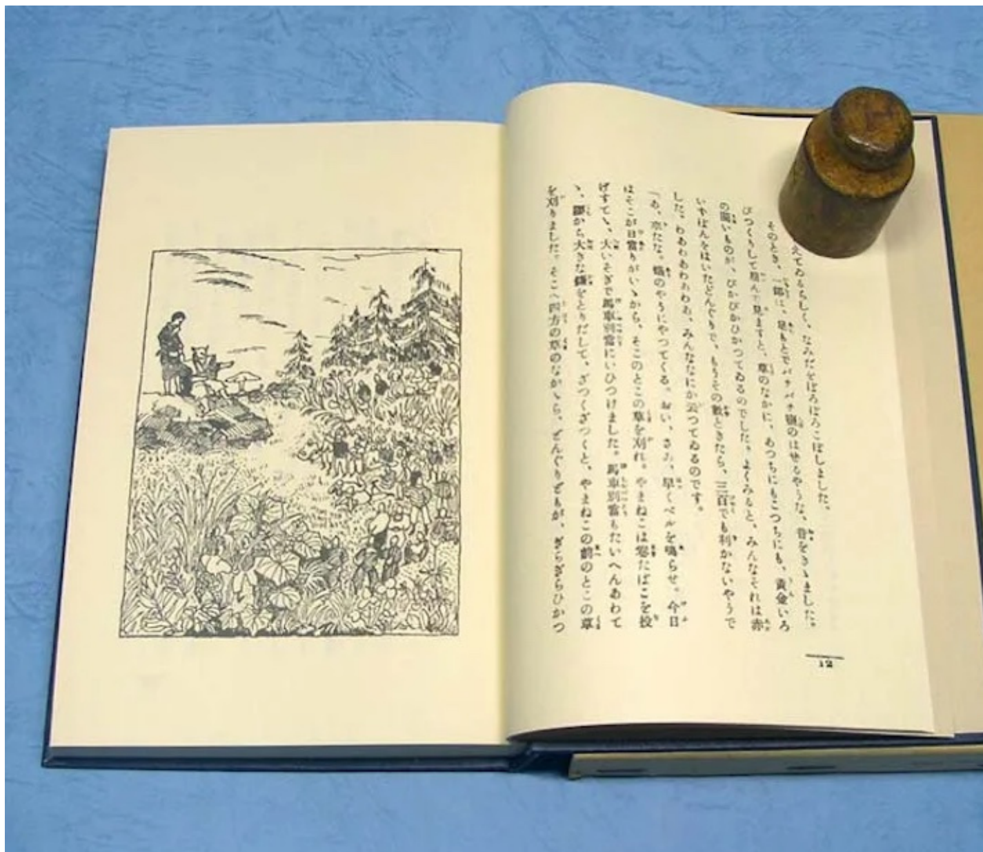
Una pagina di Le ghiande e il gatto selvatico , primo racconto della raccolta di Miyazawa Kenji ChÅ«mon no Å•i ryÅ•riten (â??Un ristorante pieno di richiesteâ?•, 1924), illustrata da Kikuchi Takeo.

Il Gatto Selvatico che in questa scena surreale fa da giudice per la disputa delle ghiande parrebbe uscito dalla penna di Lewis Carroll, piÃ¹ che dalla moderna letteratura per lâ??infanzia giapponese di inizio â??900, ma quando si siede trionfante davanti al bambino, questâ??ultimo Å«non potÃ© fare a meno di pensare che sembrava proprio unâ??immagine del Grande Buddha di NaraÅ», un altro dettaglio che col tempo deve essersi sedimentato nella coscienza di Hayao. Anche nello sguardo assorto e nellâ??aria imperturbabile di Totoro, in effetti, Miyazaki riconobbe un aspetto fondamentale della sua caratterizzazione, fin dal momento in cui, attorno alla metÃ degli anni â??70, cominciÃ² a elaborare dei disegni per un progetto di libro illustrato che sarebbe poi confluito nel film.