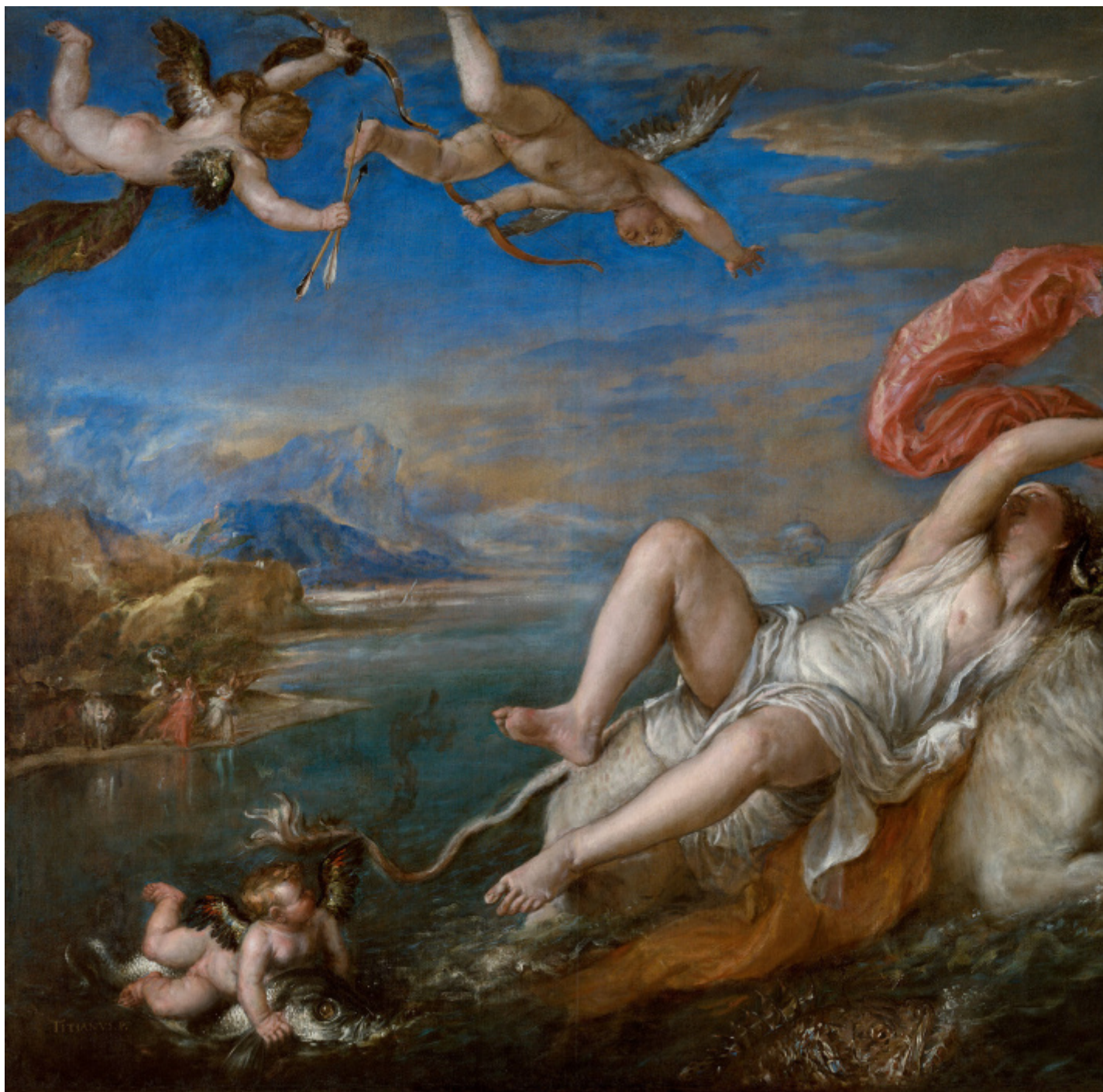
Tiziano, Il ratto di Europa, Isabella Stewart Gardner Museum.

Anzitutto, farei una distinzione tra Europa ed Unione Europea; lâ??Unione Europea Ã?? un progetto geopolitico escogitato, inventato, sperato nel momento pi??1 drammatico, ovvero nel fallimento storico dellâ??Europa, quando cio?? lâ??Europa si Ã?? autoesclusa dalla storia. Una guerra civile europea, se vogliamo, inizia con la guerra franco-prussiana del 1870 e termina con lâ??occupazione di Berlino. A quel punto una parte dellâ??Europa â?? perch?? lâ??altra Europa, come nota bene Kundera, era stata â??rapitaâ?• â?? ha avuto la fortuna di stare dalla parte â??giustaâ?• del muro, e con lâ??aiuto della nuova potenza geopolitica mondiale, gli U.S.A. â?? e precisamente con lâ??aiuto decisivo di quei profughi ebrei tedeschi che lavoravano per i servizi statunitensi (Otto Kirchheimer ad esempio, Franz Neumann ed altri) â?? ha potuto cercare di trasformare se stessa da Abendland in The West , lâ??Occidente. Ecco il progetto geopolitico di una nuova egemonia capitalistica e liberale, il cui fulcro erano gli Stati Uniti.