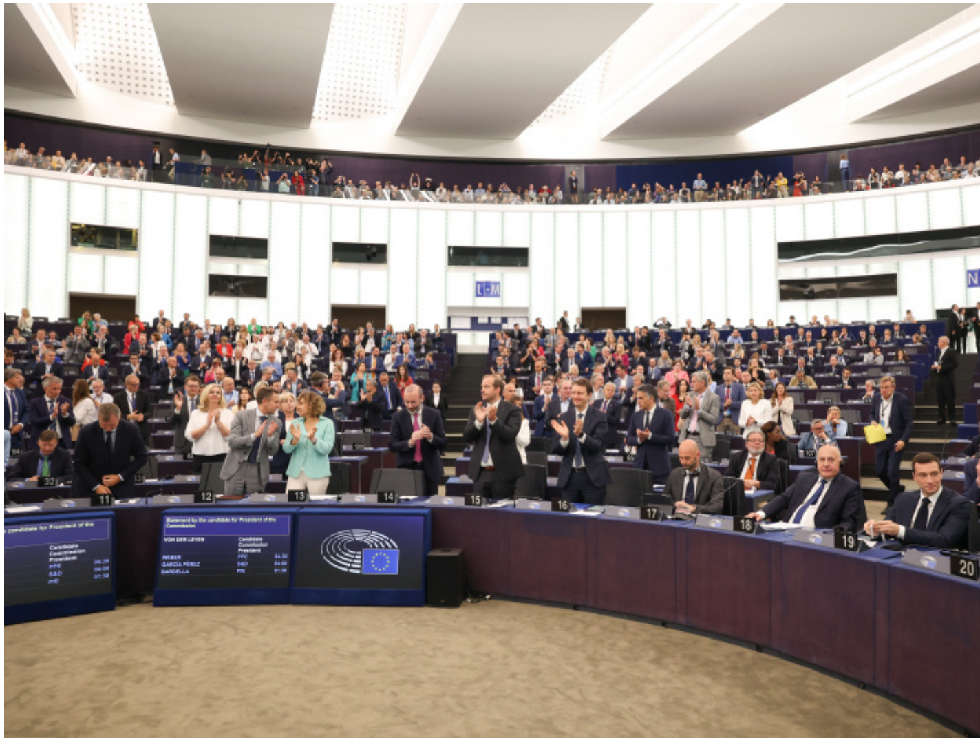
Alexis HAULOT, © European Union 2024.

Meno forse mi sento di concordare con questa idea che, grazie a questa accezione â??positivaâ?• di compromesso, esso possa poi davvero esser raggiunto. Mi viene il dubbio, tramite ad esempio alcune riflessioni di Kirchheimer che ha prima menzionato, che sia molto difficile pensare unâ??unione politica tra Stati â?? che ancora pretendono e posseggono (ma solo in parte) alcune prerogative tipiche della sovranitàâ?• senza un sostrato politico comune. Lei parlava testÃ© della Aufhebung hegeliana, appunto di quel â??levamentoâ?• che non oblitera le differenze; ma, forse, il grande problema ancor prima del pensare a questo â??levarsiâ?• delle differenze Ã? appunto autenticamente politico, ed Ã? cioÃ? capire se vi sia, davvero, qualcosa da mettere in comune, qualcosa che ancor prima del problema del compromesso metta al centro la questione rimossa dellâ??identitÃ? politica europea. Un concetto di â??politicoâ?• di stampo europeo Ã?; allora, possibile?