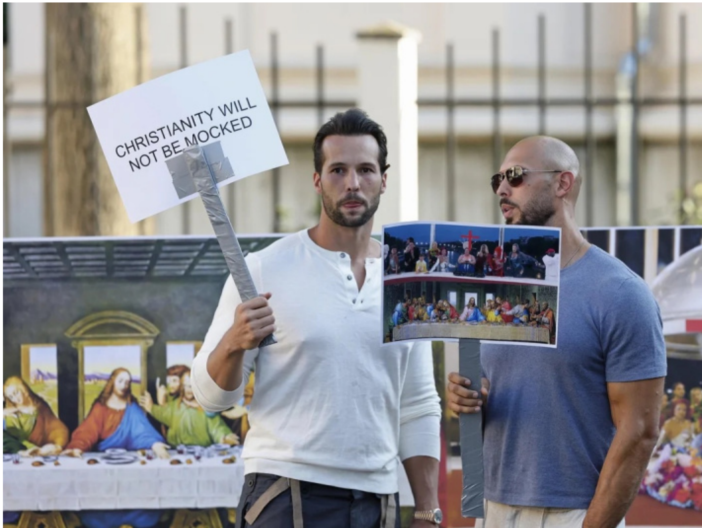
Andrew e Tristan Tate davanti all'ambasciata di Francia in Romania.

Un clamore mediatico cos'è forte, quello attorno a Feast , che ha portato Jolly e Anne Descamps a fornire scuse ufficiali a esprimere la non intenzionalità della performance inaugurale a offendere nessuna comunità religiosa, nello specifico appunto quella cattolica.