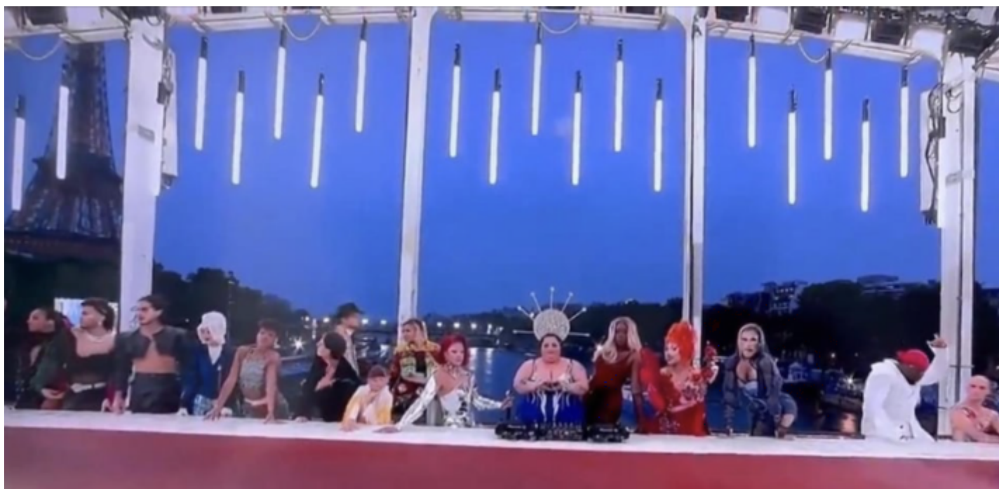
Feast , momento della cerimonia inaugurale di Parigi 2024.

della performance Feast (Fig. 3) ideata da Thomas Jolly, direttore artistico di Parigi 2024. Una rappresentazione di gruppo dal gusto camp , additata come gesto d'offesa alla comunità cristiana, o meglio cattolica, da parte di chi vi ha riconosciuto una rielaborazione dell'Ultima cena in drag.