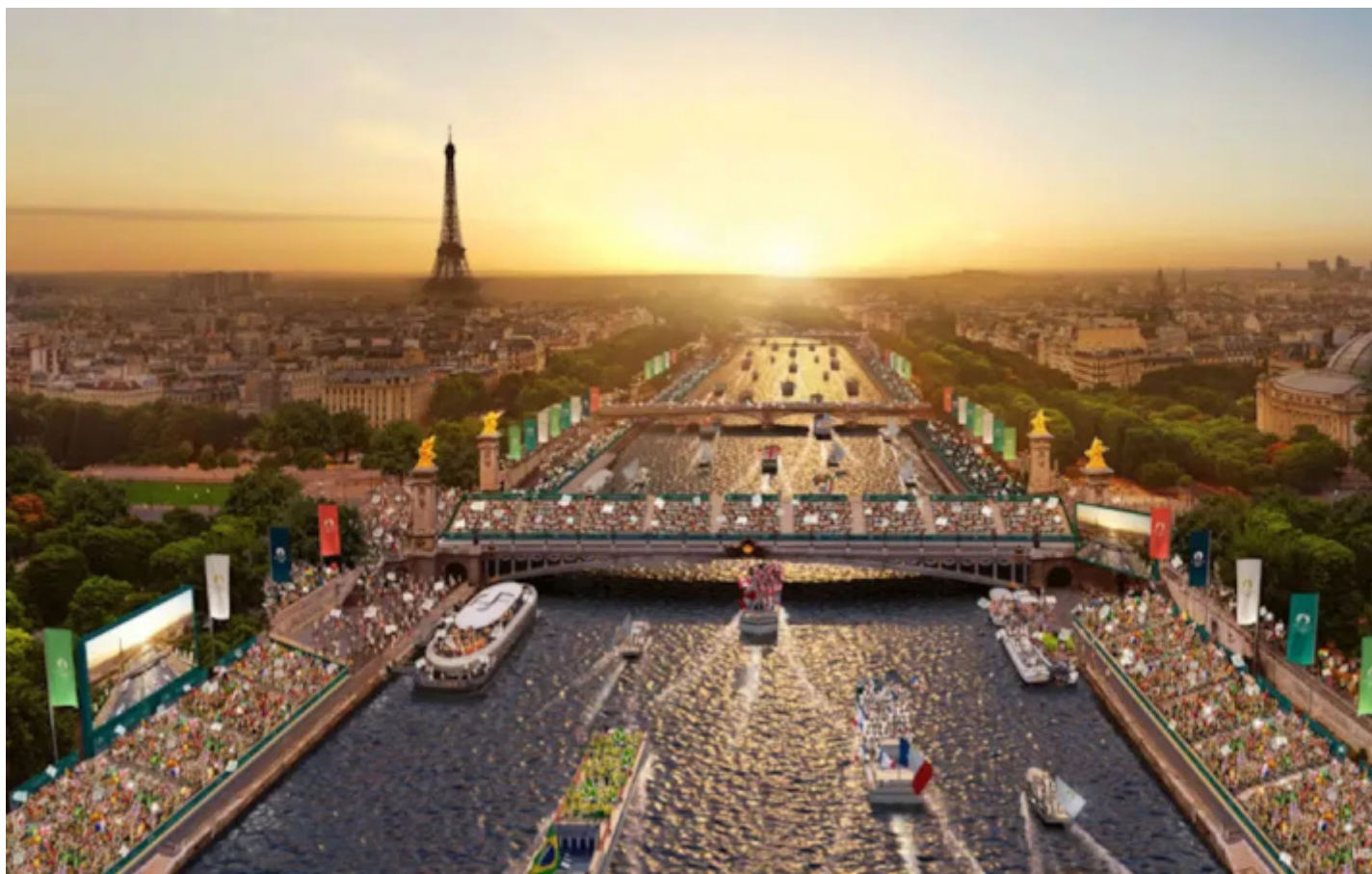
Cerimonia di apertura dei Giochi olimpici di Parigi 2024.

Per la prima volta nella storia dei Giochi Olimpici estivi, la cerimonia inaugurale di Parigi 2024 non si   tenuta all'interno di uno stadio bens  lungo la Senna. Una celebrazione maestosa, cos  era stata preannunciata anche dal comitato organizzativo, in cui le delegazioni di atlete e atleti   ognuna su una barca   hanno sfilato in un percorso di sei chilometri che si   concluso davanti al Trocad ro (fig. 1). Guardando a questo spettacolo, sorta di naumachia contemporanea,   possibile riconoscervi senza troppa fatica una sfacciata fascinazione per il mondo classico. Niente di troppo eclatante, in realt , se pensiamo a quanto gi  successo nel corso del Rinascimento (fig. 2) e ricordando, insieme ai fasti tipici degli ingressi trionfali, quell'interesse tutto italo-francese le rappresentazioni degli antichi greci alla base delle arti performative moderne come l'opera e la danza.