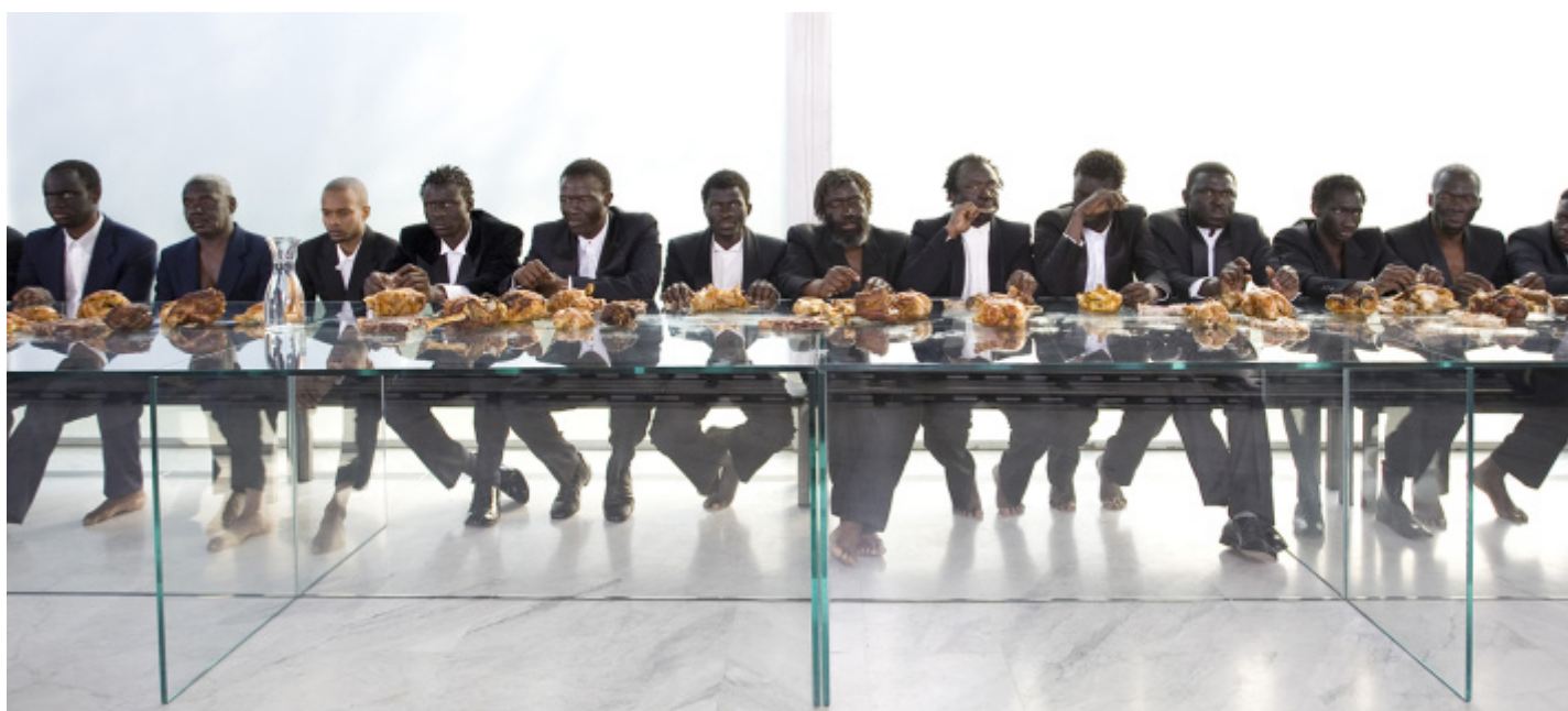
Vanessa Beercroft, VB65 performance al PAC di Milano, 2009.

Un gioco di relazioni intertestuali tra opere appartenenti a tempi e a geografie differenti Ã" altrettanto prolifico nella contemporaneitÃ in cui Ã" possibile constatare la sopravvivenza del motivo dell'ultima cena in rappresentazioni laiche come quelle di Vanessa Beercroft, Renato Cesaro o del caro e vecchio Homer Simpson (Figg. 7-9). Un gioco di intrusioni di memorie figurative che rievocano il banchetto fondativo della cristianitÃ senza, tuttavia, aver suscitato lo stesso clamore del momento performativo nel corso della cerimonia di apertura di Parigi 2024.