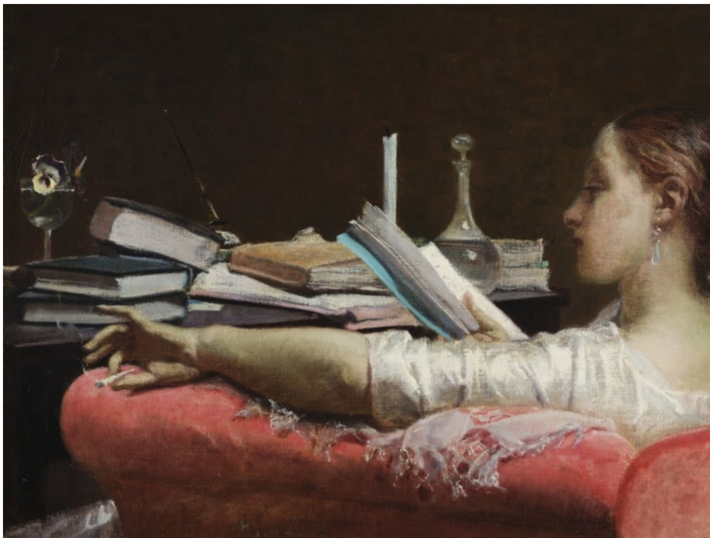
Federico Faruffini, Lettrice (Clara) , 1865, olio su tela, 40,56 x 59 cm, Milano, Galleria d'Arte Moderna.