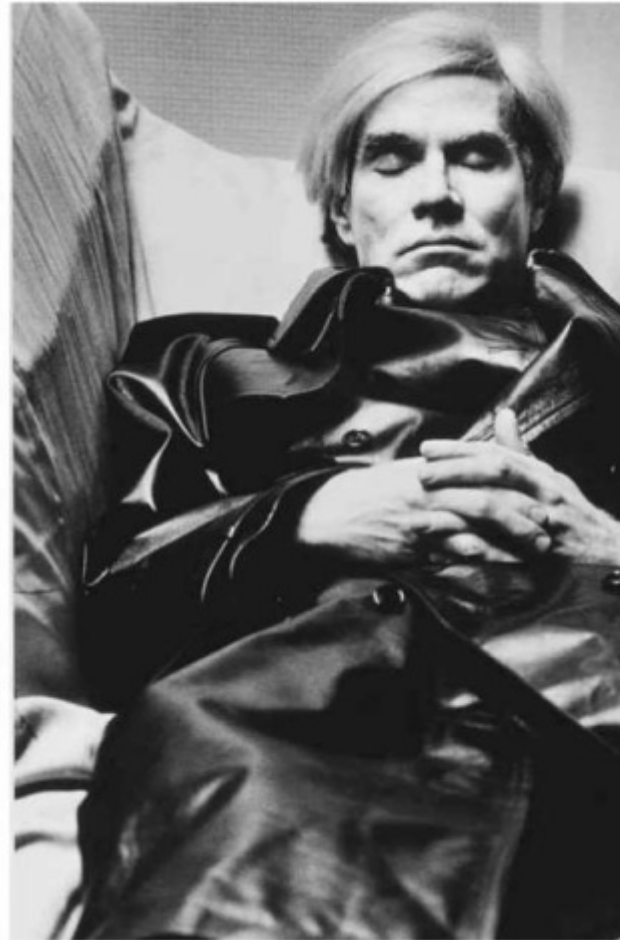
Andy Warhol ostenta le ferite procurategli da Valerie Solanas.

Valerie Solanas ha lasciato soltanto questi tre testi, anche loro torturati da chi avrebbe dovuto capirli, ma era un essere di scrittura . Quando Ã morta era rinchiusa con la propria macchina da scrivere e centinaia di pagine scritte che la madre ha fatto bruciare. Tutto il suo percorso biografico, medicina e giustizia comprese, autorizza a considerarla come Vincent van Gogh e Antonin Artaud una â??suicidata dalla societÃ â??. Degno di nota Ã il fatto che avesse rinunciato a scrivere un romanzo autobiografico, che sarebbe stato a dir poco drammatico, e preferito mantenere un tono di commedia o di farsa, ovvero una chiave comico-grottesca.