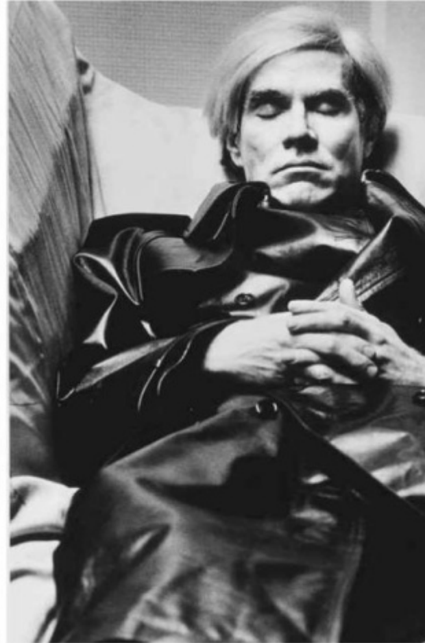
Andy Warhol ostenta le ferite procurategli da Valerie Solanas.

Valerie Solanas ha lasciato soltanto questi tre testi, anche loro torturati da chi avrebbe dovuto capirli, ma era un essere di scrittura . Quando Ã morta era rinchiusa con la propria macchina da scrivere e centinaia di pagine scritte che la madre ha fatto bruciare. Tutto il suo percorso biografico, medicina e giustizia comprese, autorizza a considerarla come Vincent van Gogh e Antonin Artaud una â??suicidata dalla societÃ â??. Degno di nota Ã il fatto che avesse rinunciato a scrivere un romanzo autobiografico, che sarebbe stato a dir poco drammatico, e preferito mantenere un tono di commedia o di farsa, ovvero una chiave comico-grottesca.