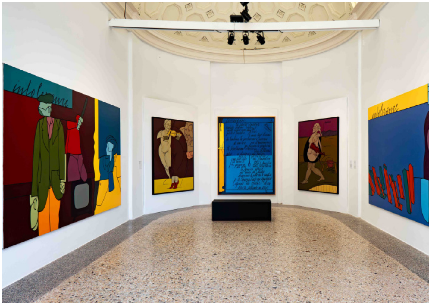
Valerio Adami_Palazzo Reale, Ph Gabriele Leonardi.

Le anatomie, pur rese con la mano sicura del disegnatore classico, sono attraversate da partizioni incongrue e faglie che le interrompono, le disassano, le deformano e le mettono in contrappunto con altri elementi grafici, ma senza mai far perdere la loro riconoscibilità. È una linea mentale, molto pensata, elegantemente sospesa tra figurazione ed esigenze puramente formali. Lo si vede bene nei disegni in cui si notano le cancellature ( le radici del disegno ): il segno definitivo e sicuro della matita grassa emerge da un lavoro precedente di linee che cercano le loro congiunzioni armonicamente geometriche. (In alcuni dei disegni presenti in mostra le didascalie dichiarano in modo esplicito l'importanza di questo lavoro: i materiali sono «matita e gomma su carta»).