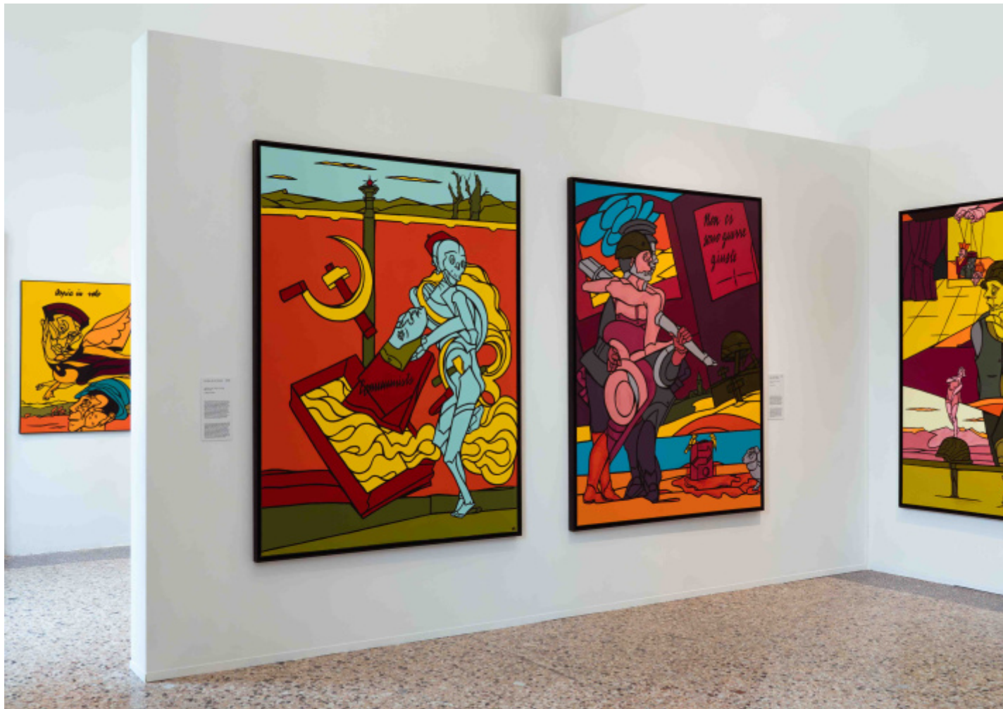
Valerio Adami_Palazzo Reale, Ph Gabriele Leonardi.

Dunque, Adami Ã un pittore che disegna idee. Ma Ã altrettanto importante aggiungere che disegnando racconta. Racconta in sensi diversi dal consueto: â?raccontaâ? con le peripezie che la matita attraversa sulla carta prima di arrivare alla sua acme; e piÃ¹ in generale â?raccontaâ? qualcosa che va al di lÃ di ciÃ² che si puÃ² dire con le parole. Una modalitÃ in cui riecheggia il ricordo di quando, da bambino, disegnavo per comunicare col nonno che aveva deciso di non parlare piÃ¹ e si fingeva sordo.