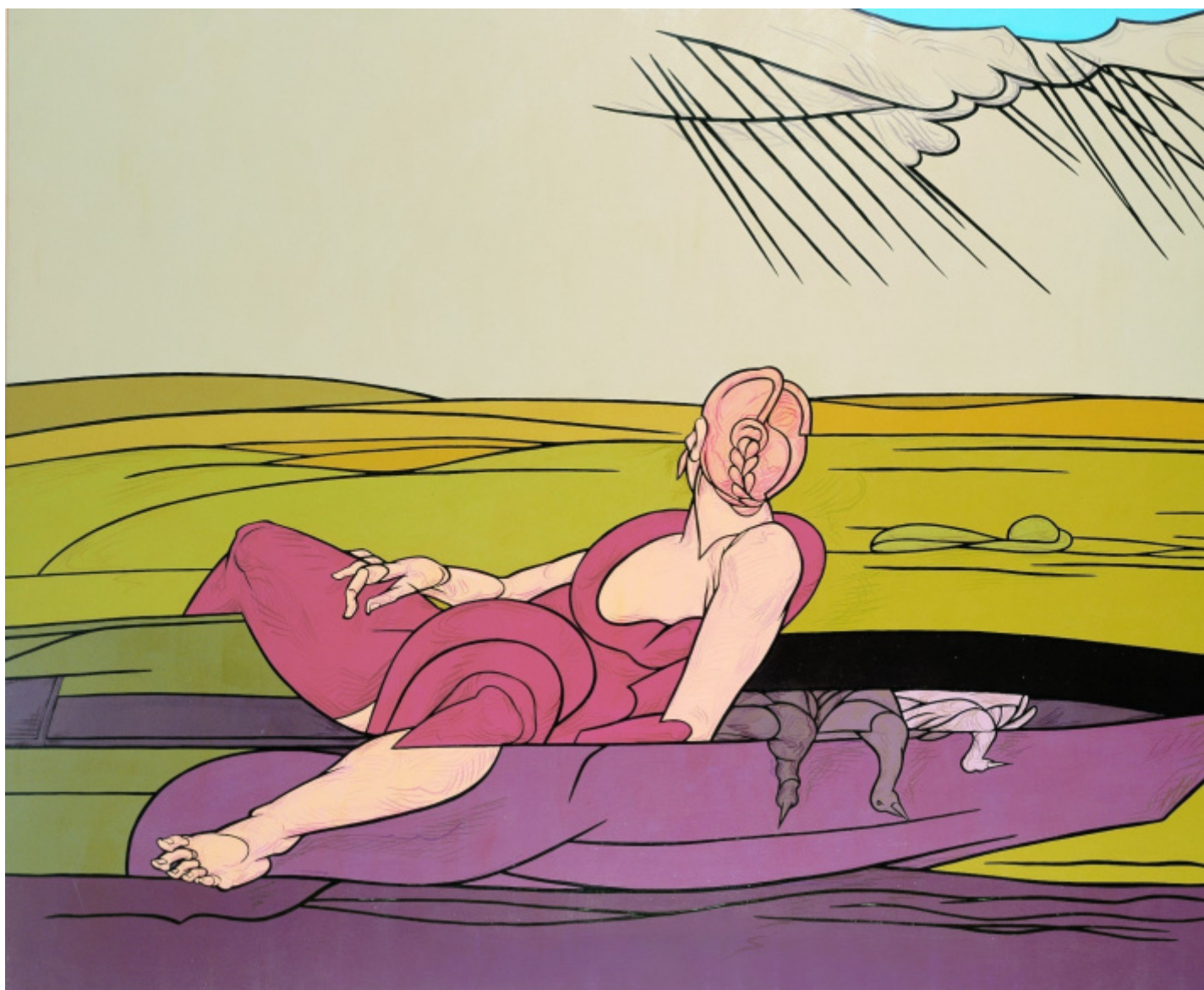
Valerio Adami, L'incantesimo del lago, 1984.

Il suo Ã© dunque un prestigio elitario, riconosciuto soprattutto in Francia e nell'ambiente intellettuale francese. E ci Ã©, a dispetto di uno stile che, a prima vista, non sembra affatto ostico.