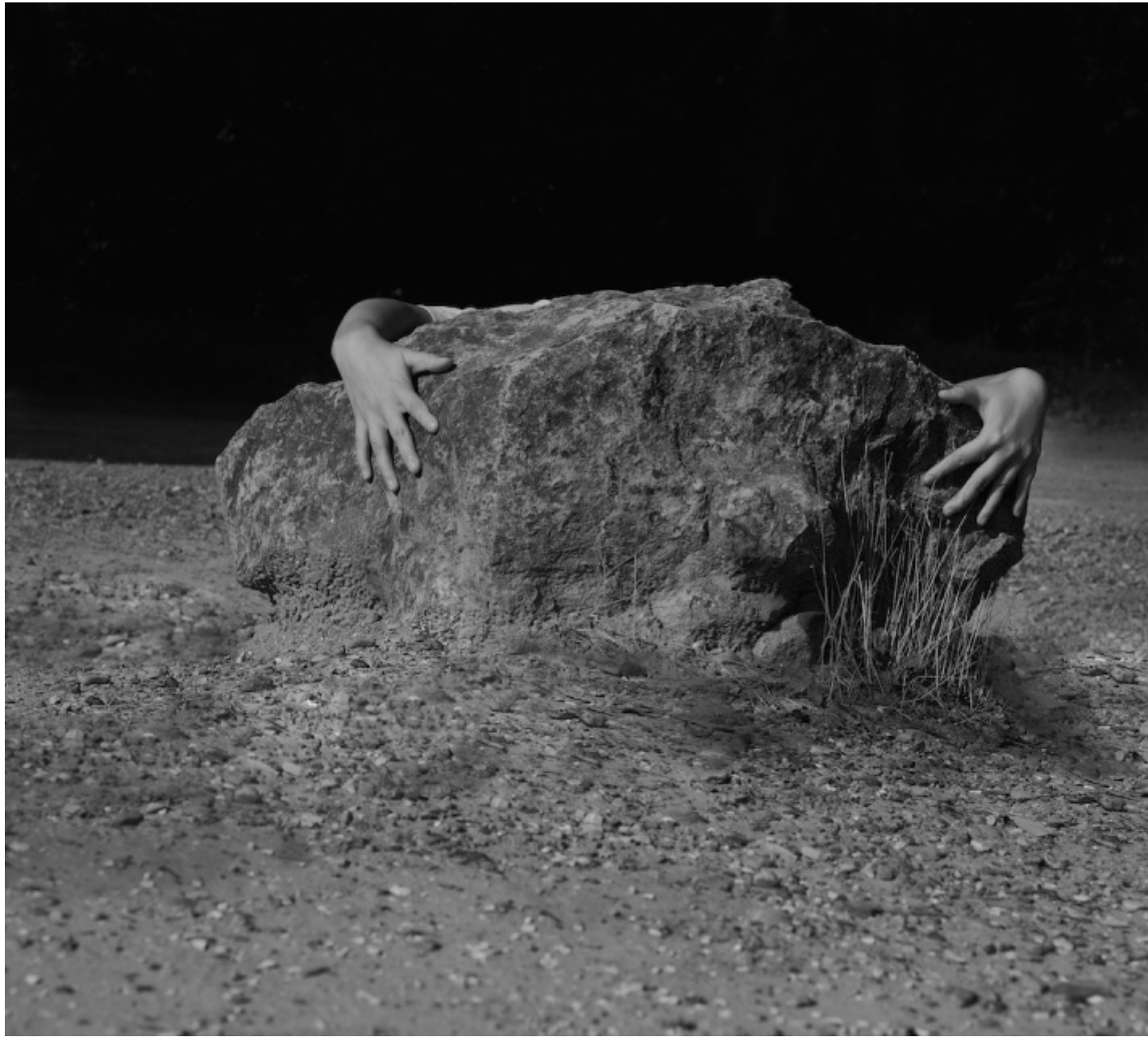
I saw a tree bearing stones in the place of apples and pears

sinfonia. Frammenti di spazio, il cielo azzurro dell'affresco in una chiesa, la tenda gonfia di vento in una stanza, il diario aperto sul pavimento, si alternano a frammenti di tempo, l'istante in cui le nuvole cariche d'acqua precedono lo scoppio di un temporale e la lenta sedimentazione delle pietre lungo le ere geologiche. Fotografie che mostrano come il tempo e lo spazio subiscano una mutazione, che ne sconvolge l'aspetto senza mutarne la sostanza. Martina, Maria, e la sconosciuta redattrice del diario potrebbero essere la stessa persona.