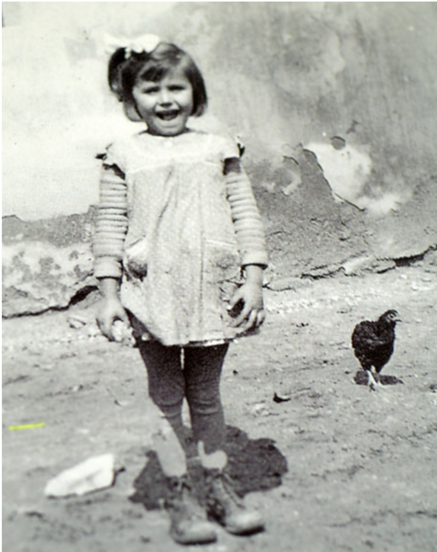
Agota Kristof piccola.

Fin dal titolo ( Line, il tempo ) l'autrice sembra illuderci che ci sia una possibile risposta: il tempo è una linea. Ma sarà vero? I due protagonisti di questo piccolo gioiello teatrale sono al parco e parlano, seduti su una panchina: Marc ha ventidue anni, Line dodici. Line è perdutamente innamorata di Marc, ma lui non la