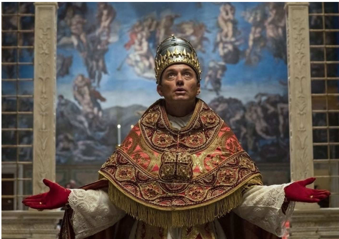
Jude Law nei panni di Lenny Belardo nella serie The Young Pope (2016).

È talmente difficile e complicato, nella vita come in un film, tenere in un solo corpo questi aspetti, che il tempo fuori dal tempo del miracolo (il tema della tesi scelto da Marotta, scartando l'argomento del suicidio) certamente non rappresenta la salvezza, ma diventa una zona paradossalmente vitale, anche in senso culturale e cinematografico, perché il codice del sacro (già presente nella serie televisiva The Young Pope e poi nel titolo stesso del successivo lungometraggio È stata la mano di Dio ) segna, anche ironicamente, il momento in cui la sistemazione si arrende, e in questo modo si può fare spazio non al significato chiuso e definitivo, ma almeno alla possibilità di vedere, e di vedere veramente: proprio come quando il Professor Marotta, alla fine della sua carriera, invita Parthenope a casa per mostrargli l'amatissimo figlio: una creatura deforme fatta tutta di acqua e sale - come il mare – che ci turba e ci lascia senza parole.