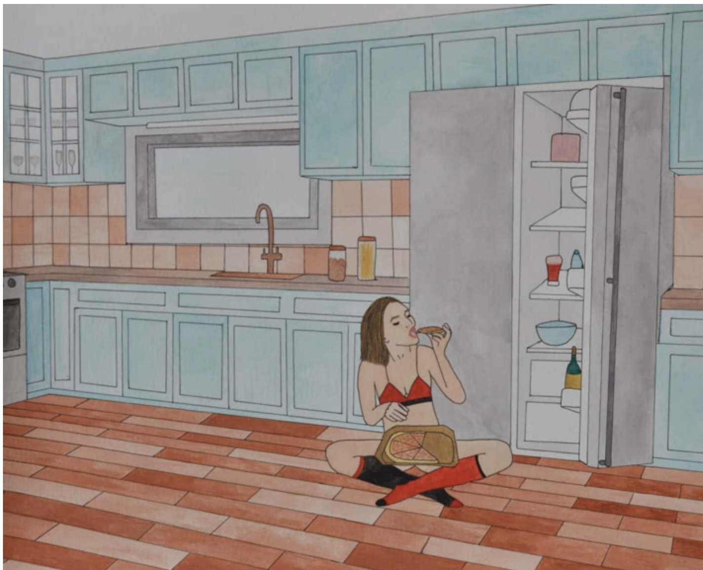
Illustrazione di Flupieland.