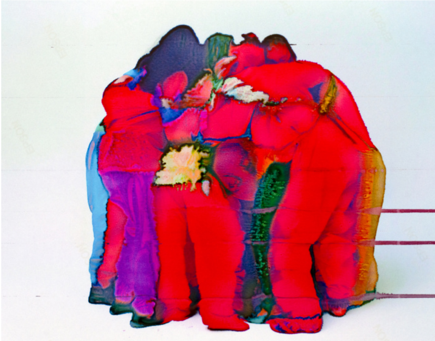
Hierarchy of Genres, 2021-in corso.

Prendevo cartellette, materiali da imballaggio, scotch, puntine â?? cioÃ? materiali della routine abbruttente del lavoro di ufficio, sempre uguale e vuoto â?? e li mettevo nello scanner muovendoli, di nuovo senza controllo, senza seguire troppo il risultato finale, cercando di capire cosa uscisse. Ã? stato veramente un lavoro molto di pancia, nato allâ??inizio come una mostra e basta, poi sviluppato in varie direzioni, per esempio una performance in Olanda per ragionare sull'ecologia dell'immagine, quando si iniziava a parlare dei server che inquinano, che una tua foto spedita nel cloud consuma energia, quindi ogni foto che facciamo comporta una responsabilitÃ anche etica, o in altri casi Ã? diventato il lavoro di tesi di un amico, la grafica di una collezione di un grosso marchio di moda e diverse altre cose. Era un lavoro quasi di pausa, perÃ? faceva parte di questa trilogia sulla via di mezzo tra figurativo e astratto.