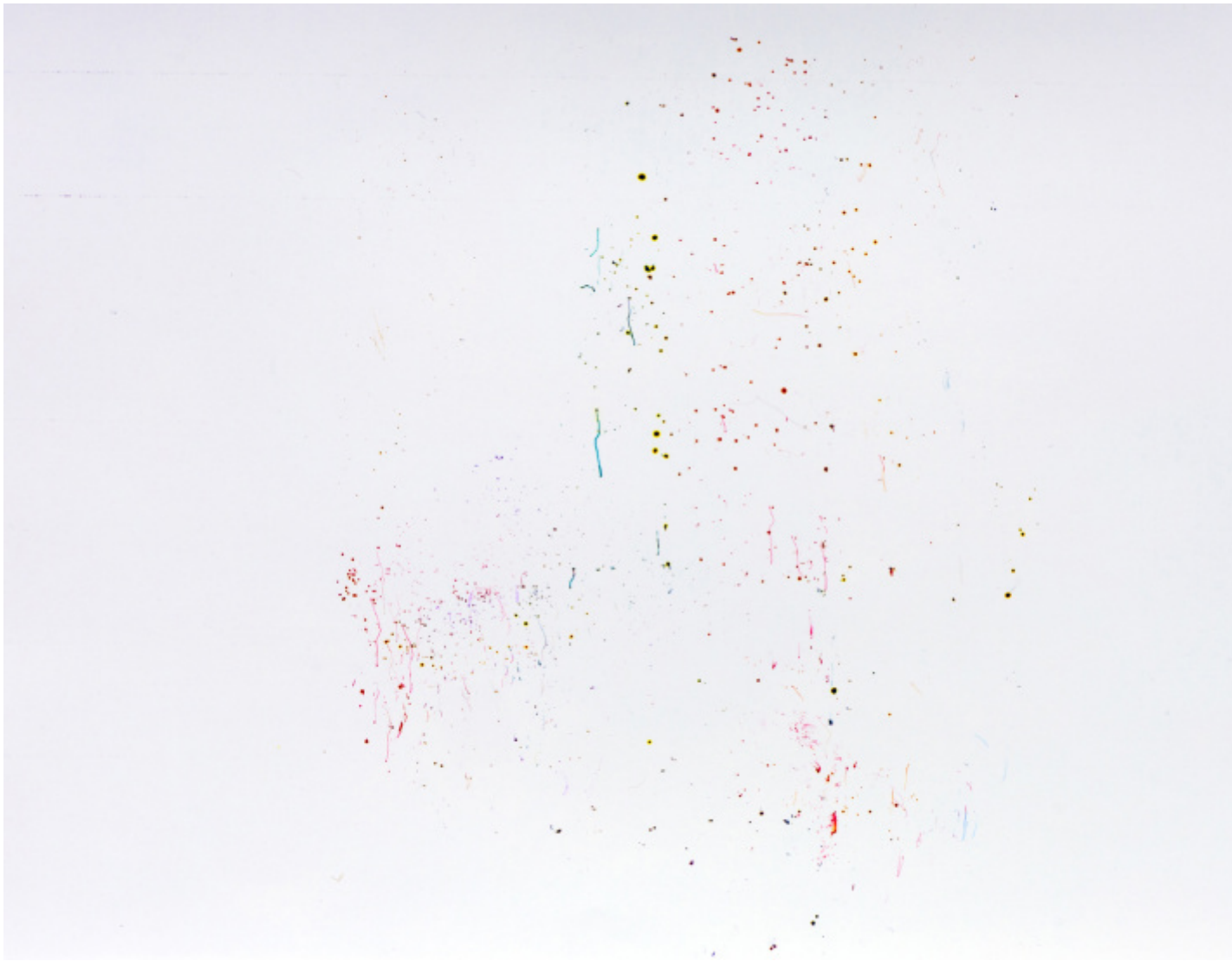
Bsides #01, Hierarchy of Genres, 2025.

un'immagine per sempre viva, ancora a distanza di mesi sporca se la si tocca. Io perÃ² la rifotografo, perchÃ© a me interessa utilizzare di nuovo la macchina fotografica, dunque viene fissata attraverso la rifotografia, fissata con un'altra immagine.