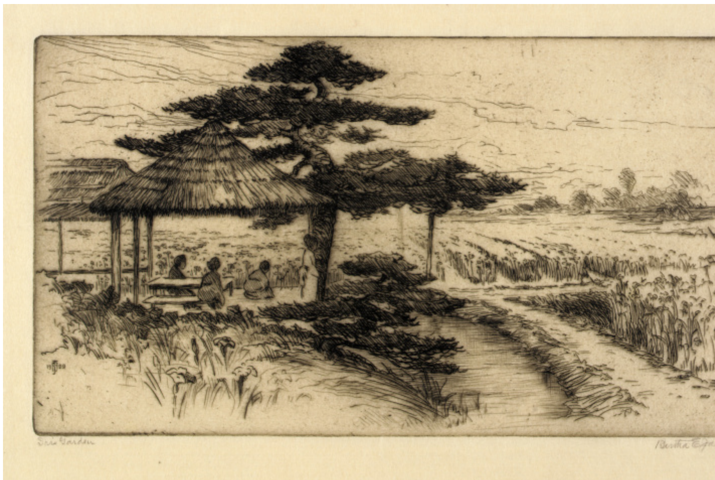
Bertha E. Jaques, Iris Garden , 1909, etching on paper, plate/ 5 x 8 7/8 in. (12.6 x 22.7 cm), Smithsonian American Art Museum.

«Pensavo di essere più orientale che occidentale» osserva Amélie nelle prime pagine rievocando la propria infanzia, salvo poi opporre la sentenza più ardua «scoprii che in Giappone non potevo vivere», ovvero rievocare l’abbandono, stavolta volontario, cui la costrinse l’età adulta. Il secondo “trauma giapponese” fu rievocato da Nothomb nelle tragicomiche peripezie narrate in Stupori e tremori (1999) in cui raccontava la propria drammatica esperienza lavorativa presso la multinazionale Yumimoto. Vessata dalla sua superiore, l’algida e inflessibile Fubuki, oppressa e dequalificata da una cultura professionale che non considerava l’individuo ma solo il sistema, alla scadenza del contratto Amélie, ventitreenne, lasciava il Giappone e tornava in Belgio – era la sua partenza ultima, definitiva. Da quel momento sarebbe iniziata la sua seconda vita, la vita da scrittrice, che in qualche maniera si poneva come un risarcimento della prima, ovvero l’esistenza giapponese mancata. Un susseguirsi di cause-conseguenze che Nothomb esprime bene e analizza con dovizia in L’impossibile ritorno :