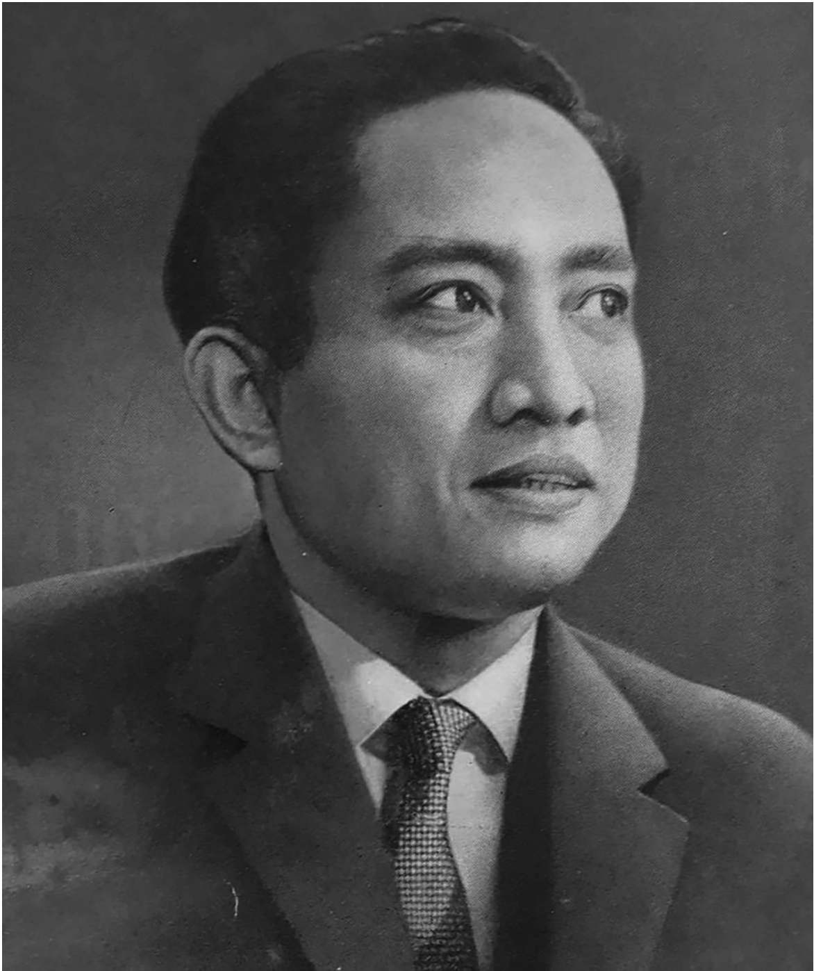
Dipa Nusantara Aidit

L'autore fa giustamente notare che, «oltre all'aspetto politico, l'influenza più profonda che il PKI esercitò nell'Indonesia degli anni Cinquanta e Sessanta si manifestò soprattutto nella sfera sociale e culturale, rappresentando il fulcro delle relazioni sociali per la quotidianità di milioni di persone. Per gli operai e i contadini, il PKI rappresentava una speranza di emancipazione economica; per i più umili, la prima occasione di alfabetizzazione; per le donne, un'opportunità di liberazione nella famiglia e nella società; per gli intellettuali e gli artisti, un punto di riferimento culturale che sfidava l'egemonia delle élite tradizionali; per i braccianti e i più poveri una sorta di difesa contro le forze ostili come proprietari