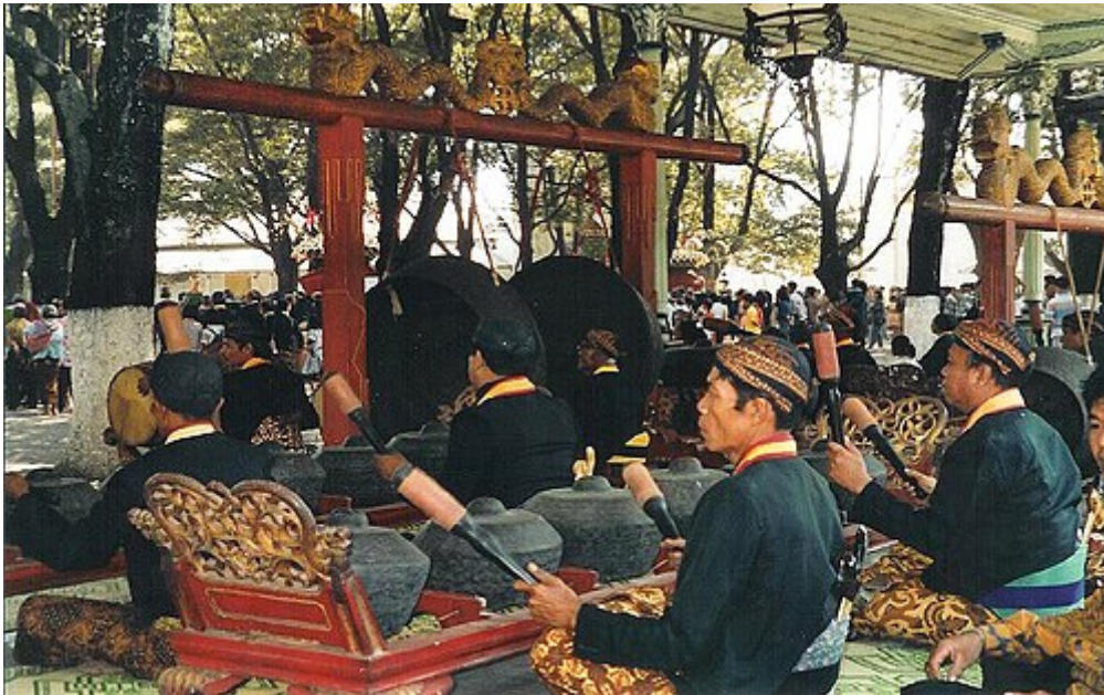
Orchestra Gamelan, Giava

Come dichiarò apertamente uno di loro al regista Joshua Oppenheimer, che nel 2012 realizzò il terribile documentario The Act of Killing , incentrato sul ruolo dei preman nelle stragi del 1965/66: «Abbiamo infilato legno nel loro ano fino a farli morire. Abbiamo spezzato loro il collo con bastoni. Li abbiamo impiccati. Li abbiamo strangolati con il filo di ferro. Abbiamo tagliato loro la testa. Li abbiamo investiti con le nostre auto. Ci era permesso di farlo. E la prova è che abbiamo ucciso delle persone e non siamo mai stati puniti». Militari e preman irrompevano di notte nei kampung , prelevavano i “comunisti” in mezzo alla gente imbestialita, caricavano sui camion anche donne e bambini di famiglie “comuniste”, raggiungevano la giungla e li sgozzavano sulle rive dei fiumi che al mattino apparivano tinti di rosso... E i rappresentanti delle varie associazioni religiose? I leader dei musulmani, dei cristiani, degli induisti? Non protestarono, anzi a volte si dimostrarono pure loro favorevoli all’annichilimento del PKI.