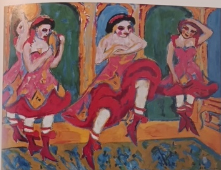
1 Czardastänzerinnen 1908/1920 150 x 200 cm; Gordon 49 Gemeentemuseum, Den Haag

Qui abbiamo in chiave fantasiosa, appunto, un giovane nero che duetta con una ballerina in lunghe calze nere e scarpe e punta, abito scollato a fiorelloni, braccia nude e un bizzarro cappellino a falde bianche, tra l'olandese, il mormone e il circense. Sullo sfondo altre tre danzatrici, un secondo uomo in nero, e i colori stupendi tipici di Kirchner, ispiratore del gruppo espressionista Brücke di Dresda con colleghi del calibro di Erich Heckel, Otto Mueller, Emil Nolde e Max Pechstein. La scena ritratta, pur nella sua originalità – s'è detto del sottotondo scherzoso o satirico – rientra pienamente nella tematica della nightlife metropolitana che il grande artista affronterà negli anni a seguire nelle più diverse tecniche, dall'olio su tela al disegno alla xilografia.