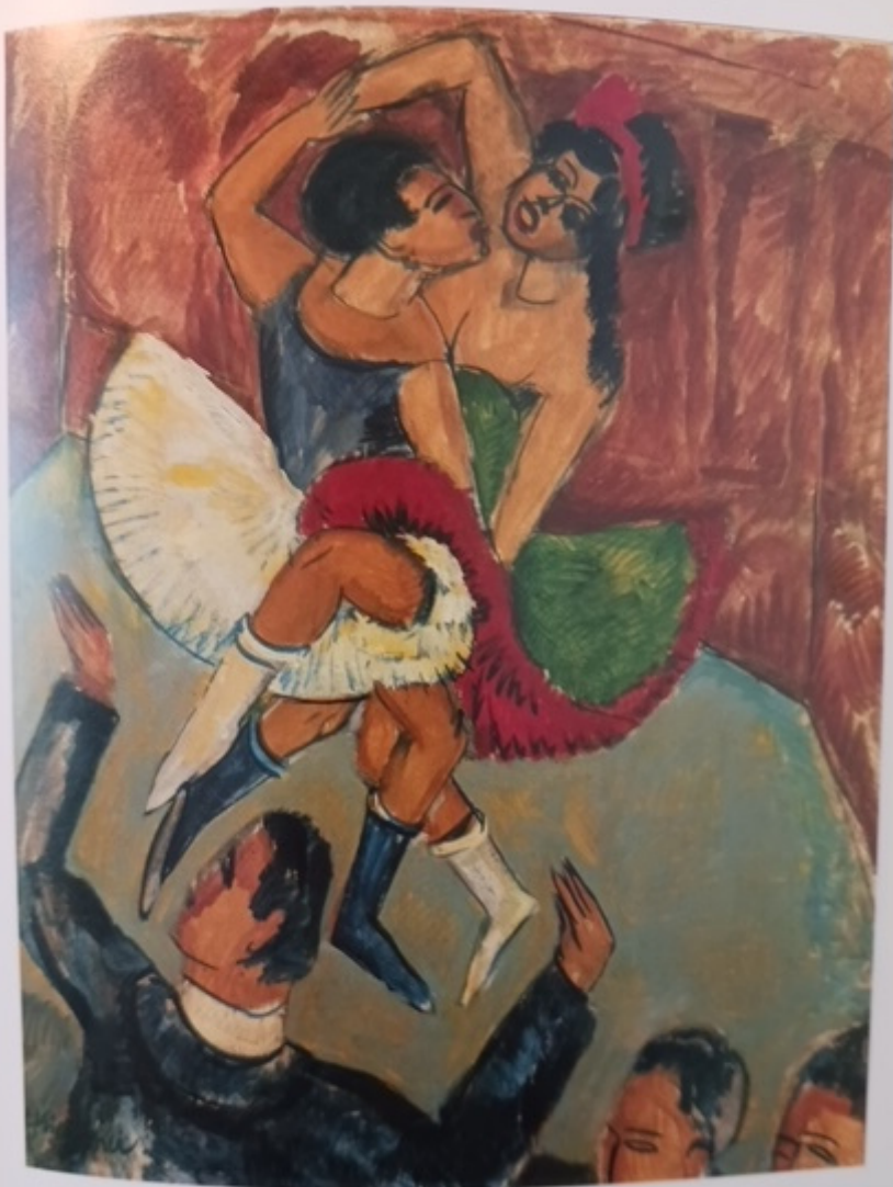
16 Negertanz um 1911 Leimfarbe auf Leinwand, 151,5 x 120 cm; Gordon 220 Kunstsammlung Nordrhein-Westfalen, Düsseldorf

Chi è stato l'acquirente? È stata la Stiftung Im Obersteg, benemerita fondazione partner da anni del Kunstmuseum Basilea, al quale ha affidato l'opera che nel corso dello scorso anno è stata amorevolmente restaurata. È dalla restauratrice Magdalena Ritler che si è avuta conferma del foro di pallottola, del taglio di baionetta, del distacco di scaglie di colore e di tratti di superficie danneggiati dalle vicende belliche. Con un delicato lavoro questa meraviglia della Jazz Age in salsa berlinese è così finalmente giunta a noi. E il viaggio a Basilea può davvero valere la pena.