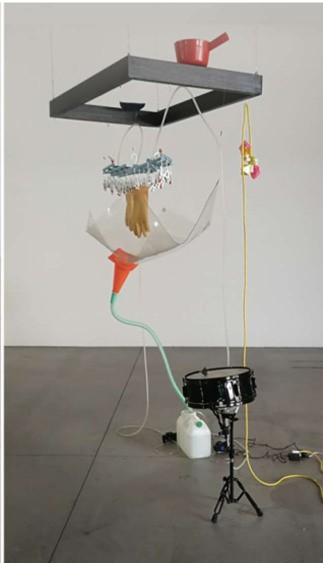
Yuko Mohri, Moré Moré (Leaky) Variations (Flow #3) / Yuko Mohri, Moré Moré (Leaky) Variations (Flow #2) , 2018. "Entanglements", Pirelli HangarBicocca, Milano.

Concepiti come ecosistemi complessi e imprevedibili, le opere di Mohri sono definite "assemblaggi", "sculture cinetiche site-specific", "installazioni". Da tempo abbiamo abbandonato ogni idea precostituita su cosa sia un'opera d'arte, tanto che Zasha Colah, curatrice della 13th Berlin Biennale, dichiara che «l'atto di impedire alla polizia segreta di bruciare i documenti o l'atto di salvare un lago potrebbero essere la rivendicazione artistica dei nostri tempi».