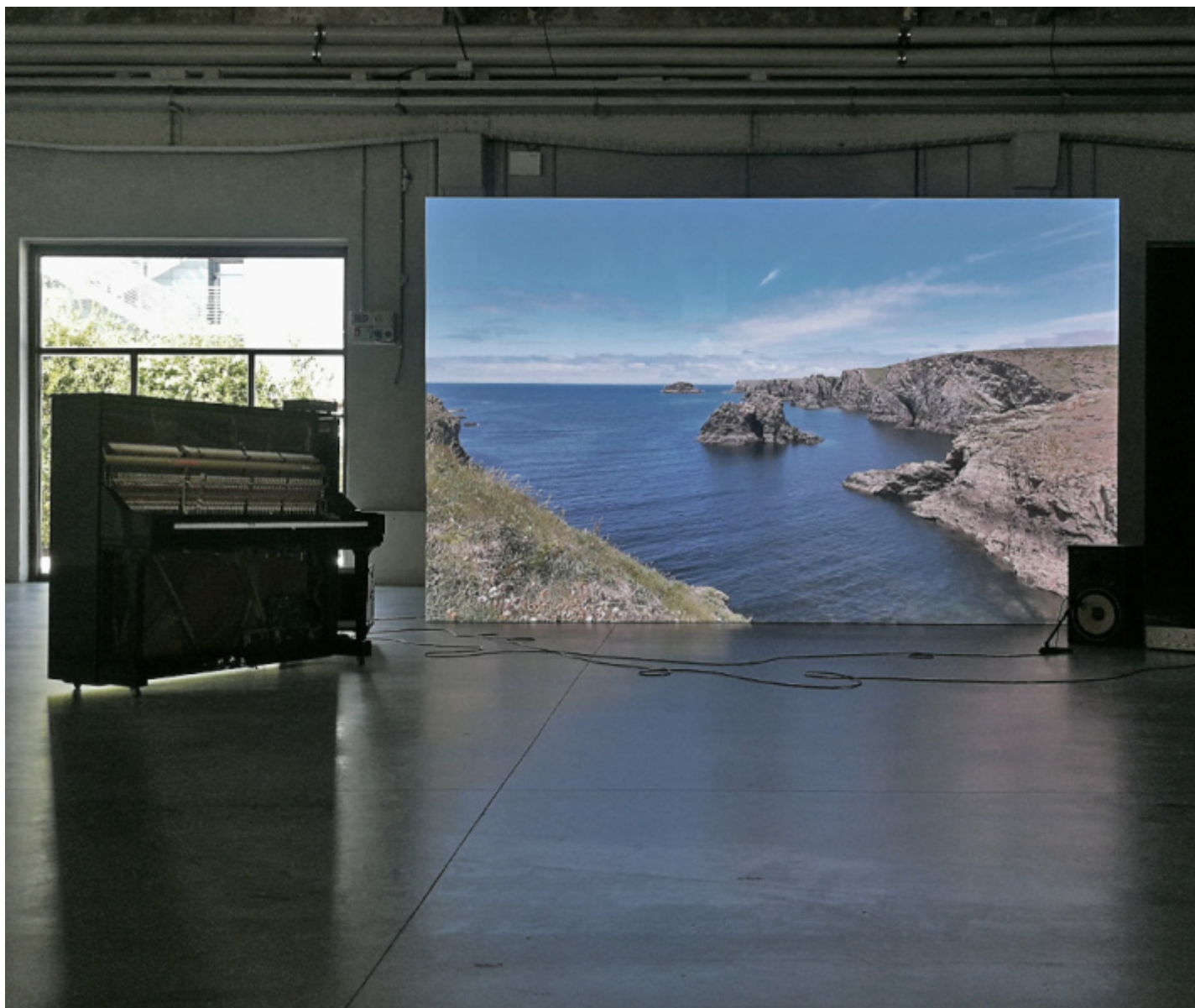
Yuko Mohri, Piano Solo: Belle-Île , 2024. Veduta dell'installazione, "Entanglements", Pirelli HangarBicocca, Milano.

Piano Solo: Belle-Île è un luogo da abitare. L'uomo «si sente protetto dalla bianchezza della calce più che da forti mura», scrive Gaston Bachelard in La poetica dello spazio . Abitare un luogo è un'esperienza complessa, determinata dalle nostre rappresentazioni interiori, oltre che dalle relazioni sociali, economiche e culturali all'interno delle quali si formano e ri-formano le identità e il senso di appartenenza. Le opere di Mohri esprimono anche il carattere instabile dei luoghi nell'età della globalizzazione e delle grandi migrazioni, evidenziando quel tropo dello spazio che nella contemporaneità si è imposto come flusso.