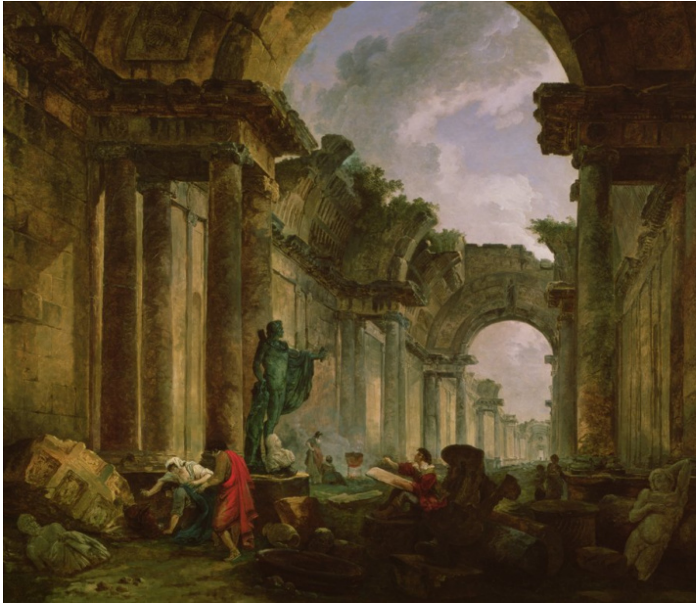
Hubert Robert, Veduta immaginaria della Grande Galleria del Louvre in rovina.

spazio inesistente, sono “dissociate dal contesto che le ha create”. Vivono sacre e separate dal mondo; da quel mondo che le ha volute, progettate e mandate in rovina. Rese orfane, diventano madri. Si trasformano, come mostra l’autrice (pp. 171-219), nel ventre che ospita una nuova verdeggiante vita: riparo per i vagabondi, nascondiglio per i piaceri della notte, tana materna per tutte le creature che cercano rifugio in una dimora accogliente e respingente, finalmente di tutti e di nessuno. Tra le rovine prospera la vita di chi è crollato, di chi è stato escluso, di chi è caduto fuori dal gioco del mondo, ed è finito in rovina. E di esse ne assume lo stato di eccezione , l’emarginazione, l’empia, intoccabile, santità.