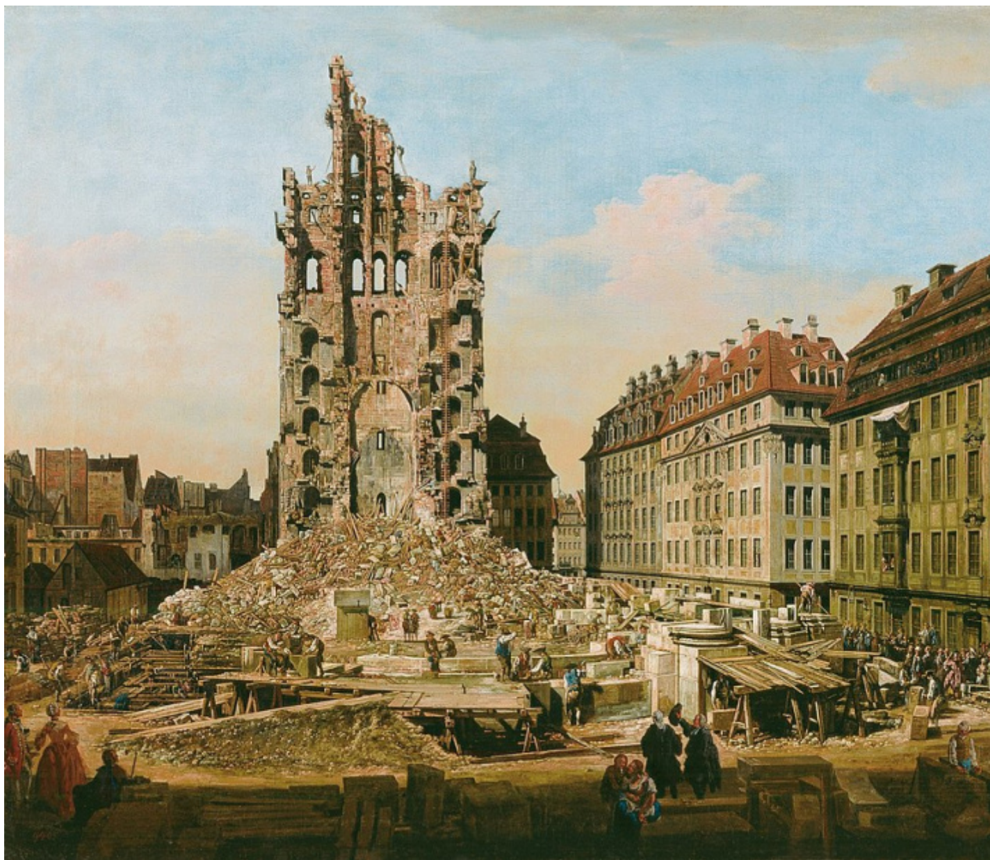
Bernardo Bellotto, il_Canaletto - Le rovine del vecchio Kreuzkirche, Dresda.

Il fil rouge che unisce e colleziona esperienze e forme così diverse è una mania per la rovina, come immagine e come idea, che trova la sua forza in contese insolubili, in armonie di contrari, in paradossi e accostamenti così improbabili e impensabili da dover per forza risultare reali. Infatti nelle rovine, da un lato, si consuma finalmente e plasticamente una sconfitta: poiché nell'inesausta lotta tra l'indomita natura e la cultura umana – con la sua mente multiforme, i suoi stratagemmi e sotterfugi volti a piegarla, sottometterla ed abitarla – la vegetazione sembra qui avere da ultimo finalmente la meglio. Dall'altro lato, però, il piacere che si prova davanti alle rovine resiste come indelebile testimonianza che anche nel caos più completo perdura un anelito di compiutezza: risulta allo sguardo una paradossale perfezione, un'imponderabile armonia, che mai si sarebbe potuta pensare , eppure ora naturalmente si realizza – da sé. La natura si riconferma la più grande artista; scherza, gioca, divaga con i manufatti umani, e le loro tanto artistiche quanto vane pretese di “erigere monumenti più durevoli del bronzo”, secondo il celebre verso di Orazio.