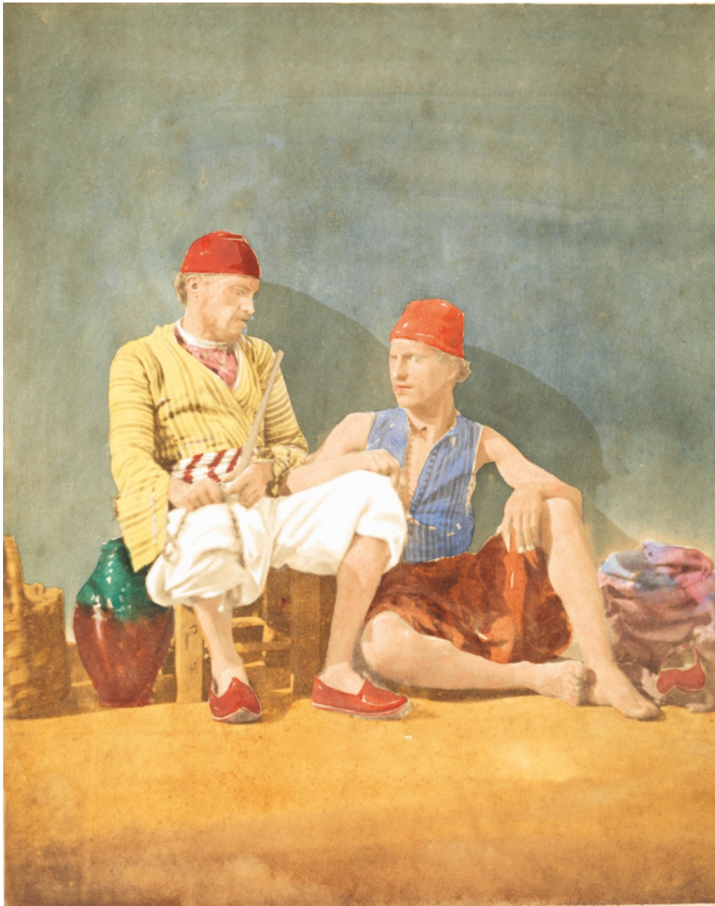
James Robertson, Autoritratto con il cognato Felice Beato in abiti turchi , 1855, Stampa su carta salata acquerellata / Salted paper print overpainted with watercolour 21 x 15 cm, The Ömer M. Koç Collection, İstanbul.