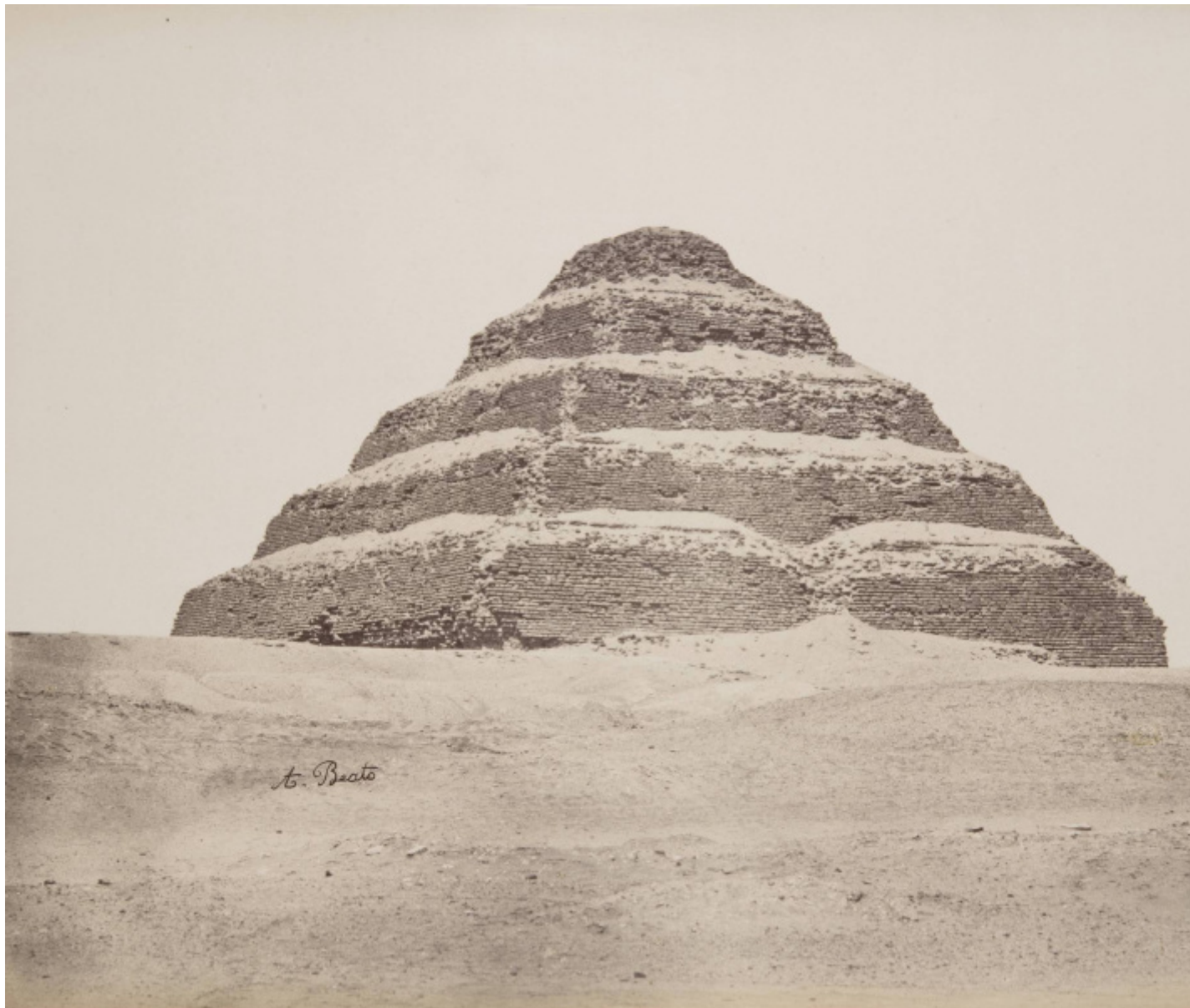
Antonio Beato, Saqqara. La Piramide a gradoni del re Djoser , 1860-1862 (?) Stampa all'albumina / Albumen print 20 x 26 cm Fondazione Musei Civici di Venezia - Museo Fortuny.