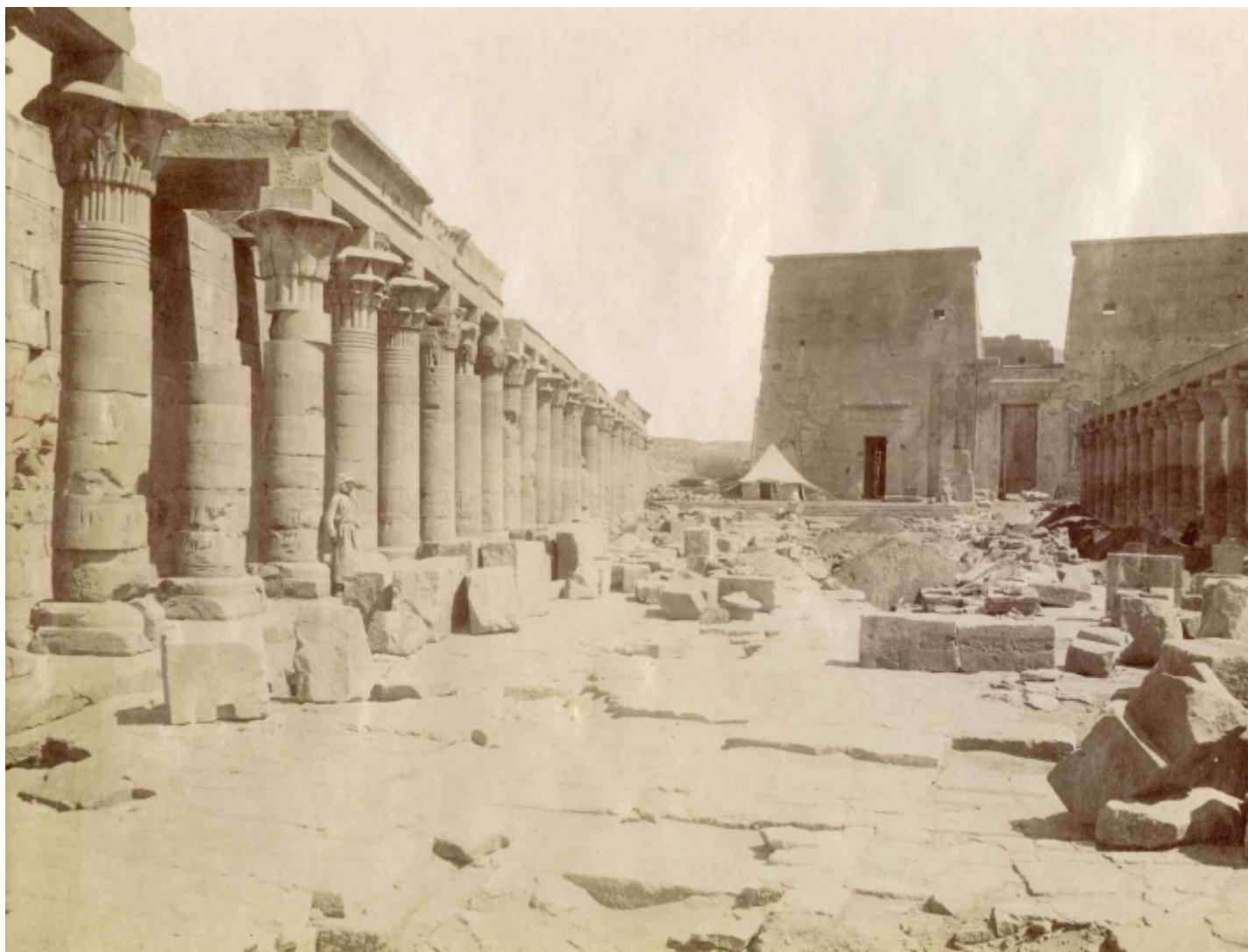
Antonio Beato, Isola di File. La corte di ingresso con i colonnati laterali e il primo pilone del Tempio di Iside , 1870-1888, Stampa all'albumina / Albumen print 23,5 x 33,6 cm Museo Egizio, Torino.