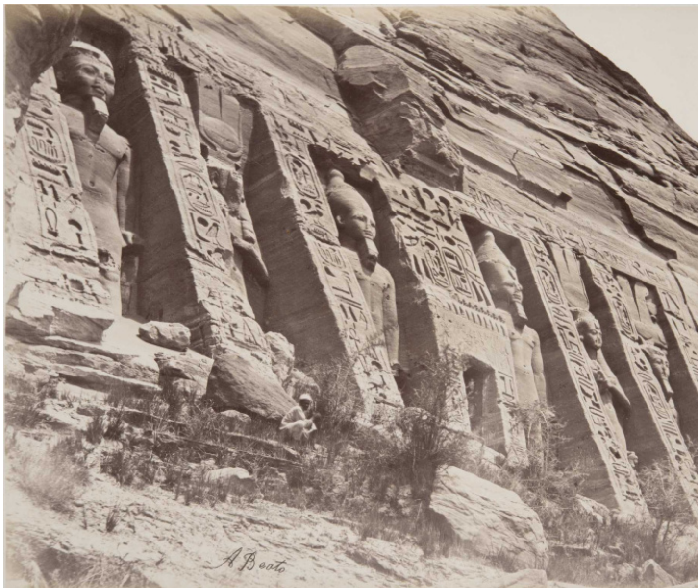
Antonio Beato, Abu Simbel. Facciata del tempio di Nefertari (Piccolo Tempio) con le quattro statue di Ramses II e le due statue della moglie Nefertari, 1870/1888, Stampa all'albumina / Albumen print 20,2 x 26,4 cm Fondazione Musei Civici di Venezia - Museo Fortuny.

Nel corso del tempo, dei due fama maggiore ha avuto il maggiore, Felice: spintosi più lontano, è divenuto notissimo in particolare per le sue fotografie giapponesi, che insieme a quelle di altri fotografi occidentali e non ( Adolfo Farsari , Raimund von Stillfried e i loro colleghi della cosiddetta “scuola di Yokohama”) documentarono l'apertura del paese all'occidente, portandone e in qualche modo disegnandone nel mondo l'esotica e già evanescente immagine.