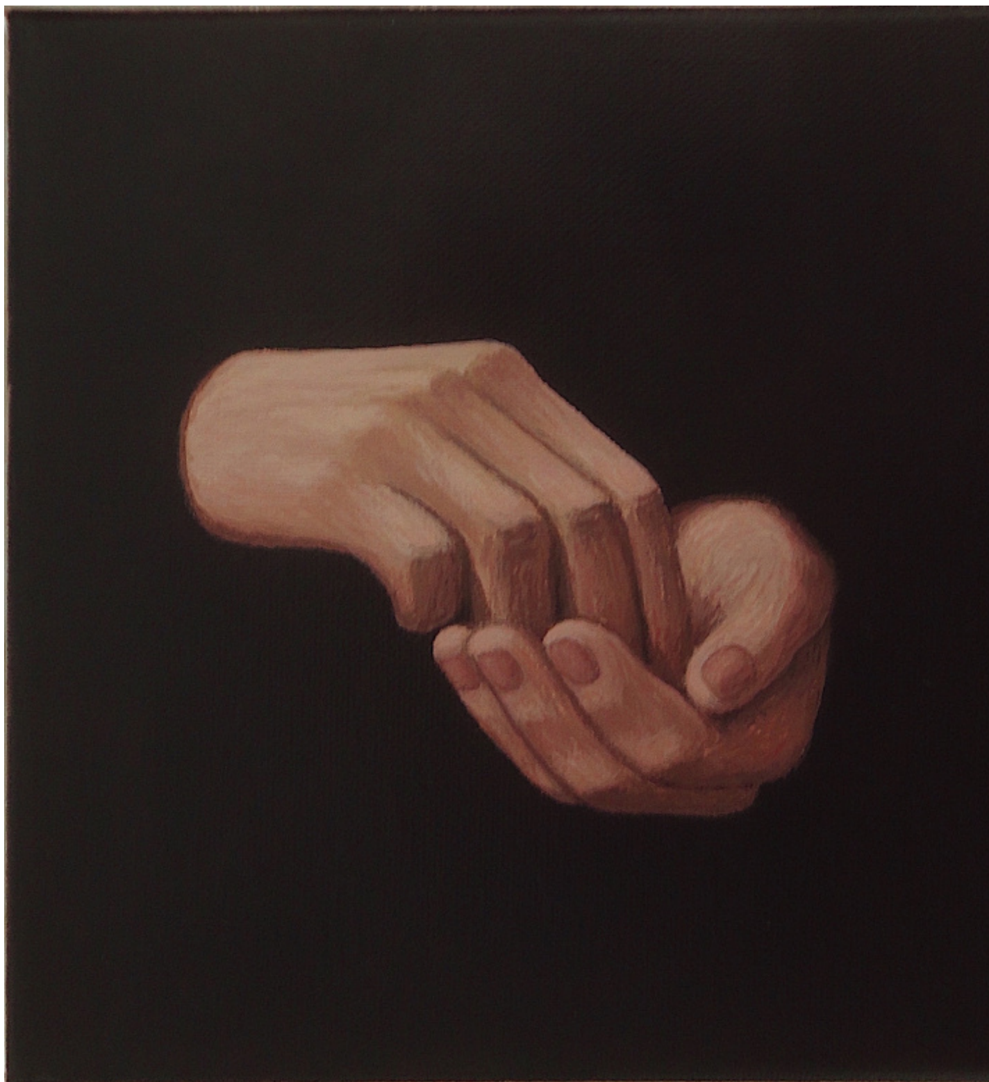
Mano nella mano.