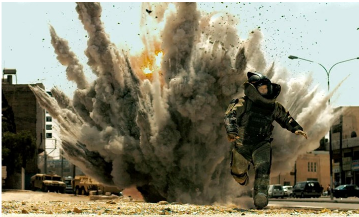
The Hurt Locker , 2008.

Durante la proiezione di un film, raramente qualcuno si alza e cerca l'uscita della sala senza averci pensato bene. Si tratterebbe infatti di disturbare altre persone sedute a guardare, di procedere a tentoni nel buio, e, soprattutto, di interrompere il patto sancito dal pagamento del biglietto per l'ingresso. Ma, soprattutto, significherebbe sottrarsi alla magica illusione del grande schermo cinematografico, ovvero al sentimento onirico che tutto il mondo, in quelle due ore, coincida con quello che si sta guardando. Purché la copertura della rete telefonica sia assente, il paradosso della temporaneità assoluta di questa messa in pausa della vita lasciata fuori dilata e rende unica l'esperienza e lo spazio del cinema, come quella dei nostri corpi al suo interno. In certe opere, poi, come nei thriller, questa sorta di sequestro paradossale diventa una condizione speciale di cooperazione creativa, perché moltiplica il senso di suspense, la tensione narrativa e l'immedesimazione. Ed è proprio questo il punto da cui è importante partire per parlare dell'ultimo film diretto da Kathryn Bigelow.