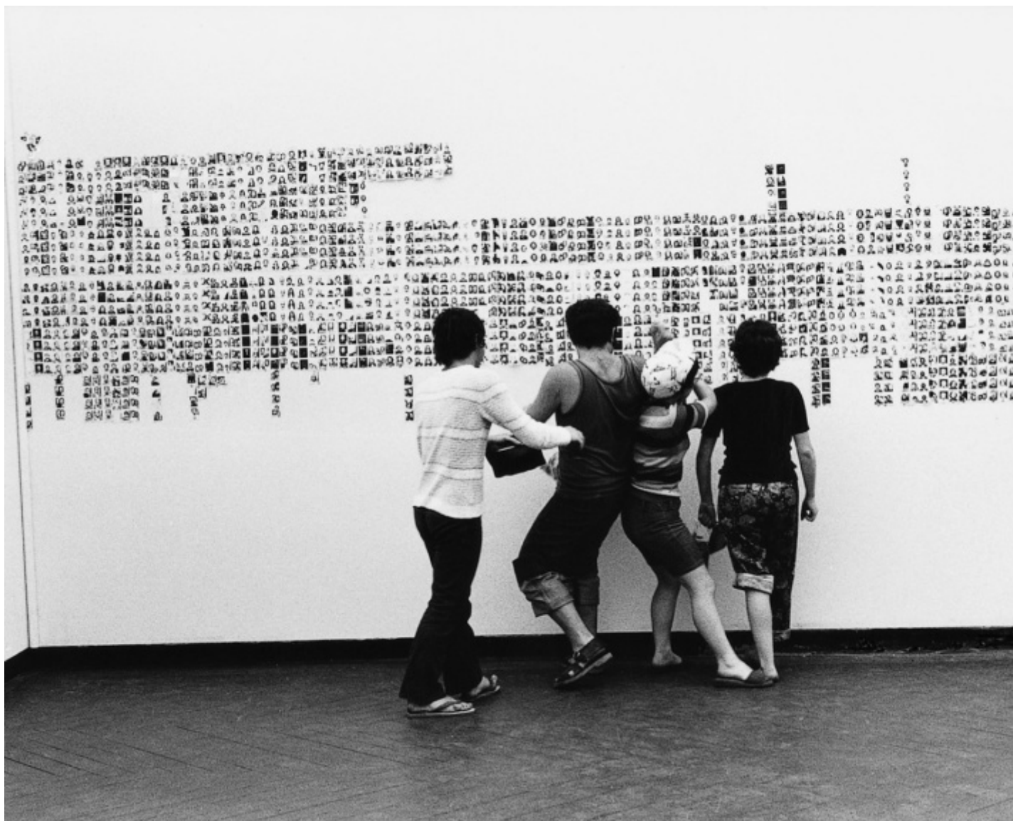
Esposizione in tempo reale n.4: Lascia su queste pareti una traccia fotografica del tuo passaggio (1972). Veduta dell'installazione alla XXXVI Biennale di Venezia.

In questa fase personalmente l'ho trovato un po' più irrigidito, dimostrativo, l'attualità fa questi scherzi, ma in realtà è un limite mio, perché avevo perso di vista il suo percorso, mentre lui era conseguente e come sempre teneva insieme tutto. Anche i due code infatti li ha intrecciati ai diversi aspetti della sua opera, compreso quello "onirico". Ero io a non averlo notato. E così avevo scoperto solo dopo aver scritto il mio libretto sulla telepatia che aveva realizzato una intera mostra sull'argomento a Napoli nel 2014 ( Rumori telepatici , alla Fondazione Morra Greco). È una mia mancanza e un mio rimpianto.