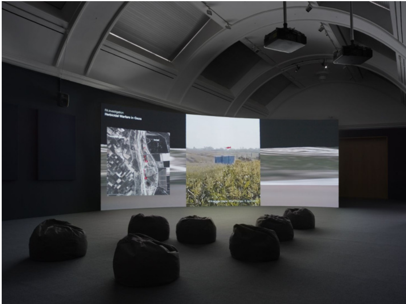
Forensic Architecture, Cloud Studies , 2021 (installation view, MIF21, Manchester).

Ma quando la densità del segnale supera la capacità di ascolto, subentra l’“iperestesia”: il sovraccarico sensibile che implode in rumore. In questo rumore, la verità si disperde. È l’arma, inconsapevole o deliberata, del potere: saturare la visibilità per impedire la costruzione di senso. In questi termini, la sovrapproduzione di immagini, dati, video non attesta verità: la seppellisce.