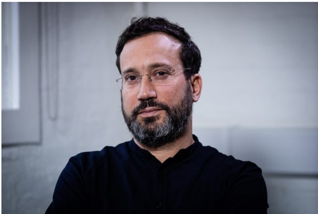
Eyal Weizman.