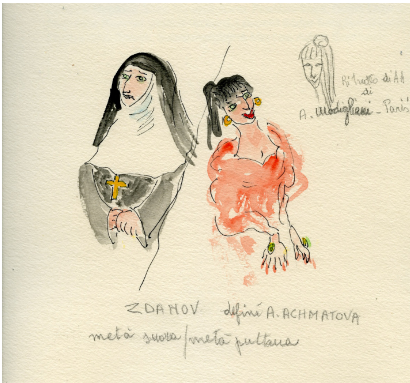
Angela Ricci Lucchi, acquerello e china su carta, 1989.