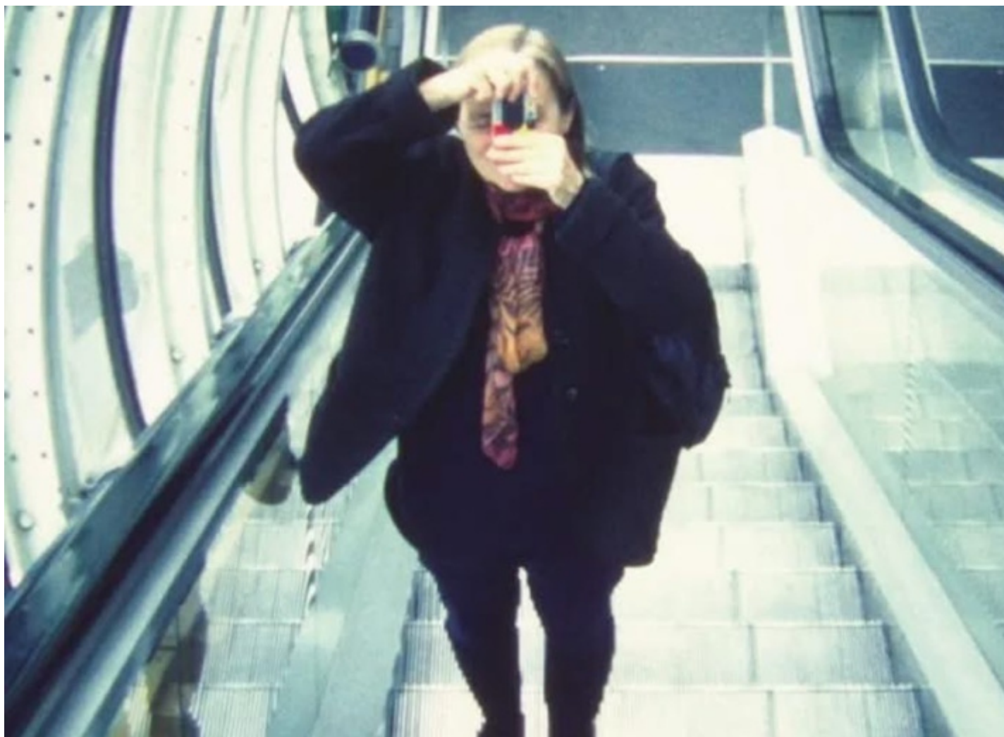
Fotogramma da I diari di Angela - noi due cineasti. Capitolo terzo .

esprime una dinamica che è anche propria del loro privato. Solo dopo la morte di Angela, nel febbraio 2018, è diventato possibile avere accesso alla vita e al lavoro che hanno condiviso per oltre quarant'anni. Con I diari di Angela – noi due cineasti (2018) e il suo seguito I diari di Angela – noi due cineasti, capitolo due (2019), Yervant Gianikian ha realizzato due film a partire dall'archivio privato, ossia i suoi "home movies", e dai diari di lei. Una fatica amorosa che mostra la natura speciale della relazione alla base della loro straordinaria impresa creativa. ".