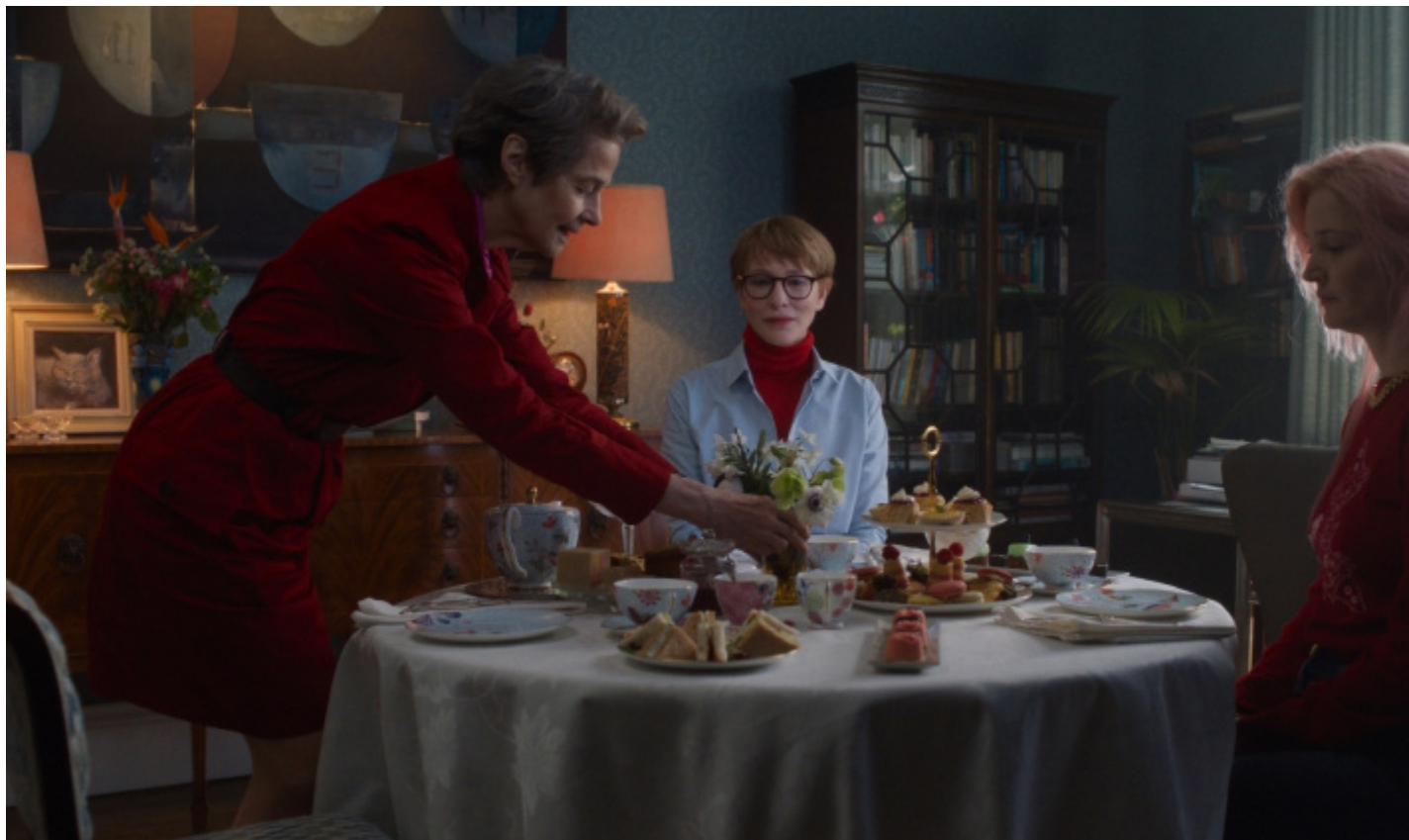
Charlotte Rampling, Cate Blanchett, Vicky Krieps.

Il silenzio, in Father Mother Sister Brother , è l'indice retorico di un'estraneità vicendevole. Ognuno interpreta una parte e tutti si mostrano per quello che non sono – Tom Waits come il povero vecchio accondiscendente abbandonato ai suoi ricordi, Vicky Krieps come l'aggressiva imprenditrice di e-commerce –, modulando se stessi in funzione delle aspirazioni che credono ancora vive nell'interlocutore. Di fatto sono figure assenti l'una per l'altra pur nell'illusione di una presenza estemporanea, che sfuma immediatamente dopo che i convenevoli, la visita di cortesia, si è conclusa. L'inerzia del dialogo ha però la sua compensazione in una scenografia resa sempre piena, ingombra di oggetti, che fungono da correlativo alla languidezza scorata dei personaggi, come se le reazioni si trasferissero tutte nelle cianfrusaglie che affollano la stanza, lasciandoli esangui di autentiche emozioni.