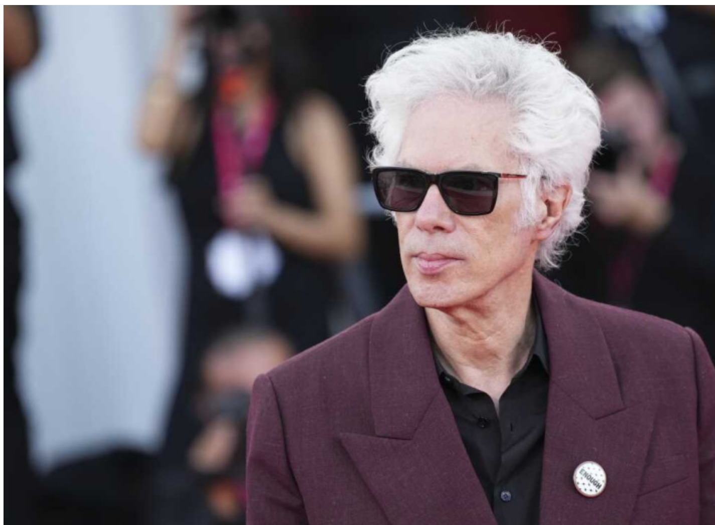
Jim Jarmusch alla premiere veneziana del film.

Si è fatto un gran parlare dei silenzi di un film come Father Mother Sister Brother di Jim Jarmusch, soprattutto dopo la sua vittoria all'ultima Mostra del cinema di Venezia da totale outsider, quando tutti già preconizzavano i favoriti La voce di Hind Rajab , No Other Choice , A House of Dynamite , Sotto le nuvole e La grazia . E di silenzi si è parlato anche negli articoli che hanno accompagnato l'uscita del film, come se il tratto distintivo di un lavoro sulla crisi della famiglia fosse tutto in questi momenti in cui il dialogo si ferma, balbetta, resta in attesa di qualcosa che probabilmente non avverrà. Ma il silenzio nel film di Jarmusch è solo uno degli aspetti di cui si compone un lavoro complesso, stratificato, probabilmente meno coinvolgente sul piano emotivo di La voce di Hind Rajab , dalle soluzioni visive più discrete rispetto a No Other Choice e dalla struttura più lineare, con i suoi tre episodi giustapposti, in paragone ad A House of Dynamite , tanto per restare nell'ambito delle polemiche veneziane, ma certo non meno ricco di questi stessi lavori sul piano della densità degli elementi significanti.