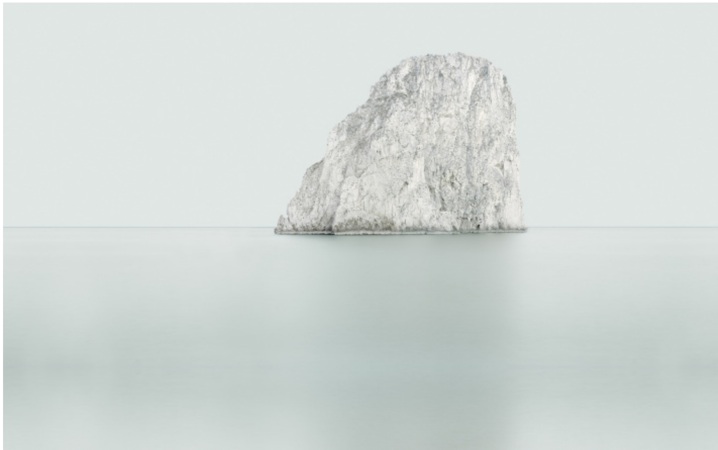
Capri. The Diefenbach Chronicles, #014, 2013.

FJ: Sì, io chiedo al museo o alla galleria di contattare le scuole medie più vicine al luogo dove le opere sono esposte, perché, mentre i musei pubblici lo fanno per abitudine, credo che anche le gallerie oltre a fare mercato debbano diventare dei luoghi di cultura per il quartiere, sono spazi intellettuali al servizio della comunità. Quindi noi contattiamo le scuole e invitiamo i ragazzi ad una visita guidata e poi alla fine della visita coinvolgiamo gli studenti in una "performance" di scrittura. Nel progetto What We Want ogni fotografia scaturisce da un testo di geopolitica che ho scritto su quel luogo, questo testo viene messo a parete su un foglio prestampato, ai ragazzi viene dato un riquadro e noi chiediamo loro di trascriverlo, ed è un testo molto farraginoso non tanto nella forma ma per i contenuti. Questo diventa anche un modo un po' di ragionare anche su argomenti complessi. L'intenzione della performance di scrittura a parete è: partiamo dalla società, dall'arte, dalla politica, che sono le basi; iniziamo a capire come è fatto l'ambiente che voi calpestate tutti i giorni, e quindi cerco di fare una sorta di passo indietro con questi testi. Dopo con i ragazzi ne discutiamo in galleria o nel museo.