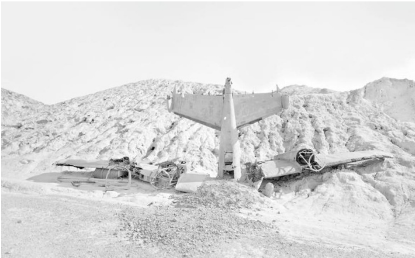
West, Nelson, Nevada, #018, 2017.

Invece nel rifotografare dettagli delle sue tele mi sono concentrato sulle crepe oppure sulle carte di riso che erano state applicate per assorbire l'umidità e che nelle mie fotografie diventano dei rettangoli bianchi nel quadro, come fossero delle improvvise amnesie della storia. L'analogia che ho tentato di stabilire è sorta mentre leggevo la sua biografia e ho pensato che Diefenbach ha dipinto alla fine dei grandi imperi e muore all'inizio della Prima guerra mondiale ed io sono nella sua stessa posizione, vivo alla fine della storia dell'Occidente e all'inizio di qualcosa che è davanti a me e che ancora non riesco a vedere, tornando al discorso del perturbante. Quindi ho cercato di fare un lavoro ponendomi proprio nella stessa posizione civile e culturale.