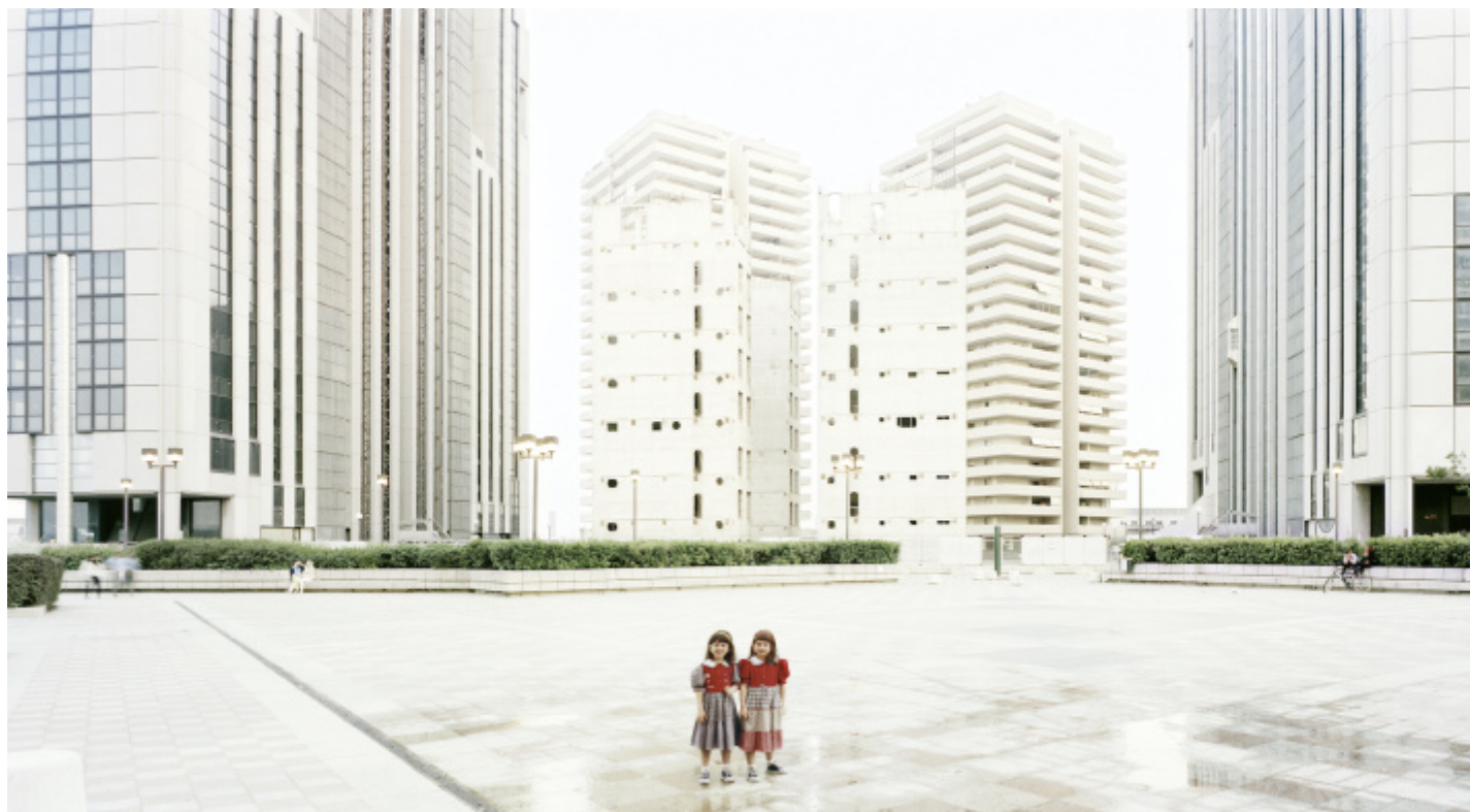
Cartoline dagli altri spazi, Naples #12, 1996.

Lo sviluppo del suo lavoro è conseguente, è la sua riflessione su ciò che è accaduto negli ultimi decenni: dalla consapevolezza che lo spazio è diventato "altro" alla constatazione che la storia è finita, che l'Occidente da tempo si sta perdendo, che il cambiamento in atto è irreversibile. Ce lo racconta in maniera chiara e lineare. Le sue immagini sono altrettanto straight , tutte a fuoco, grandi e grandiose, impressionanti, sempre insieme stranianti e straniate.