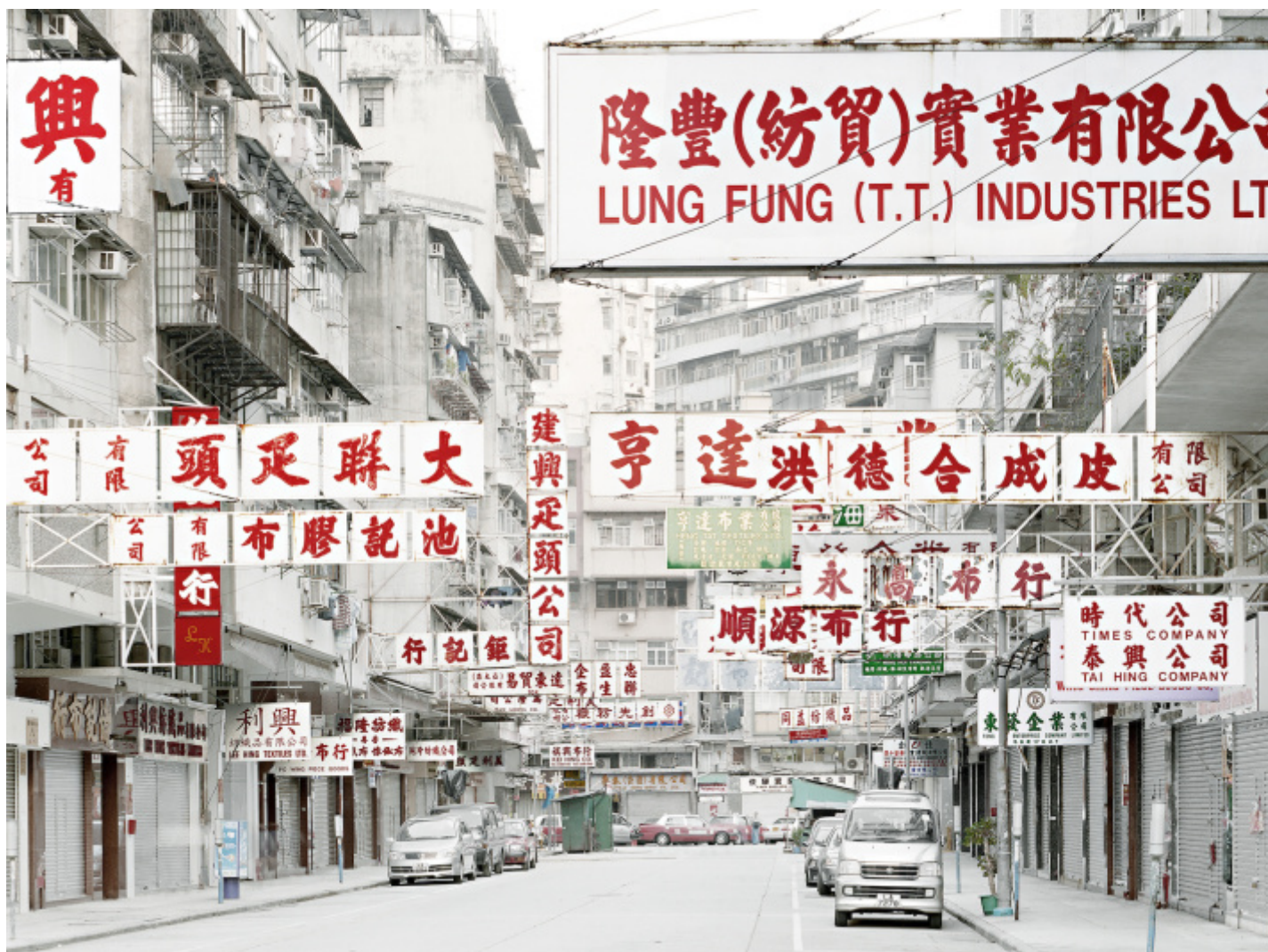
What We Want, Hong Kong, T47, 2006.

EG: Il secondo progetto, What We Want , del 2006, riguarda il paesaggio come proiezione del desiderio.