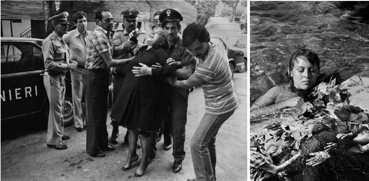
Letizia Battaglia, Disperazione di una madre convinta che le abbiano ucciso il figlio, Capaci 1980, e Letizia Battaglia, Rielaborazione (la madre crede le abbiano ucciso il figlio), 2005.

l'artista, o forse si tratta solamente di spostare il punctum : "il punctum non è più il morto ammazzato o il bandito arrestato o la miseria estrema. Il punctum è quello che io oggi metto davanti".