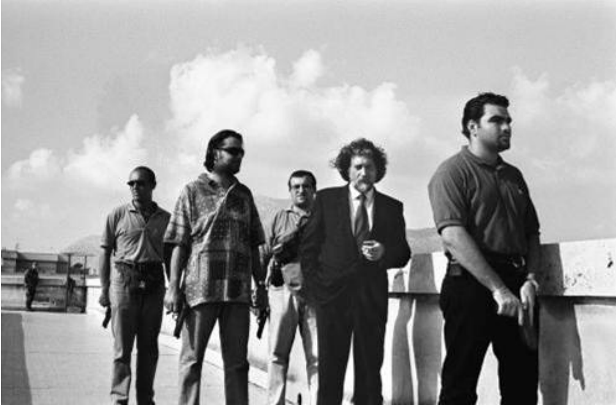
Letizia Battaglia, Tribunale di Palermo, 1998. Il magistrato Roberto Scarpinato con la sua scorta, durante gli anni in cui fu Pubblico Ministero al processo contro Giulio Andreotti, poi assolto per prescrizione di reato, Palermo 1998.

Quasi come se l'artista volesse suggerire che il futuro è interamente fuori dall'immagine coincide con lo spettatore catturato empaticamente dal gioco dialettico delle immagini, anch'egli indotto a mettere in discussione il proprio modo di guardare, a vedere a sua volta nella realtà che lo circonda un possibile futuro da migliorare. Forse, direbbe Letizia Battaglia, proprio con la fotografia.