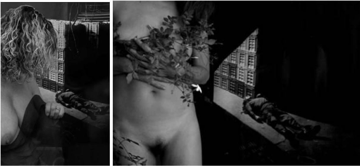
Letizia Battaglia, Rielaborazione (Chiara e l'uomo ucciso tra le cassette) , 2009 e Rielaborazione (L'albero secco) , 2009.