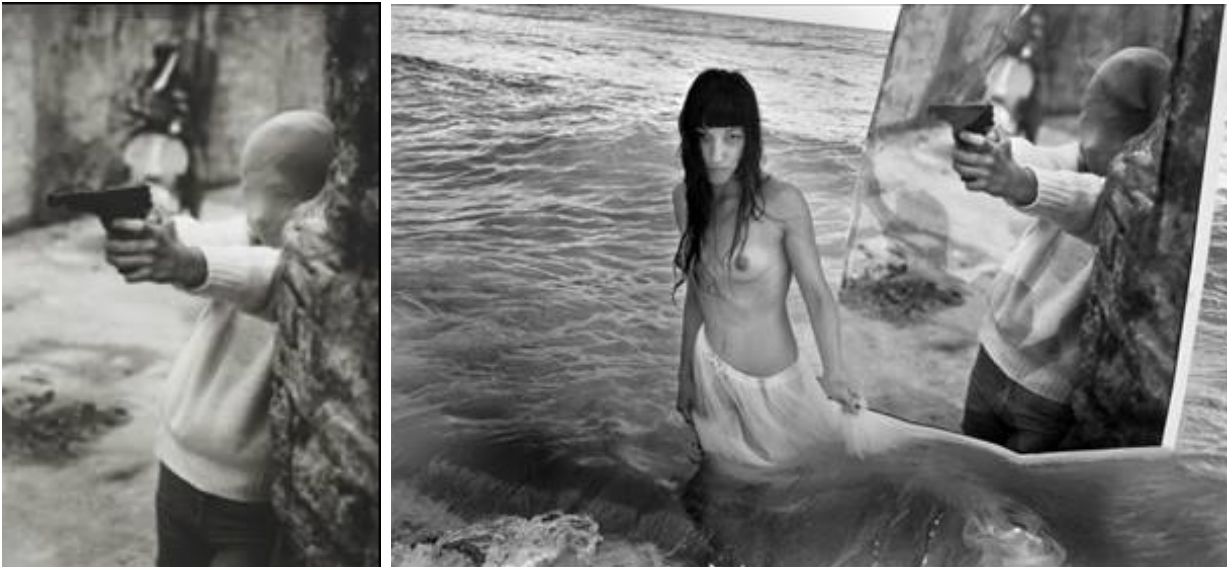
Letizia Battaglia, Il gioco del killer , Palermo 1982 e Rielaborazione (Il gioco del Killer, Palermo 1982) , 2012.

Se è quasi impossibile scindere l'opera di Francesca Woodman dalla sua sorte, silenzioso segreto che resta intimo e illeggibile, con Letizia Battaglia ho parlato. O meglio è stata lei a parlare con me. Io ho saputo dire solo il mio nome. Poco prima di uscire dalla galleria con un catalogo e la sua firma, mi ha detto: “Inizia a fotografare. Non per gli altri, per te stessa”.