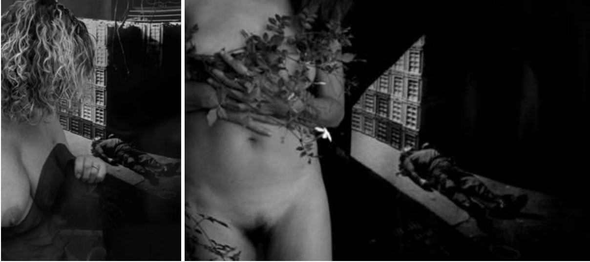
Letizia Battaglia, Rielaborazione (Chiara e l'uomo ucciso tra le cassette) , 2009 e Rielaborazione (L'albero secco) , 2009.