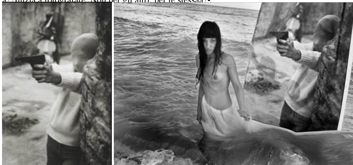
Letizia Battaglia, Il gioco del killer, Palermo 1982 e Rielaborazione (Il gioco del Killer, Palermo 1982), 2012.

Se è quasi impossibile scindere l'opera di Francesca Woodman dalla sua sorte, silenzioso segreto che resta intimo e illeggibile, con Letizia Battaglia ho parlato. O meglio è stata lei a parlare con me. Io ho saputo dire solo il mio nome. Poco prima di uscire dalla galleria con un catalogo e la sua firma, mi ha detto: "Inizia a fotografare. Non per gli altri, per te stessa".