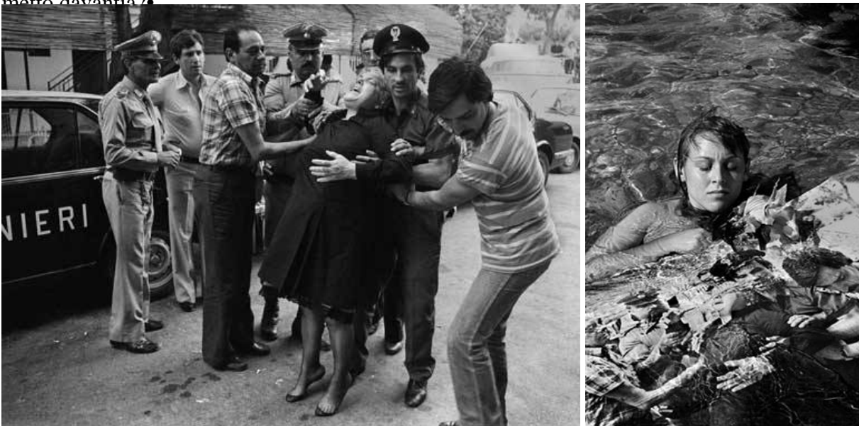
Letizia Battaglia, Disperazione di una madre convinta che le abbiano ucciso il figlio , Capaci 1980, e Letizia Battaglia, Rielaborazione (la madre crede le abbiano ucciso il figlio) , 2005.

Letizia Battaglia riproduce alcune fra le sue immagini piÃ¹ significative, le fa stampare in grande formato e le fotografa nuovamente insieme a una modella che interagisce con il soggetto: â??un poâ?? come rinnegare il passatoâ?• spiega lâ??artista, o forse si tratta solamente di spostare il punctum : â??il punctum non Ã¨ piÃ¹ il morto ammazzato o il bandito arrestato o la miseria estrema. Il punctum Ã¨ quello che io oggi metto davantiâ?•