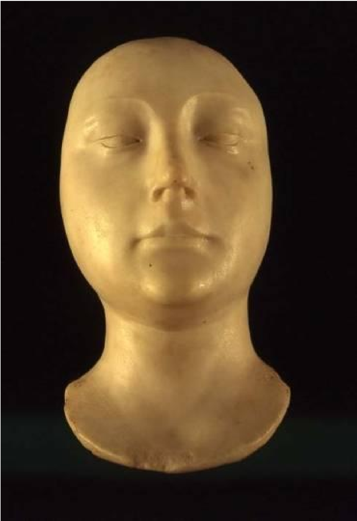
Francesco da Laurana, Masque de femme, ultimo quarto XV sec., marmo, Chambéry, Musée des Beaux-Arts

Il museo Ã, per antonomasia, luogo di immagini culturali sedimentate e che necessitano di una riattivazione per sopravvivere. Ma le stesse immagini sono â?luoghiâ?, pellicole visive che tremano e si tendono,