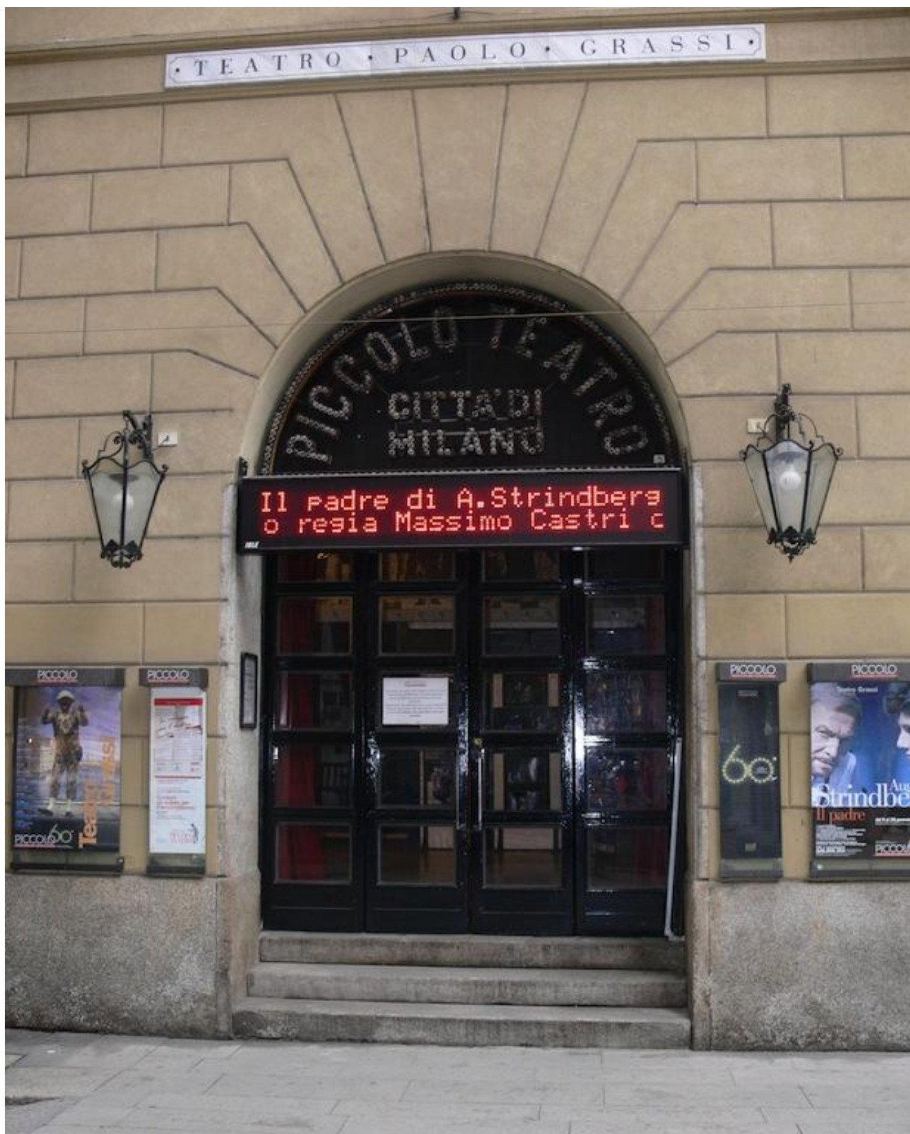
Piccolo Teatro di Milano

Se n'è parlato anche alle Buone Pratiche a Firenze nei giorni scorsi, un'iniziativa itinerante che si svolge annualmente sotto la direzione di Mimma Gallina e Oliviero Ponte di Pino di " Ateatro " e che, riunendo intorno a tematiche di pressante attualità buona parte della scena italiana, è stata definita "gli Stati Generali del teatro". Il Direttore Generale dello Spettacolo dal vivo, Salvatore Nastasi, special guest della giornata, nel rispondere a cinque domande selezionate fra quelle proposte dalla community che ruota intorno all'iniziativa,