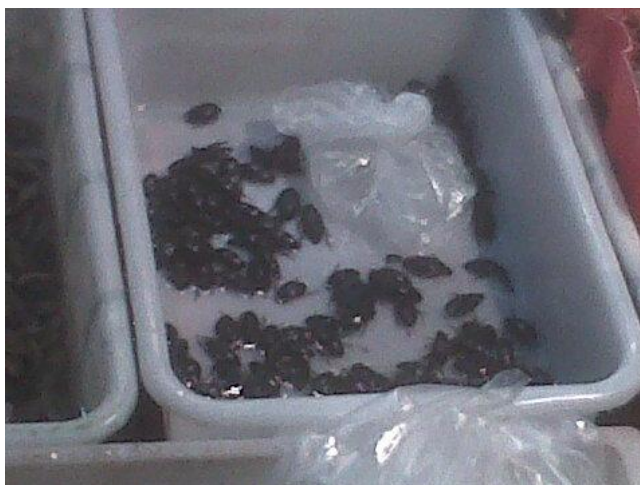
Mercato del pesce a Canton

Due sono i passages della città: in superficie il fiume Zhu Jiang le cui acque risultano ferme rispetto alle onde umane che camminano lungo le sue sponde, e la metropolitana, immenso labirinto sotterraneo. Lì non è consentito sbagliare stazione o entrata, non si riuscirebbe a cambiare direzione, il flusso di gente che si muove rende ognuno parte del suo spostamento: si perde la propria corporeità e si diviene una mera direzione, parte di un’unica corrente.