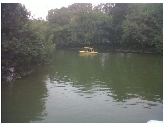
Parco Yuexiu a Canton

A Guangzhou (Canton), nella “Delirious Guangzhou” come direbbe Rem Koolhaas, tutto è amplificato. L’ultramoderno centro sportivo del distretto di Tianhe, che ingloba nel suo spazio lo stadio dove il Guangzhou di Marcello Lippi ha appena vinto il campionato, convive con lo sterminato parco Yuexiu, una sorta di micro succursale della foresta amazzonica nel centro della città e il mercato del pesce, dove nei frigoriferi ci sono cocodrilli congelati e sulle bancarelle scarafaggi vivi in attesa di essere serviti nei ristoranti del mercato.