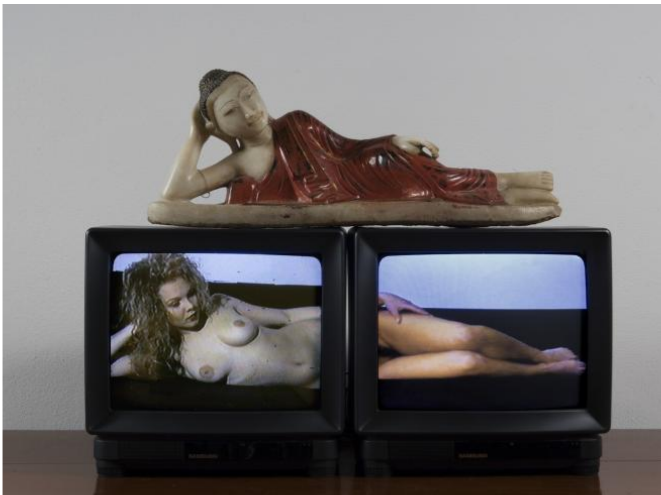
Sacro e profano , 1993. 2 monitor con video e scultura, collezione privata.

È a partire da questo patrimonio, oltre a quello di altri importanti collezionisti del territorio emiliano e non (come Antonina Zaru e Carlo Cattelani) che a oltre dieci anni dall'ultima mostra museale italiana dedicata all'artista, la Galleria Civica di Modena ha scelto di presentarci il lavoro di Nam June Paik proprio da questo punto di vista, aprendo la pubblico fino al 2 giugno la mostra Nam June Paik in Italia , oltre cento lavori, documenti editoriali e fotografici provenienti dal territorio emiliano che raccontano lo scambio tra l'artista e l'Italia soprattutto nel periodo della sua massima frequentazione, tra gli anni Settanta e Novanta.