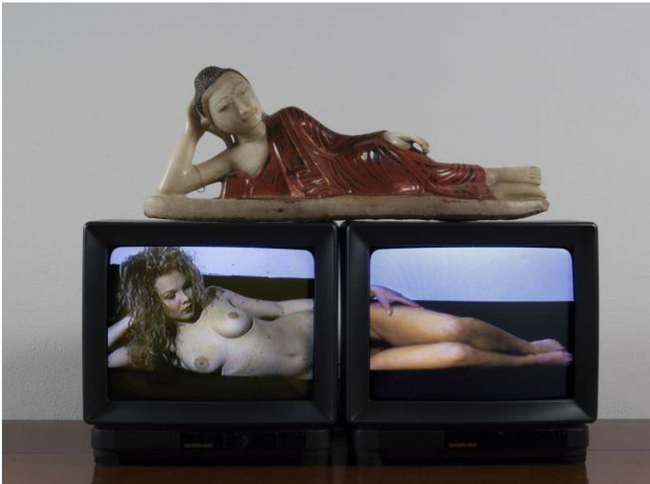
Sacro e profano , 1993. 2 monitor con video e scultura, collezione privata.