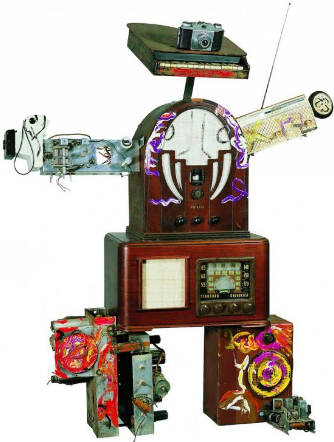
Luciano Pavarotti, 1995. Radio, monitor e oggetti vari, collezione privata.

Diplomatosi su Arnold Schönberg, Paik studia e pensa la musica come una totalità che comprende tutto, tutti i sensi, tutte le possibilità dell'esperienza. Ed è con questo pensiero che approda all'opera italiana, in cui, dice, "c'è tutto: la musica, il