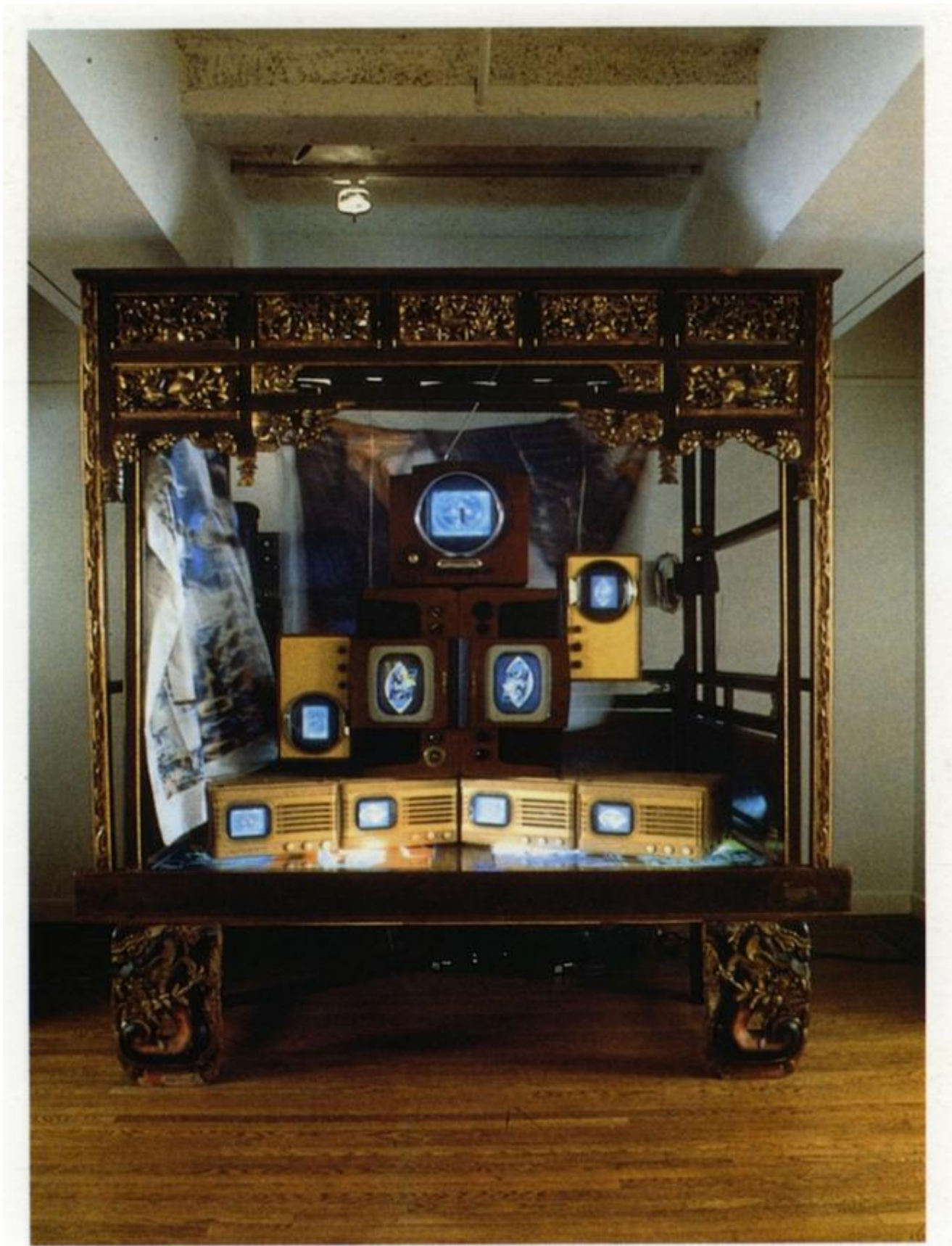
Young Buddha on Duratrans Bed , 1989-1992. Letto a baldacchino cinese con tela in seta, piano base composto da 2 lastre in plexiglas con foto e 2 neon all'interno, 4 monitor incassati in una radio d'epoca, 2 video laser disc, 2 video reader disc, collezione privata.