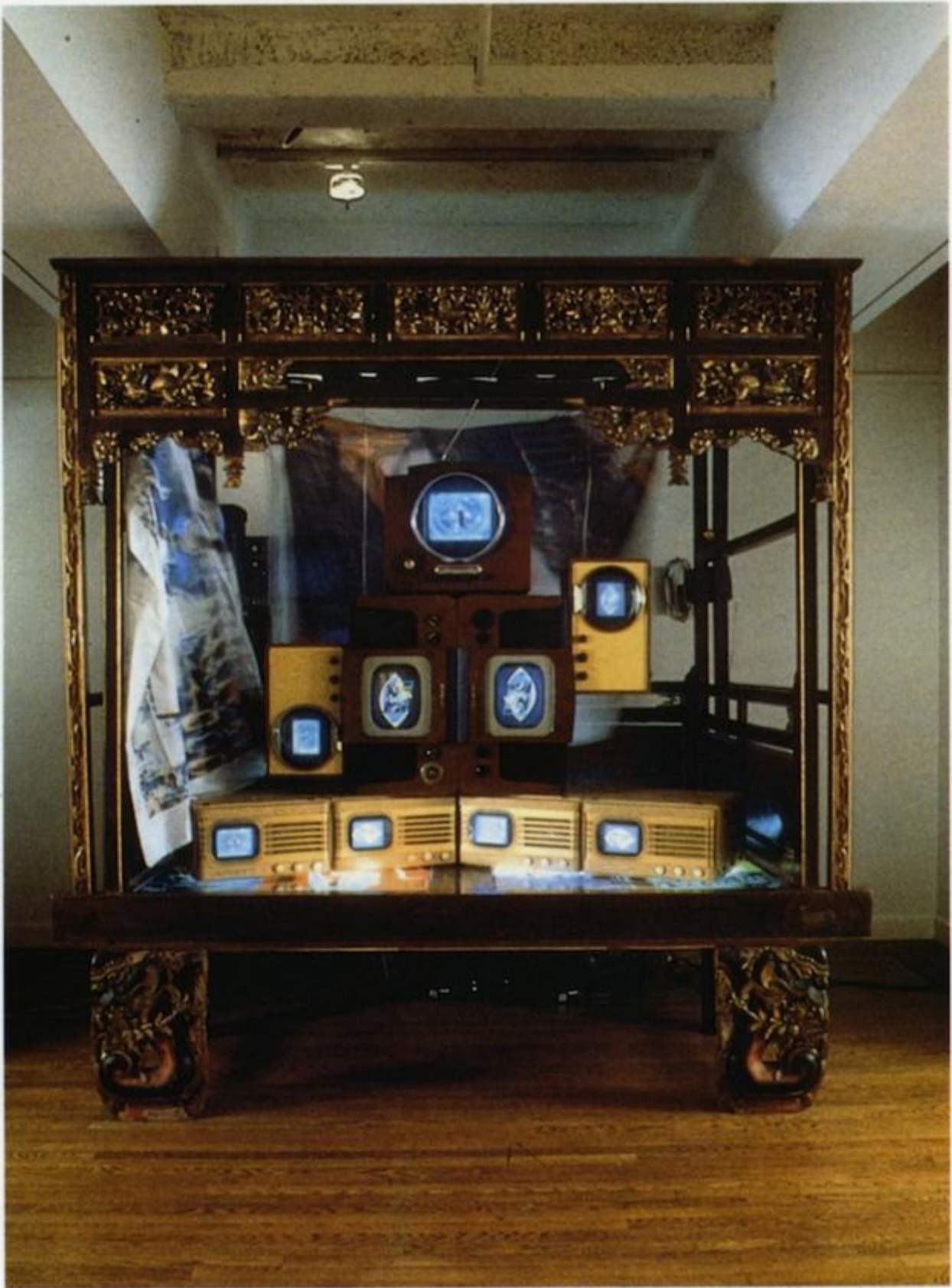
Young Buddha on Duratrans Bed , 1989-1992. Letto a baldacchino cinese con tela in seta, piano base composto da 2 lastre in plexiglas con foto e 2 neon all'interno, 4 monitor incassati in una radio d'epoca, 2 video laser disc, 2 video reader disc, collezione privata.