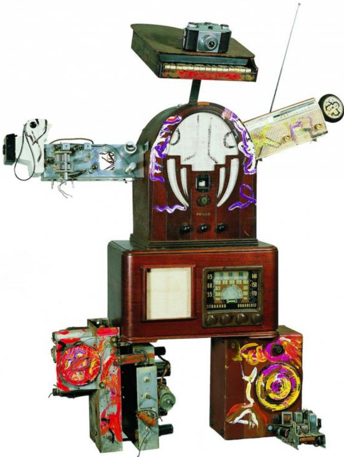
Luciano Pavarotti, 1995. Radio, monitor e oggetti vari, collezione privata.

Diplomatosi su Arnold Schönberg, Paik studia e pensa la musica come una totalità che comprende tutto, tutti i sensi, tutte le possibilità dell'esperienza. Ed è con questo pensiero che approda all'opera italiana, in cui, dice, "c'è tutto": la musica, il movimento, lo spazio. Il primo personaggio italiano che ho incontrato nel mio percorso è stato il tenore Beniamino Gigli... Poi ho visto La Traviata in Corea. Ricordo che dopo averla vista non riuscii a dormire, l'impressione fu enorme.