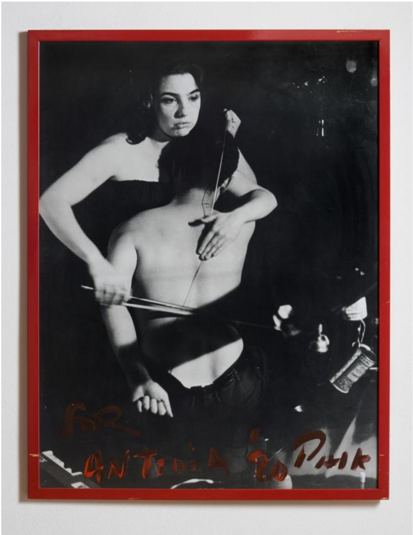
Images of John Cage's 26â??1.1499 for a String Player Performance at the Caf  Go-Go, New York, 1990. Fotografia e pittura, collezione privata.

Nam June Paik   un artista che lâ??ha sperimentato, proprio quando il mezzo televisivo ha iniziato ad essere lâ??amico fedele delle famiglie benestanti americane (ma non solo) del secondo dopoguerra.