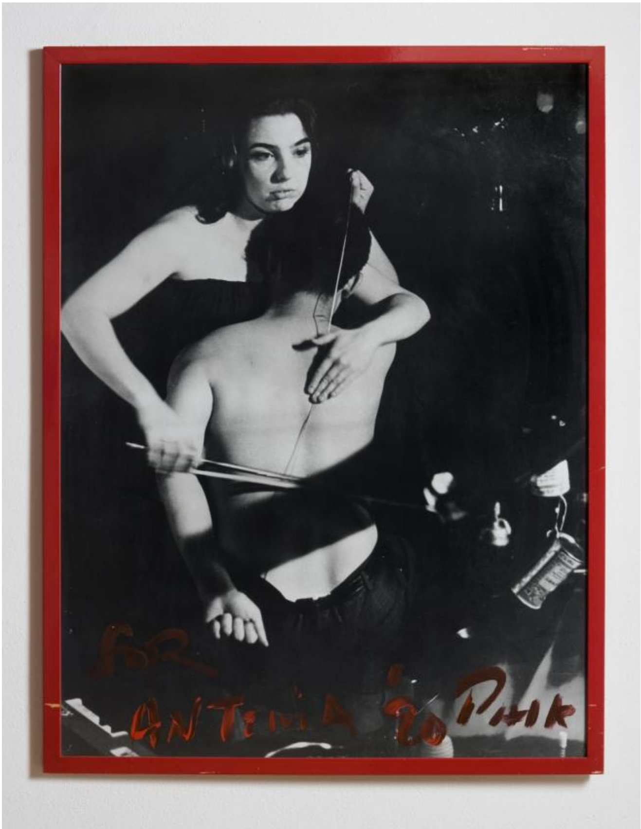
Images of John Cage's 26'1.1499 for a String Player Performance at the Café Go-Go, New York, 1990. Fotografia e pittura, collezione privata.

Nam June Paik è un artista che l'ha sperimentato, proprio quando il mezzo televisivo ha iniziato ad essere l'amico fedele delle famiglie benestanti americane (ma non solo) del secondo dopoguerra.