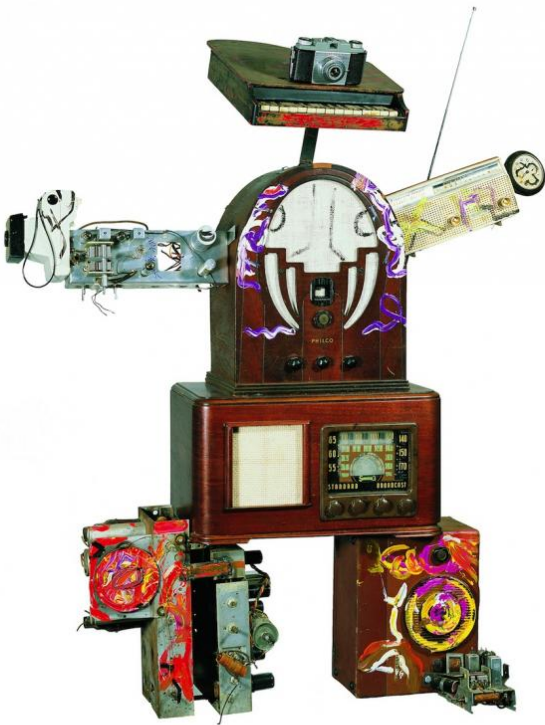
Luciano Pavarotti, 1995. Radio, monitor e oggetti vari, collezione privata.

Diplomatosi su Arnold Schönberg, Paik studia e pensa la musica come una totalità che comprende tutto, tutti i sensi, tutte le possibilità dell'esperienza. Ed è con questo pensiero che approda all'opera italiana, in cui, dice, "c'è tutto: la musica, il movimento, lo spazio". "Il primo personaggio italiano che ho incontrato nel mio percorso è stato il tenore Beniamino Gigli... Poi ho visto La Traviata in Corea. Ricordo che dopo averla vista non riuscii a dormire, l'impressione fu enorme."