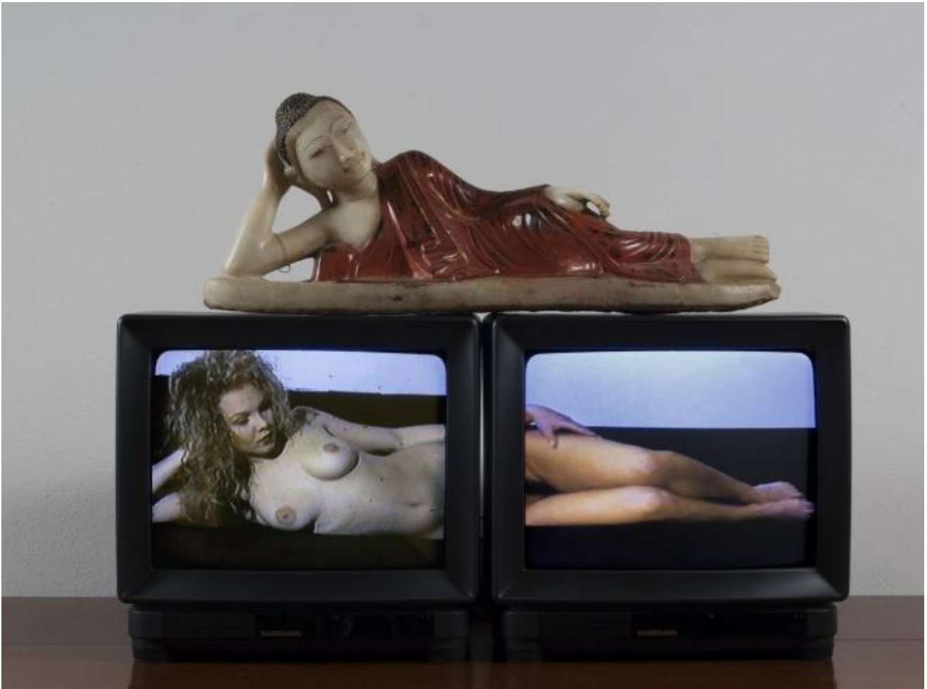
Sacro e profano , 1993. 2 monitor con video e scultura, collezione privata.

In Italia Paik realizza diverse opere “scultoree” e dedica alle nostre città, all’inizio degli anni Novanta, un’intera serie di “quadri composti”. A questo periodo appartengono anche i famosi “robot”, con i loro corpi fatti di grammofoni, valvole, manopole e bottoni, radio e ferri da stiro, tra cui spiccano personaggi italiani come Pavarotti e Giuseppe Verdi ( Oriental Painting, Direttore d’Orchestra, Luciano Pavarotti, Maria Callas, Giuseppe Verdi , tutte del 1995); così come Sacro e Profano (1993), dove un buddha disteso strizza l’occhio a una donna seducente ingabbiata dietro al monitor; o, ancora, il Young Buddha on Duratrans Bed (1989-92), composto da strani apparecchi radio-televisivi disteso su un letto a baldacchino cinese.