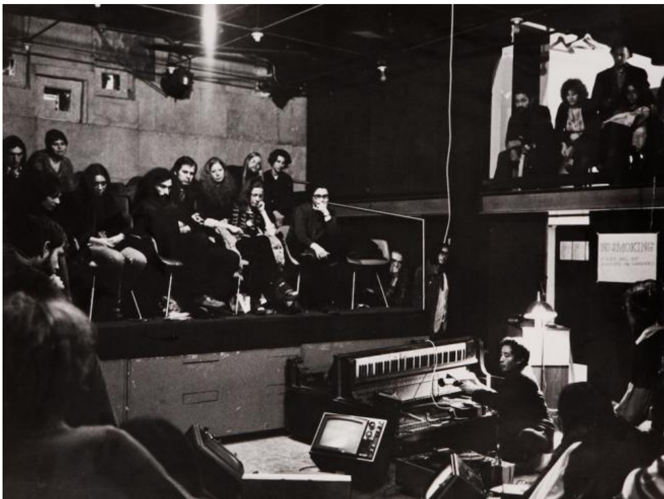
The Intravenous Feeding of Charlotte Moorman, IX Annual Avant Garde Festival of New York, stampa 1972. Dall'album Charlotte Moorman and Nam June Paik, 1964-74, Edizioni Pari & Dispari, 1975. Serie n. 12/15.

Se continuiamo a tenere vivo questo spazio è grazie a te. Anche un solo euro per noi significa molto. Torna presto a leggerci e SOSTIENI DOPPIOZERO