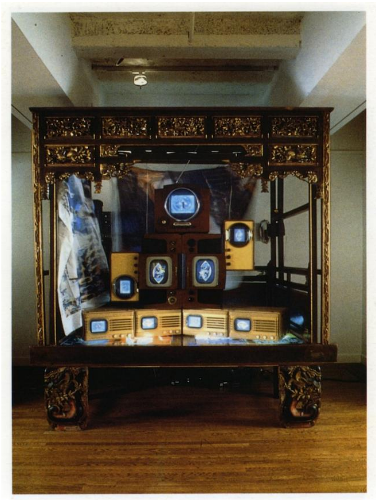
Young Buddha on Duratrans Bed , 1989-1992. Letto a baldacchino cinese con tela in seta, piano base composto da 2 lastre in plexiglas con foto e 2 neon all'interno, 4 monitor incassati in una radio d'epoca, 2 video laser disc, 2 video reader disc, collezione privata.