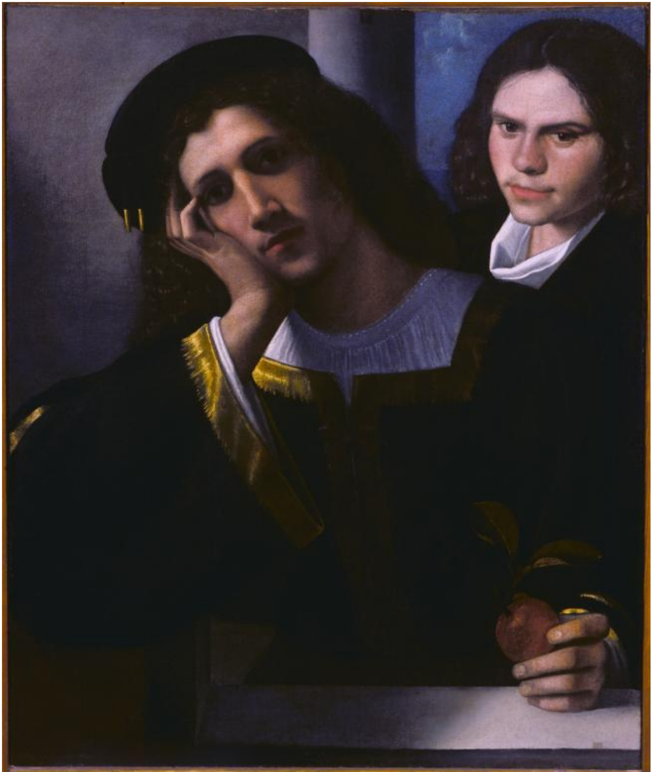
Giorgione, Doppio Ritratto, Roma, Palazzo Venezia

volta compaiono i caratteri romani in uso ancora oggi. Alziamo gli occhi dall'incunabolo e ci troviamo di fronte il Ritratto di giovane con libro verde di Giorgione. Anche lui ha appena alzato gli occhi dal suo libro, un oggettino che si tiene con una mano sola, mentre l'altra indossa un guanto che lascia i polpastrelli nudi, per sfogliare meglio le pagine; È il lettore moderno, in una delle sue prime apparizioni. Nei primi anni del cinquecento Bembo e Giorgione danno forma a una nuova soggettività maschile, Bembo con gli Asolani , i dialoghi in volgare sull'amore pubblicati nel 1505, e Giorgione con opere come il Doppio ritratto, che accosta un giovane malinconico e uno acceso e diretto, come i due protagonisti degli Asolani .