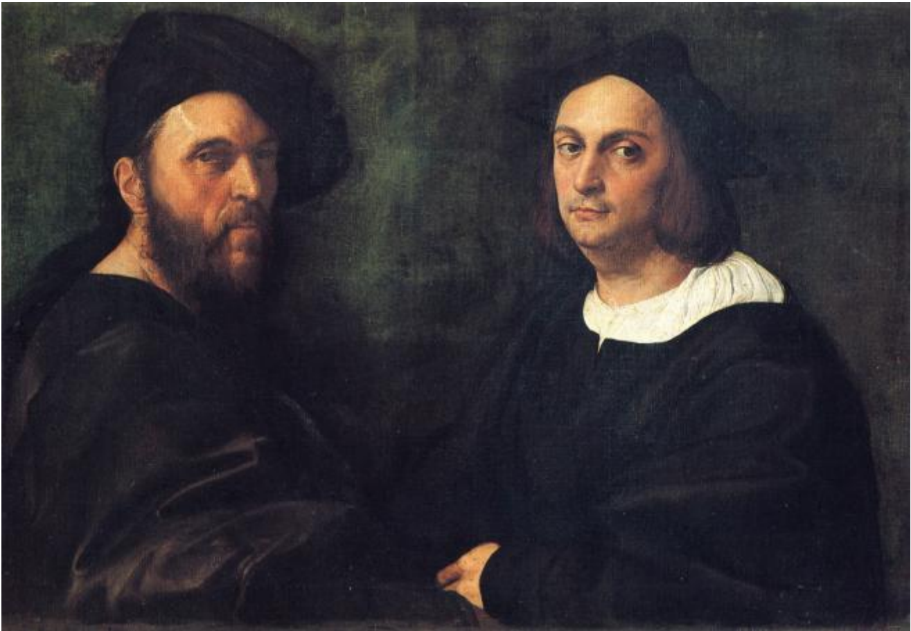
Raffaello, Ritratto di Navagero e Beazzano, Roma, Galleria Doria

Come gli artisti visivi imitano le antichità Bembo teorizza l'imitazione di Cicerone e Petrarca, ma il suo fine è normativo non sperimentale. La tesi della mostra è che Bembo risponde alla crisi politica italiana codificando il rinascimento, e che il suo percorso è uno dei miti fondatori dell'identità italiana e delle possibili risposte alle ricorrenti e terribili crisi che la travolgono. I curatori hanno raccolto una sfida divulgativa ambiziosissima: raccontare come prendono forma le idee senza inciampare nella filologia o nella specialistica. A giudicare dagli sguardi incantati e assorti dei visitatori è una sfida vinta. Ed è sempre un piacere scoprire che la complessità non spaventa nessuno.