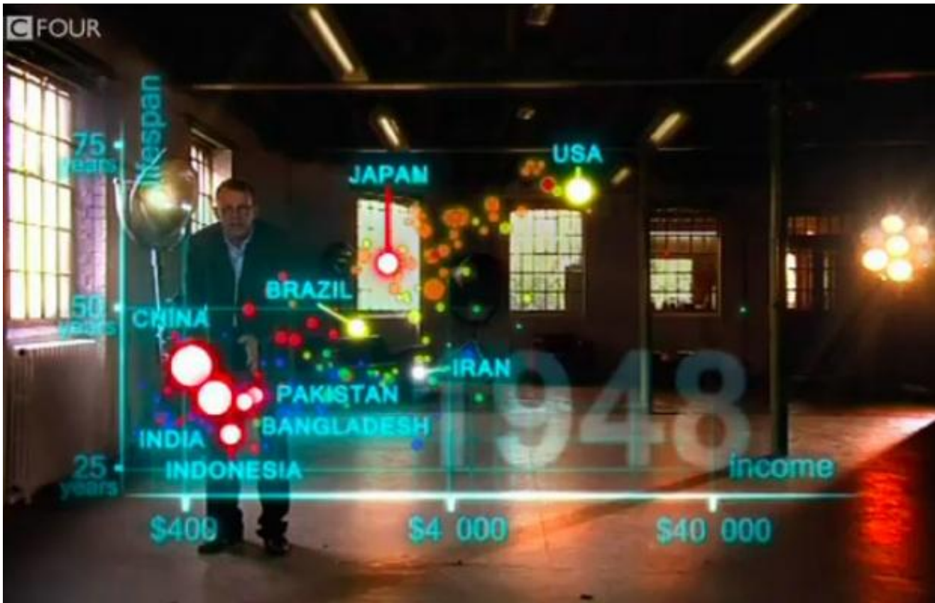
Hans Rosling, Gapminder

Concludendo, molte persone sostengono che i dati siano il nuovo petrolio ("data is the new oil"), ma qual è la nuova benzina, per te? Qual è l'effetto sociale più concreto, correlato al facile e massiccio accesso ai dati, che puoi vedere o prevedere?