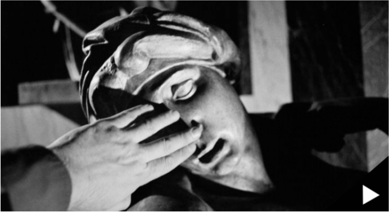
A Close Up View, UCR California Museum of Photography © Evgen Bavcar

Il mondo visuale, quello interno, dei soggetti patologici non solo non viene intaccato, ma spesso viene coltivato con passione, crescendo senza limitazioni e, nonostante le enormi difficoltà espressive dei soggetti afasici o anomici, esso sembra essere inversamente proporzionale alle privazioni dovute alle disfunzioni che li affliggono. Ma, a partire da un'altra esperienza personale, quella di un tumore oculare e della successiva perdita parziale della vista, l'autore avvicina il mondo delle malattie neuronali a quello delle patologie della vista, compiendo un accostamento che si incastra perfettamente e che insiste sull'ampio plesso estetico della percezione. L'occhio interiore, cioè l'occhio della mente, viene nutrito anche in mancanza di uno stimolo esteriore ed è grazie a ciò se non possiamo contrapporre cecità e percezione. Tranne in un unico, eccezionale caso. Quello di John Hull, professore di scienze religiose in Inghilterra, colpito da problemi visivi fin da bambino, fino a divenire totalmente cieco a partire dai quarantotto anni. Hull precipita in una condizione che lui stesso definisce "cecità totale" ma, con il passare del tempo, egli assume fino in fondo la propria situazione, concependo la cecità non come una mancanza, ma come un nuovo ordine, una nuova modalità dell'umano che gli permette di entrare in una stretta intimità con la natura. La vista diventa così una parola progressivamente spogliata di senso, fino a diventarne totalmente priva.