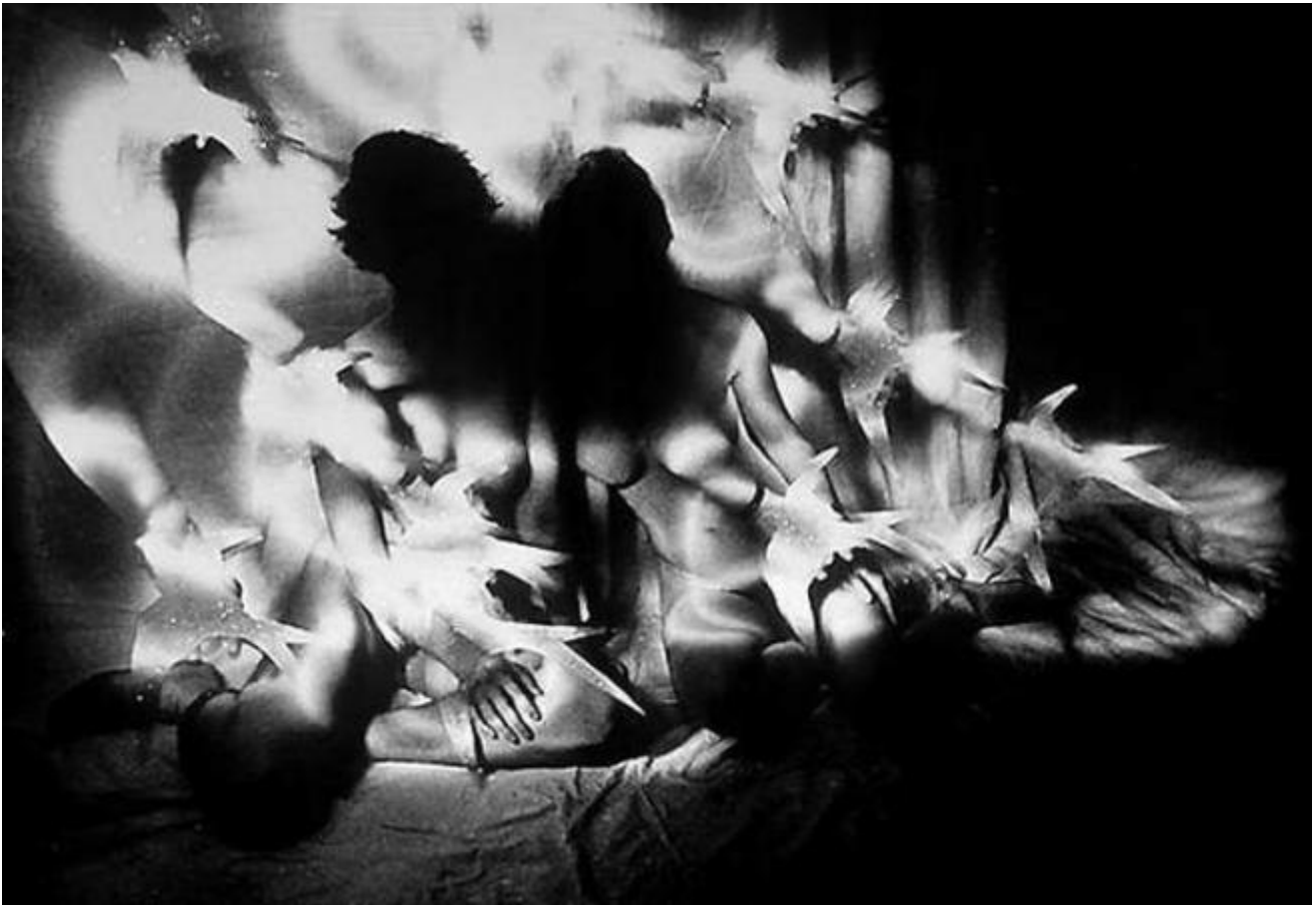
Deux nus aux hirondelles © Evgen Bavcar

Ma se l'individuo alessico mantiene una comprensione frammentaria della singolarità, colui il quale viene colpito da agnosia visiva perde la capacità di riconoscere la singola unità. Volti, oggetti, parole e perfino le immagini cadono in un indistinto nel quale è estremamente difficile rintracciare punti fissi, riconoscibili e riconosciuti, che possano permettere l'attivazione di una rieducazione logopedistica. Gli oggetti e le stesse immagini in quanto tali perdono il loro carattere sintetico, ritornando ad una frammentazione che desta meraviglia ad ogni sguardo. Vista e immagine sono intrinsecamente legate ed un'interruzione dell'una ha ripercussioni immediate sull'altra.