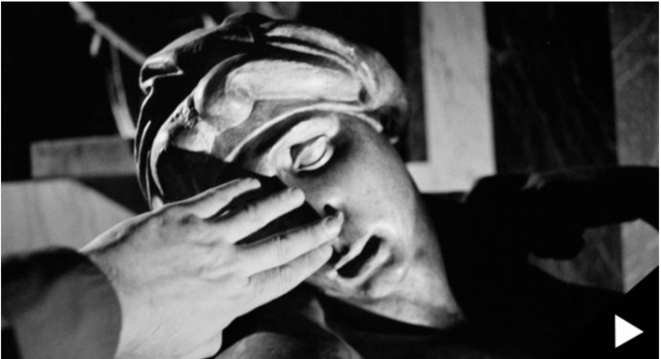
A Close Up View, UCRCalifornia Museum of Photography © Evgen Bavcar

conoscente fuori contesto, può dar luogo a forti incomprensioni. L'individuo prosopagnosico ricorre ad escamotage per cercare di riconoscere la persona che ha di fronte (ascoltando attentamente la loro voce, guardando i loro gesti o il loro abbigliamento), e questa è una vera e propria ricerca indiziaria, che si avvicina moltissimo a quella del detective. Il riconoscimento diviene questione probativa ed il colpevole deve essere in qualche modo incastrato. La confessione è puramente ottica, mossa ed alimentata dall'esterno.