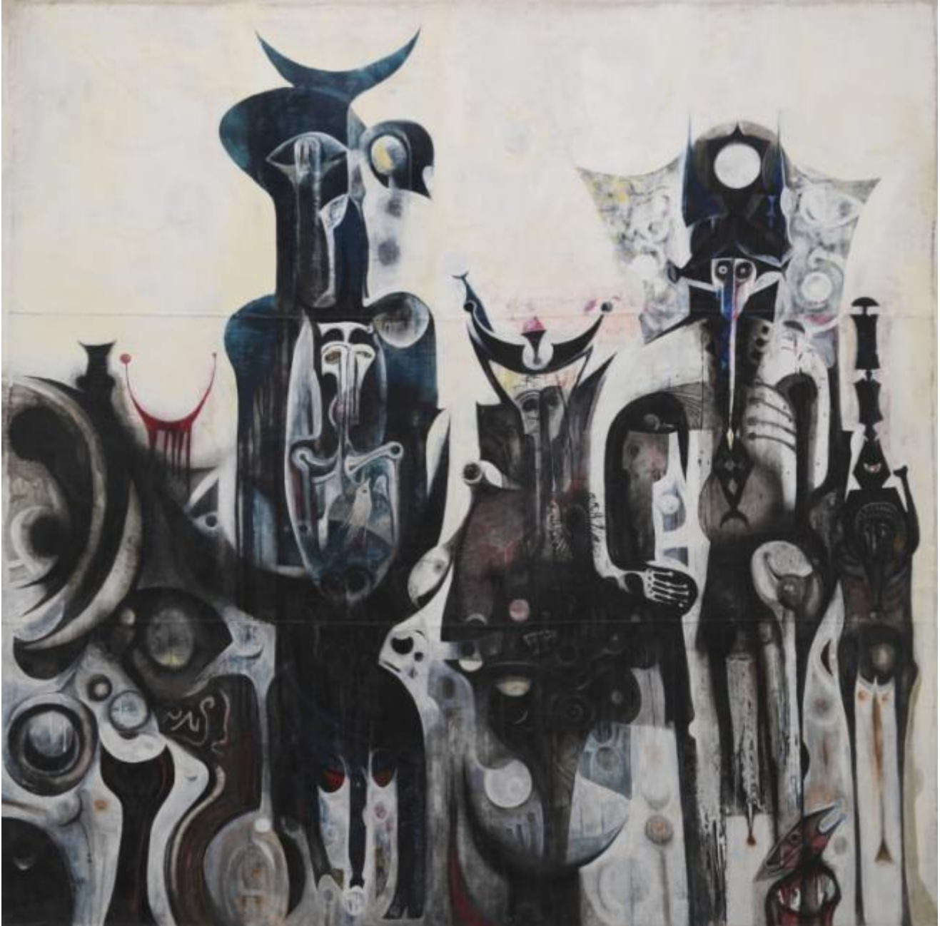
Ibrahim El-Salahi Reborn Sounds of Childhood Dreams I 1961-65 © Ibrahim El-Salahi Tate, Purchased using funds provided by the African Acquisitions Committee and Middle East North Africa Acquisitions Committee 2012

Così come i quadri del periodo in cui pitturava rifacendosi ai colori della sua terra, mescolando terra e pigmento sulle tele e costruendo delle immagini corpose, che escono dalla bidimensionalità per diventare quasi corporee. Mentre in Europa e Stati Uniti si passava dalla tela alla "situazione", El-Salahi usciva dalle due dimensioni scolpendo lo spazio nella tela, ri-mediando al contempo la bidimensionalità di un medium occidentale (la pittura appunto) ed uno orientale, la calligrafia.