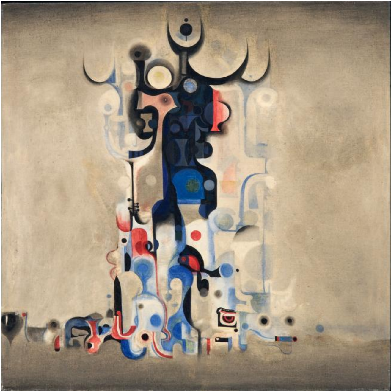
Ibrahim El-Salahi Vision of the Tomb 1965 Oil on canvas Museum for African Art, New York © Ibrahim El-Salahi

Dai primi ritratti degli anni Quaranta, figli di una scuola d'arte fortemente legata alle avanguardie storiche europee e figurative, la mostra percorre il cammino dell'artista sudanese fino ad oggi, di pari passo con la sua vita di pittore, attaché culturale presso diverse ambasciate sudanesi, prigioniero politico nelle carceri di Khartoum ed esule. Le Mémoires di El-Salahi, da poco pubblicate in arabo e che la Tate tradurrà e pubblicherà dopo l'estate, ripercorrono la vita eccezionale di un uomo che ha esposto al MoMA di New York, lavorato come attore ed illustratore per le novelle del grande scrittore sudanese Tayeb Salih e non ha smesso di pitturare nemmeno in carcere, dove ha continuato a produrre di nascosto, usando una penna a biro e dei fogli di quaderno.