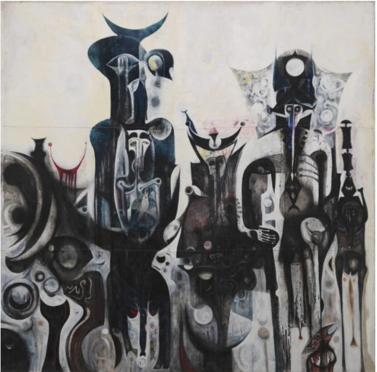
Ibrahim El-Salahi Reborn Sounds of Childhood Dreams 1 1961-65

La mostra di El-Salahi è un momento importante di costruzione della storia del Modernismo, mostrando come la distruzione della cultura tradizionale operata durante il colonialismo abbia veicolato la produzione artistica del continente verso un processo attivo e creativo di assimilazione e rielaborazione di forme, metodi e processi importati dall'Europa a partire dai primi anni del Novecento, attraverso la fondazione di linguaggi, anche attraverso le generazioni di artisti formati in Occidente e poi tornati nel continente per lavorare come artisti o professori.