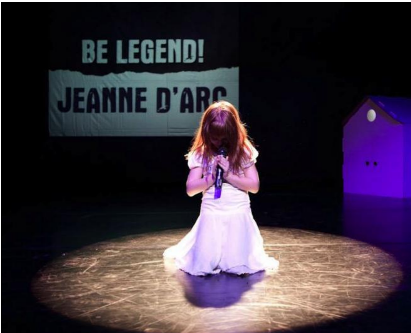
BE LEGEND! di Teatro Sotterraneo

Una coproduzione di Short Theatre invece è l'ultima appendice del lavoro sui Discorsi che il gruppo ravennate Fanny&Alexander sta portando avanti da circa un biennio. Dopo Santarcangelo, Giallo è sbarcato a Roma; è strettamente connesso a Discorso giallo , un progetto che pone al suo centro il tema della pedagogia televisiva. Giallo si presenta sotto forma di radiodramma dal vivo. Al centro della scena un edificio-scuola in miniatura all'interno del quale si andranno sviluppando le vicissitudini e gli incontri di una classe di bambini e della loro insegnante.