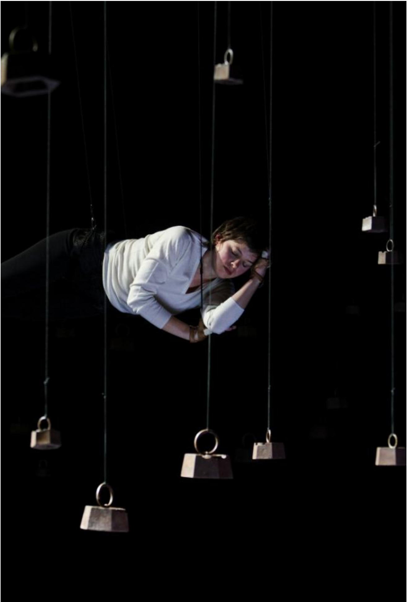
Nos solitudes di Julie Nioche