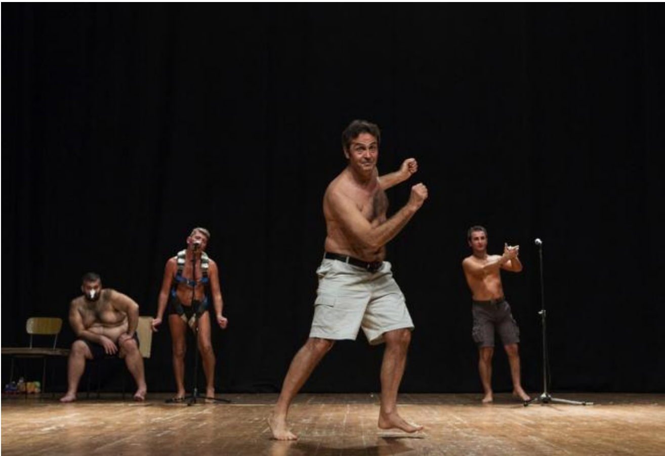
Pinocchio di Babilonia Teatri

Una storia che sa di antico e di semplicitÃ dove si attua una sorta di ribellione morale grazie al fiorire di cultura critica. Ironico e tagliente, La semplicitÃ ingannata resta nella memoria e permette un parallelo interessante tra ieri e oggi facendo riflettere sullo spessore e sull'intensitÃ dello status acquisito dalle donne negli ultimi decenni. Sul palco, secondo una modalitÃ giÃ testata ma che funziona davvero bene, sei pupazze riescono a dare un volto (molto curioso) alle clarisse. CuscunÃ dÃ loro voce fornendo prova di una divertita versatilitÃ attoriale.