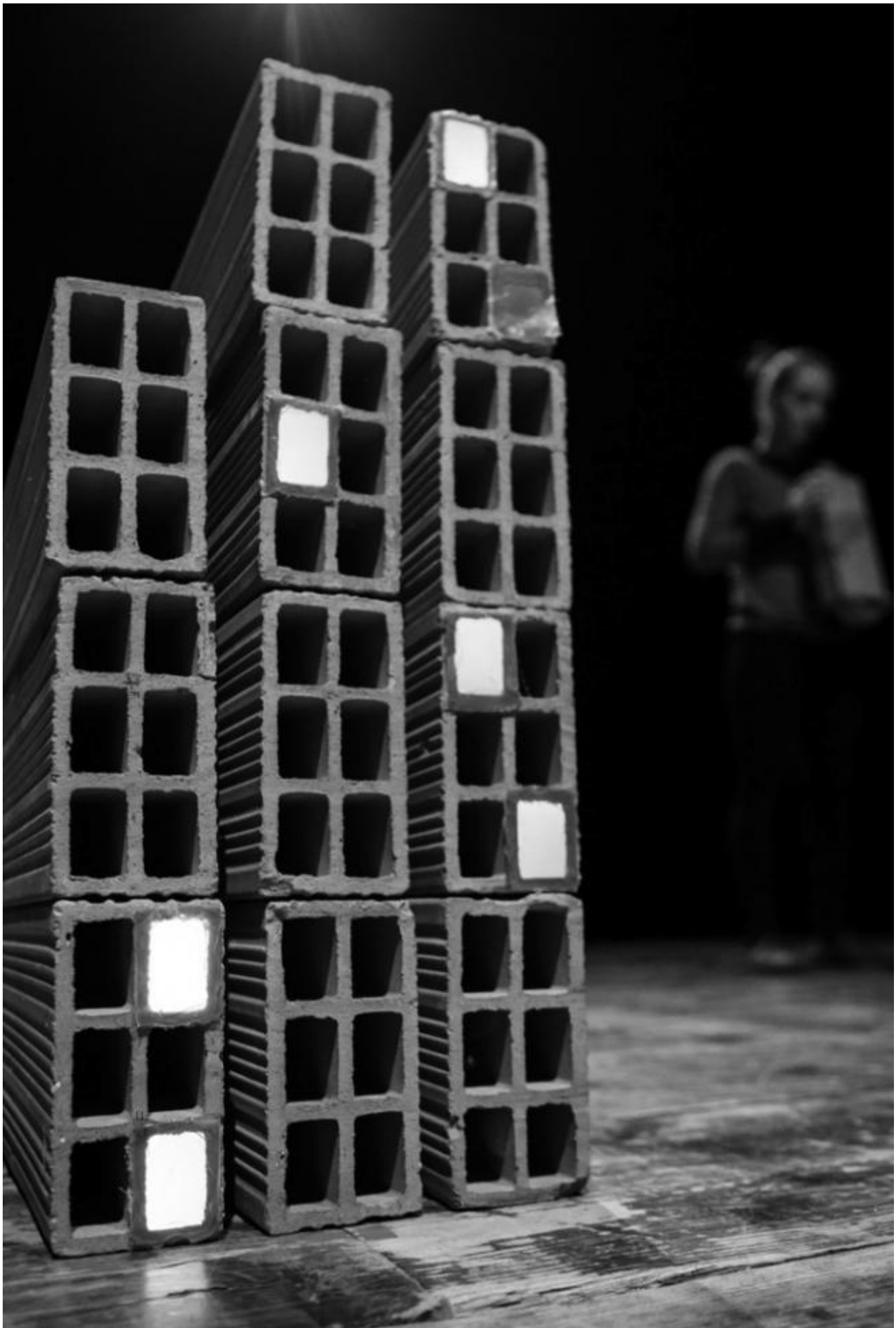
Beatrice Baruffini in W (prova di resistenza)